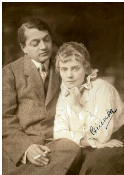
Székely: Ady és Csinszka (1915)

Ady nem csak egymaga járt fényképezkedni Székelyhez. Készült közös portré feleségével, Csinszkával, és költőtársával, Babits Mihállyal is.