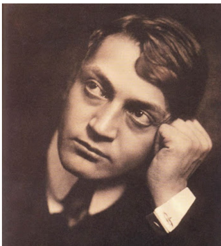
Székely: Ady Endre portréja (1908)

Székely Aladár (1870-1940) fotográfus készítette a leghíresebb portréfelvételt – lásd baloldalt – Ady Endréről.