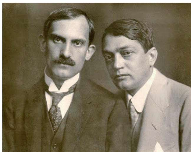
Székely: Babits és Ady (évszám ismeretlen)