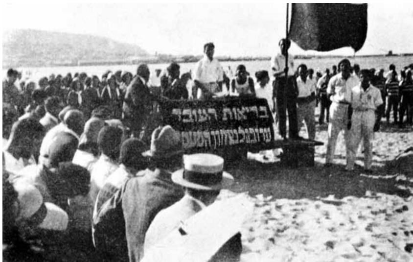
חגיגת ספורט בעפולה, 1 במאי 1925. הסיסמה: 'בריאות העובד ערובה לנצחון המעמד' הפכה להיות סיסמת 'הפועל'

ייסוד ארגון הספורט הנפרד לפועלים היה תולדה לא רק של מצב הכוחות בארץ-ישראל, אלא גם של התפתחויות פוליטיות בספורט העולמי – היווצרותו של ספורט הפועלים הבינ-לאומי. 17 בתחילת שנות העשרים נוסדה התנועה הבינ-לאומית של ספורט הפועלים סאס"י (Sozialistische Arbeiter Sport), כמענה לספורט האולימפי, שנחשב לבורגני. תנועה זו הוקמה בלוצרן שבשווייץ בשנת 1920, וכבר בשנת 1925 נמנו עמה 1.3 מיליון פועלים. 18 ארגוני הספורט שהשתייכו לסאס"י קיבלו עליהם משימות כוחניות וצבאיות, במסגרת ארגונים קדם-צבאיים כדוגמת ה'שוצבונד' (Schutzbund) האוסטרי ו'פלוגות הפועל' בארץ-ישראל, ושירתו את מפלגות הפועלים בארצותיהם. בעוד 'מכבי' ראה לו מטרה לשלב את הספורט הארץ-ישראלי בארגוני הספורט העולמיים, כמו הוועד האולימפי, החליט 'הפועל', מתוך סולידריות עם סאס"י, להימנע מזיקה לארגוני ספורט בין-לאומיים, חוץ מפ"א, התאגדות הכדורגל העולמית.