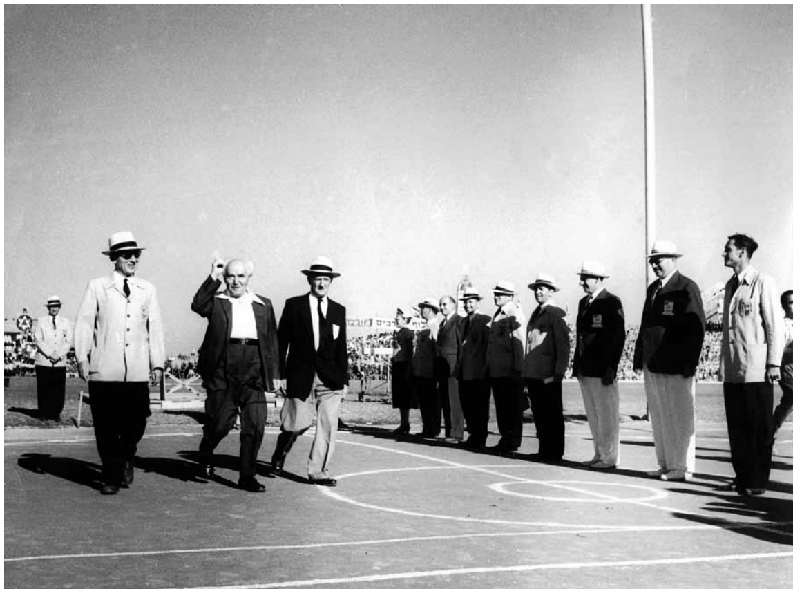
דוד בן-גוריון 'ועסקני' מכבי' בפתיחת המכבייה החמישית, ספטמבר 1957