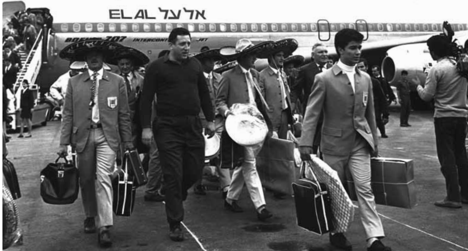
69 'עסקן בלתי מקצועי עדיף על עוזר למאמן הנבחרת', מעריב, 23 באוגוסט 1967, עמ' 5.