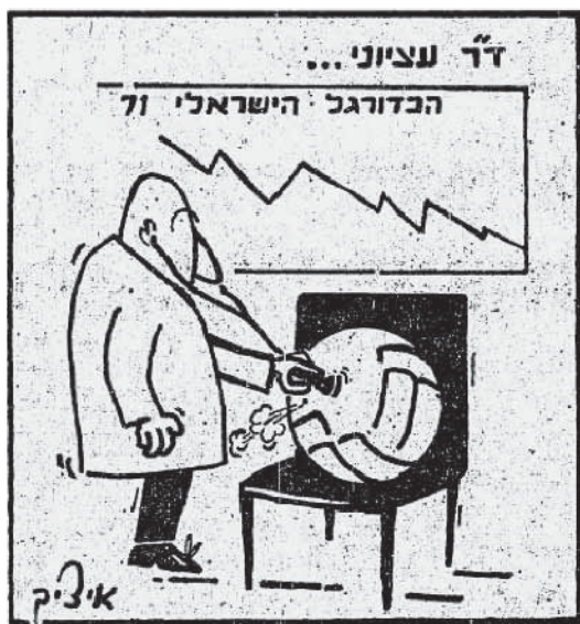
ועדת עציוני לבדיקת השחיתות בענף הכדורגל, קריקטורה של 'איציק' בעיתון דבר, 29 באוגוסט 1971

לנושא אחד: משחקי הליגה הלאומית בעונת המשחקים 1970-1971, אך עד מהרה הוברר כי הוועדה לא תוכל למלא את תפקידה כראוי אם לא תרחיב את היקף החקירה מעבר לכתב המינוי. בשל החומר הרב שהצטבר לפנייה דנה הוועדה בתרבות הניהול של הספורט בישראל. הציבור בישראל התעניין מאוד בפעילות הוועדה, ועל כך ניתן ללמוד מהמכתבים הרבים שנשלחו אליה ומכתבות בעיתונות שסקרו את ישיבותיה.