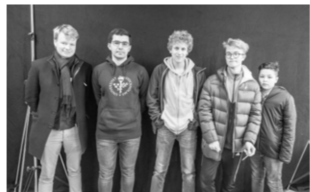
SK Rockaden Stockholm vann Juniorallsvenskan...