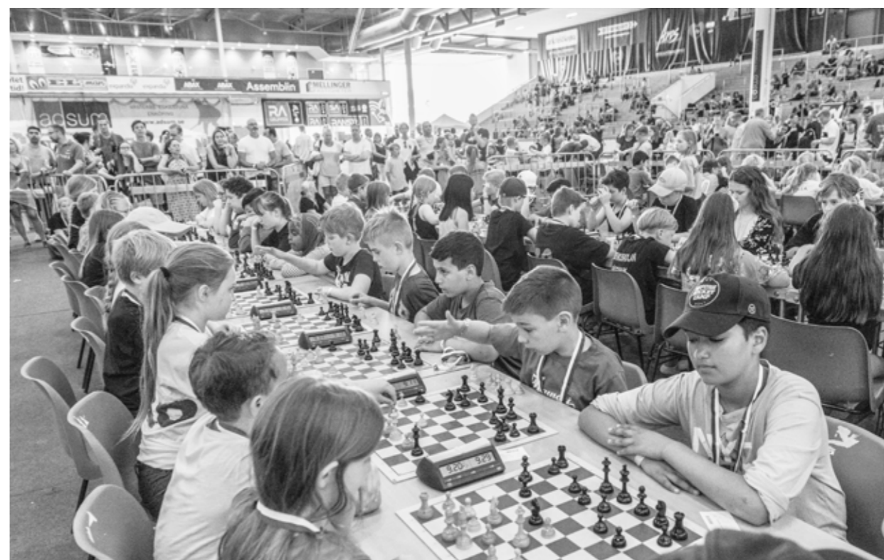
Schackfyrens riksfinal spelades i Västerås 3 juni och lockade 2 246 spelare från 127 lag.