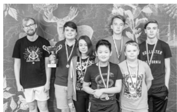
... och Västerås SK vann Kadettallsvenskan.