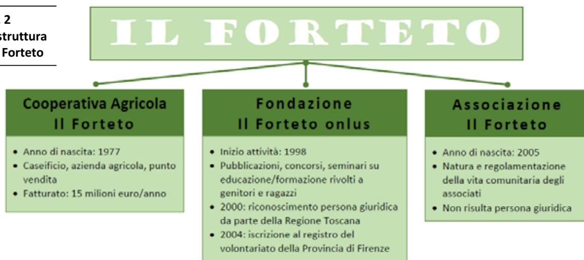
Fig. 2 La struttura del Forteto

Il Forteto è uno ma anche trino, nella sua entità giuridica tripode di cooperativa agricola, fondazione, associazione. Tripartizione alla bisogna, il sistema-Forteto si è nel tempo inventato una codificazione di sé camaleontica e multispecie: un Forteto capace di replicare se stesso in maniera ogni volta diversa quanto basta, restando in fin dei conti sempre uguale. Sempre lui: Il Forteto. Stesso impianto, stessa filosofia, stessi sottesi, stesse persone. Stessi abusi, anche, ha decretato la sentenza di primo grado emessa dal Tribunale di Firenze il 17 giugno scorso che condanna i capi carismatici Fiesoli e Goffredi coi loro fedelissimi per maltrattamenti sui minori affidati all'interno della comunità, ma chiama a rispondere in solido anche la cooperativa agricola, volto economico della comunità-setta che, attraverso le sue forme giuridiche, implementa e accresce la propria immagine, i propri crediti esterni, la propria gamma delle possibilità attraverso una presunzione bidirezionale: centripeta, come autocelebrazione di un leader, Rodolfo Fiesoli, che ritiene se stesso e la propria emanazione, Il Forteto, realtà totale e totalizzante; centrifuga, come concorrente ad alimentare quel pregiudizio positivo di cui Il Forteto ha goduto per decenni e nel quale veniva 'presunto', appunto, come autorevole, credibile, solido. E ora via: disarticoliamo il tutto.