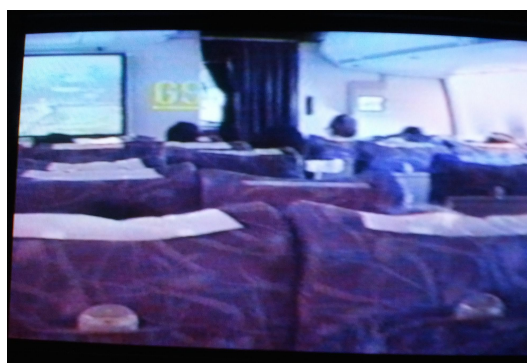
圖七：飛機內經濟艙起飛前