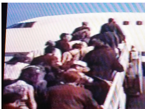
圖六：天上人正在登機