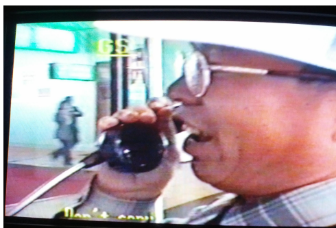
圖五：天上人打電話給台灣衛立行牧師。