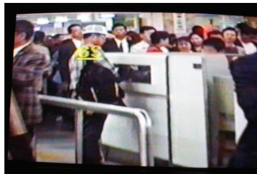
圖三： 天上人排隊在 7 號櫃檯前， 圖四： 正在接受檢查