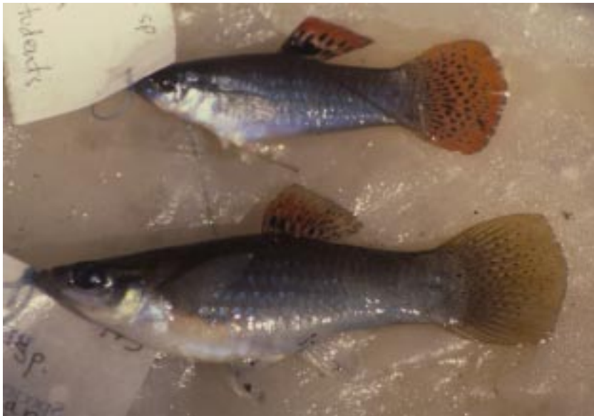
Poecilia sp. un pececito no descrito y aparentemente endémico de la Laguna de Monte Galán.