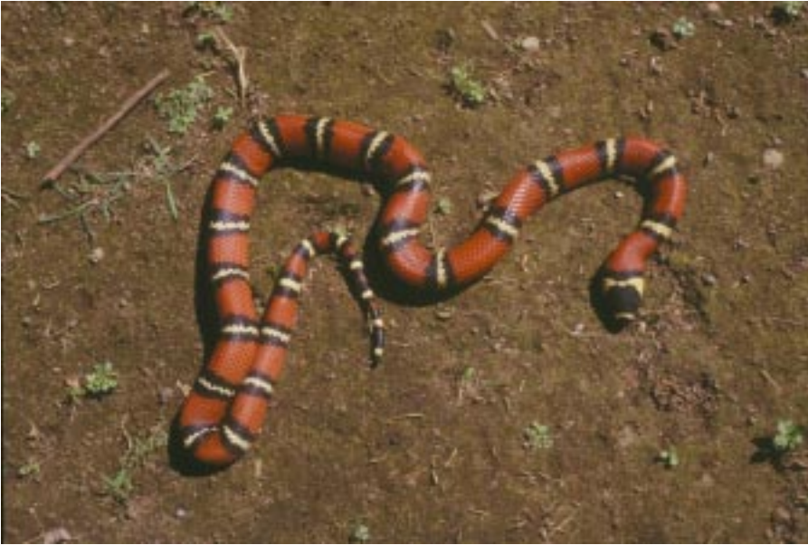
Falso Coral Lampropeltis triangulum se exporta en grandes números para el comercio internacional de mascotas.