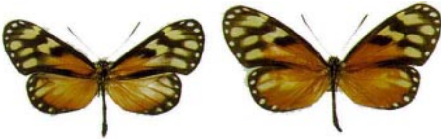
Napeogenes tolosa mombachoensis , mariposa endémica del Volcán Mombacho y las partes altas de las Sierras de Managua