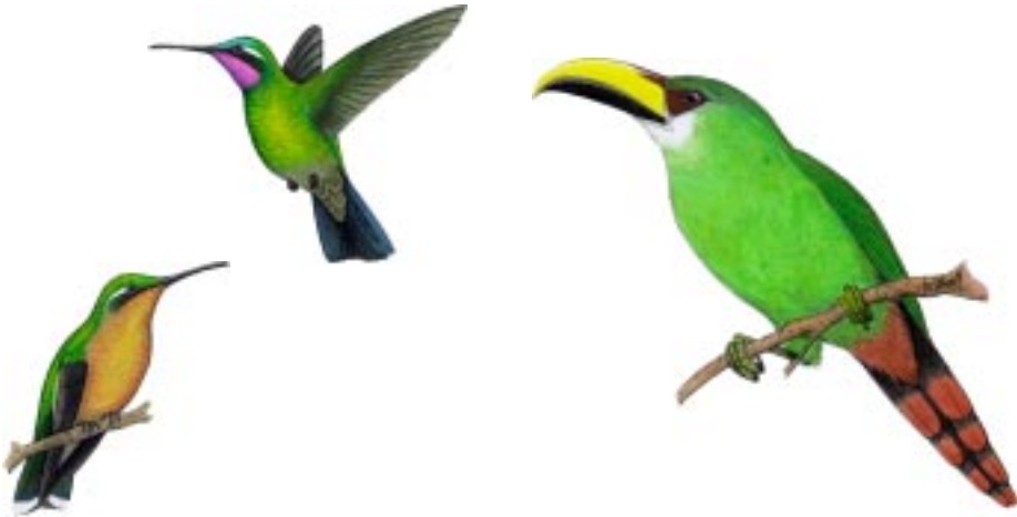
Colibrí Montañés Gorgipúrpura Lampornis calolaema