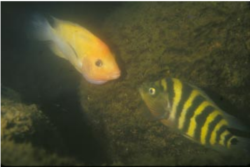
La población de Cichlasoma citrinellum en la Laguna de Xiloá puede estar constituida por más de una especie.