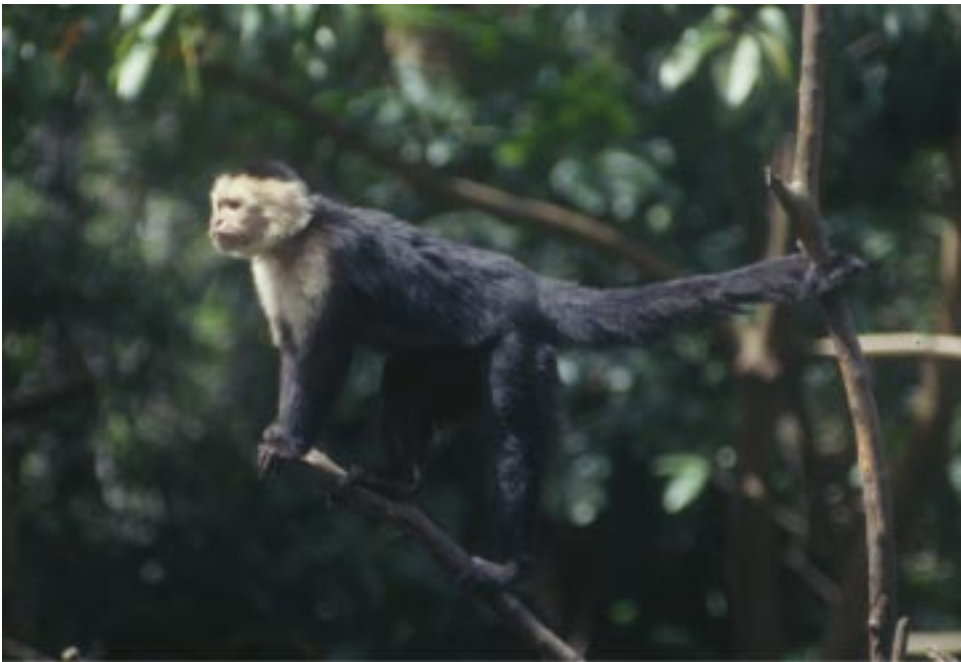
El Mono Cariblanco Cebus capucinus , una especie amenazada de extinción en las regiones Pacífica y Central del país.