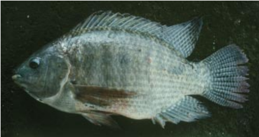
Oreochromis aureus , una de las tres especies de Tilapia introducida en Nicaragua, es una seria amenaza para los ecosistemas de agua dulce.