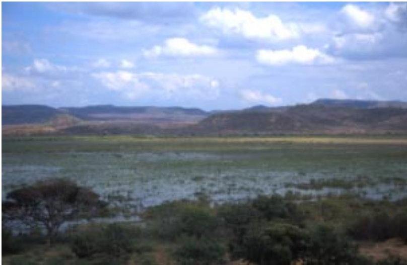
En la Laguna de Tecomapa, Dpto. de Matagalpa, se cazan miles de aves migratorias sin ningún control.