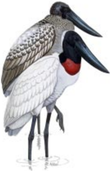
El Jabirú Jabiru mycteria , sólo se encuentra en humedales extensos y bien conservados. (Ilustración: A. Silva)