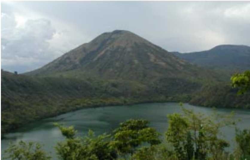
Laguna de Asososca en el Departamento de León