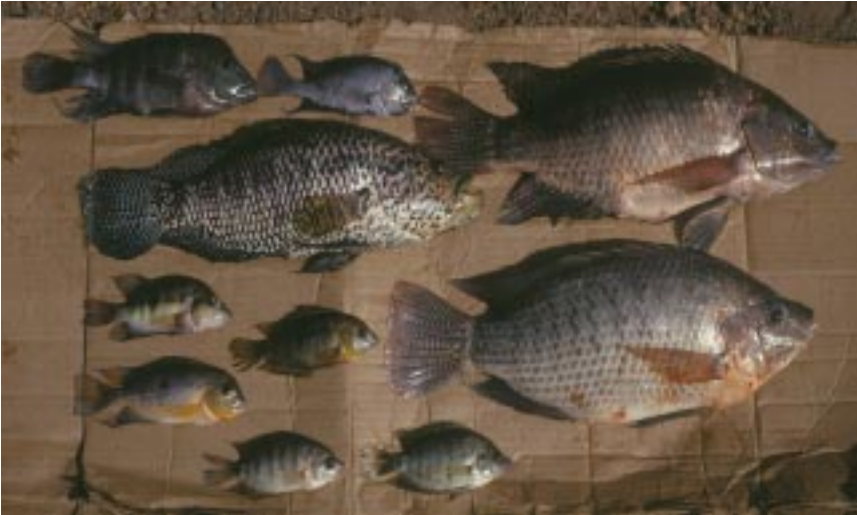
Una muestra de los Cíclidos de la Laguna Blanca (Departamento de Granada) y su comparación con una Tilapia introducida (al centro y con escamas oscuras).