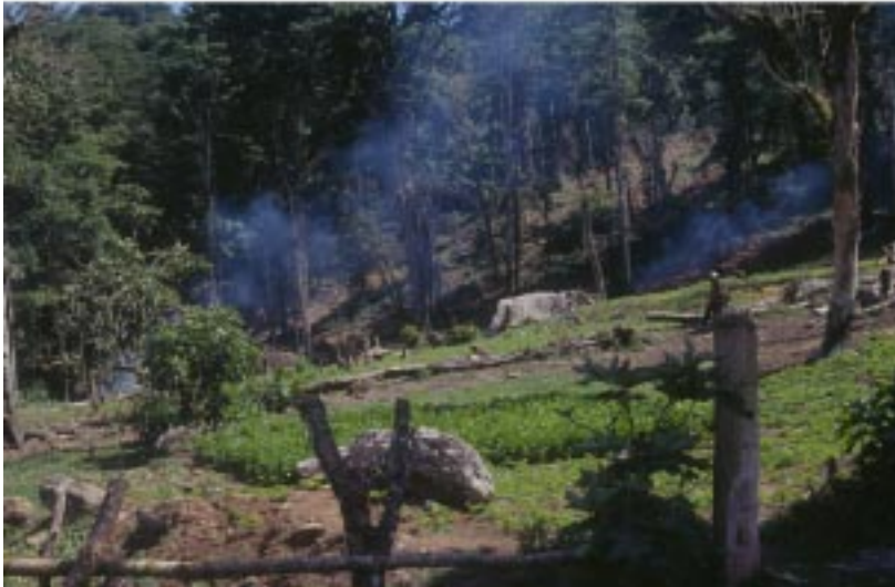
Deforestación en los bosques nubosos de la Reserva Natural Arenal, Departamento de Matagalpa.