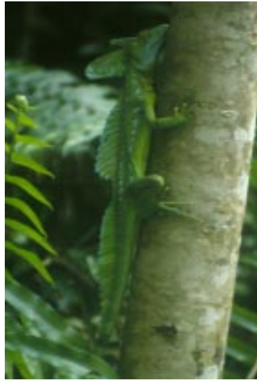
El Basilisco Basiliscus plumifrons , es muy perseguido para el comercio de mascotas.