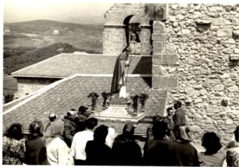
Santa Maria de Oro. 1964. ATHA AFA-DFA nº 450