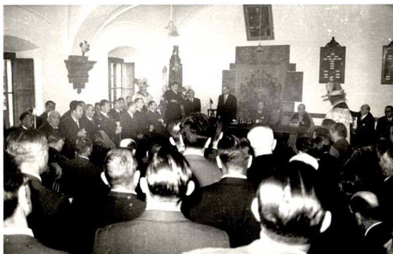
Respaldiza. 1958. ATHA. AF-DFA nº 049.

La celeridad con la que se producen los acontecimientos hace que esta primera sesión fuera eminentemente constitutiva y protocolaria.