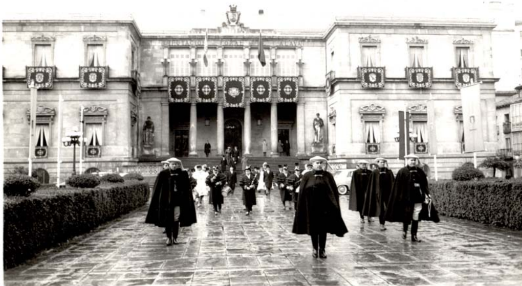
Juntas en Vitoria. Noviembre de 1964. ATHA AF-DF nº 551

históricas en las fechas en las que tradicionalmente se habían celebrado. Por otra parte se debe reconocer que lograron mantener en la sociedad alavesa, gracias a su reiterativa convocatoria, dos veces al año, la conciencia y sentir de que los intereses de los pueblos tenían un eco en la Corporación provincial, hasta tanto llegaban nuevos tiempos.