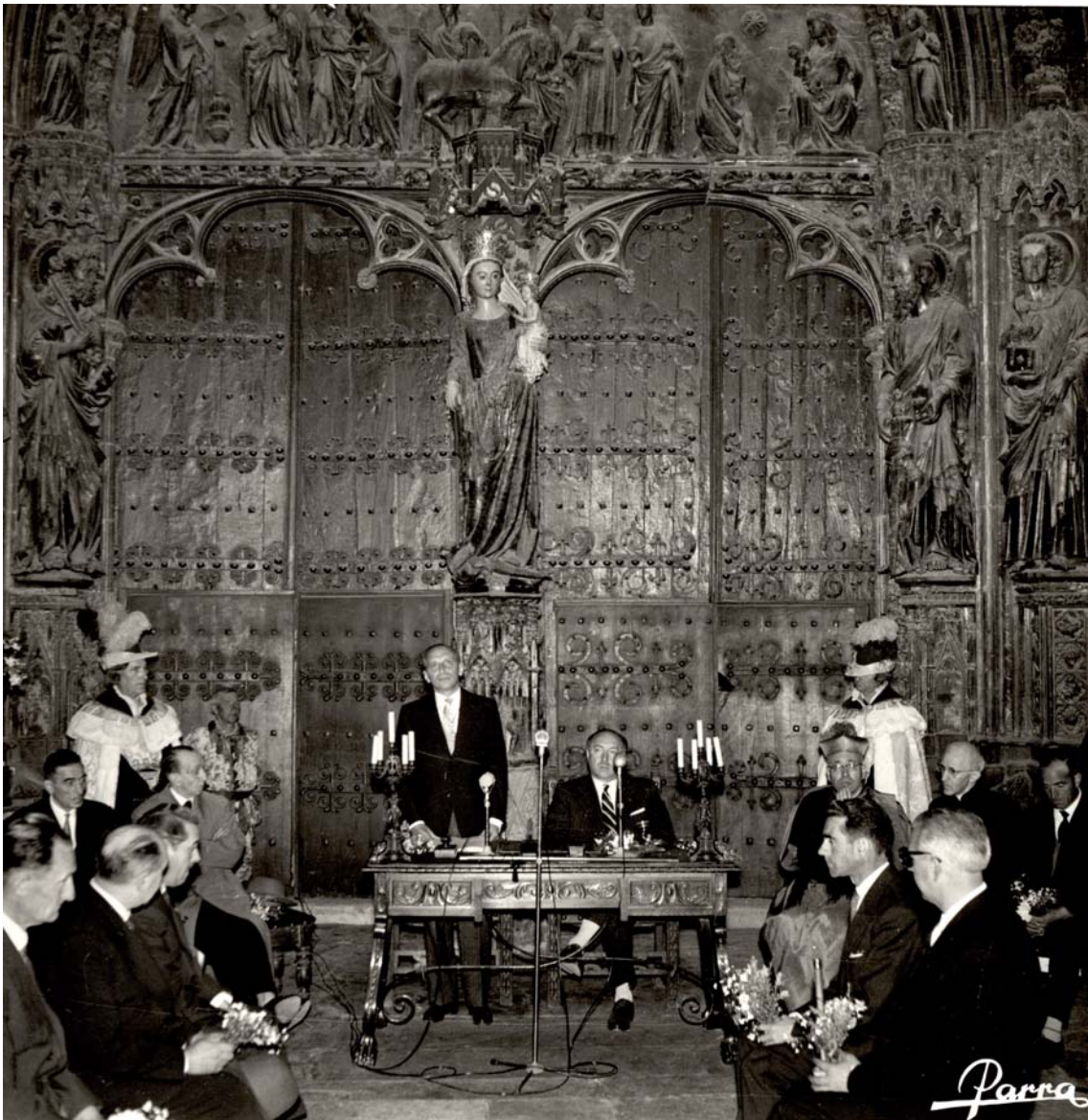
Laguardia 1960. ATHA. AFA-DFA nº 123