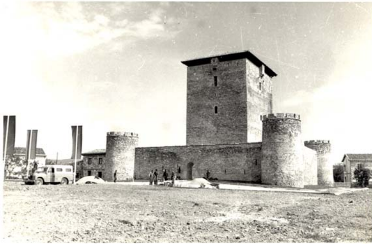
Mendoza 1963. ATHA. DFA-AFA nº 253-

religiosos, con el pretexto de acoger dignamente en ellos a los convocados, obviando los cuantiosos gastos que, en otro caso, les hubiera supuesto.