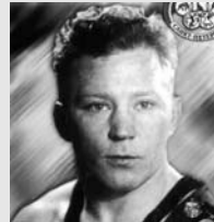
Н. Соловьёв Классическая борьба 1956