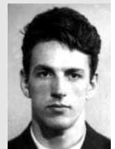
А. Бельгарт Велоспорт, 1960