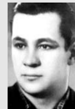
А. Перов Бокс, 1952