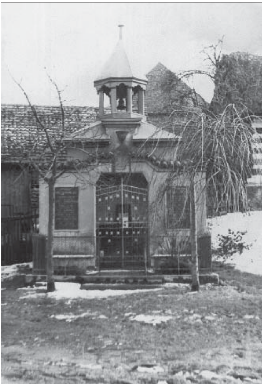
Snímek hostokryjské kaple zhotovený jen několik let po vzniku objektu