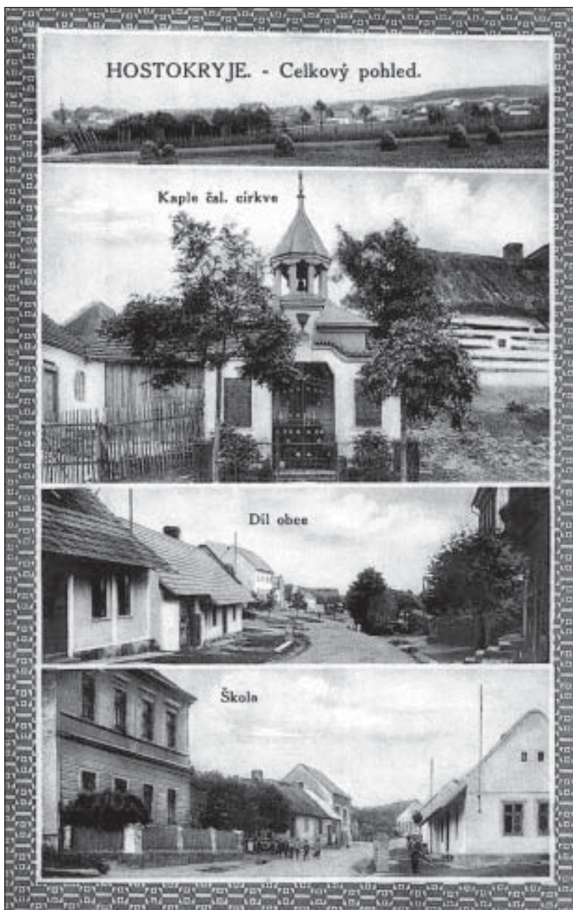
Pohlednice Hostokryj z období první republiky (Obecní úřad Hostokryje)