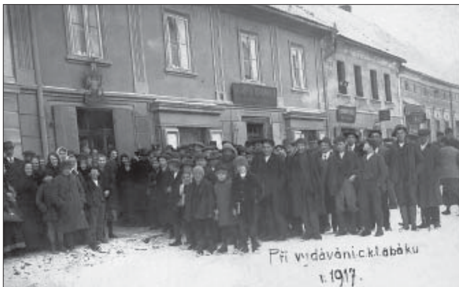
Čekání na vydávání tabáku před čp. 191 na náměstí – r. 1917 (MMNS, č. přír. 136/88d)