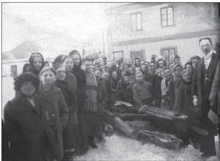
Rekvizice zvonu Ježíš před katolickým kostelem – únor 1917

Že zvony budou rekvírovány, se brzy proslýchlo. Halada zaznamenal 10. srpna 1916: „Je vyhlášeno, že budou odebíráti zvony, a sice prvně z farních kostelů, a sice třetinu.“ 110 ) Na konci září t. r. pak žádalo prezidium místodržitelství okresní hejmanství o předložení zprávy o zabavení zvonů, měděných střech a hromosvodů pro válečné účely. 111 ) Situace se