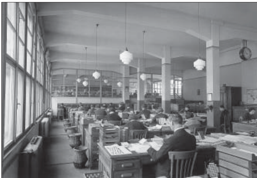
Kancelářské prostory v administrativní budově v r. 1935