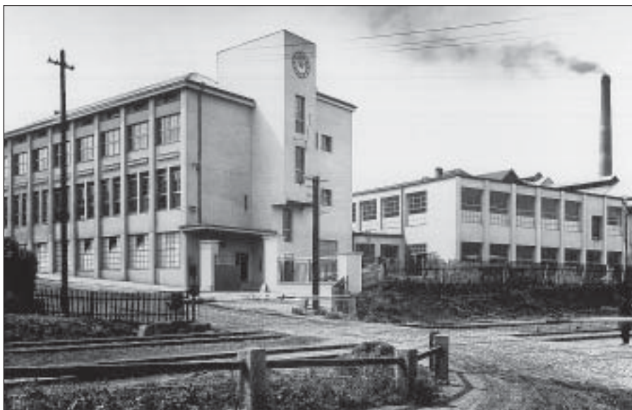
Novostavby z r. 1930 – administrativní budova s částí provozoven

straně dávaly ženy do stroje nezabalené kousky mýdla a na druhé vylézaly bezvadně zabalené kostky buď v kartonových krabičkách, nebo v bílých papírových obalech s natištěnou firmou a červeným rakem. Zabalené mýdlo se ihned skládalo do beden různých velikostí a váhy podle toho, kolik ho bylo zapotřebí k expedici. Navrch pod každé víko se přibalily různé pohádky, betlémy, obrázky či jiné reklamní poutače. Po naplnění dělník víko přibíl a zabezpečil jej dvěma ráfky. Další zaměstnanec odvážel takto připravené výrobky k expedici do prostoru, kde se každý den shromáždilo až přes dva tisíce beden k odeslání.