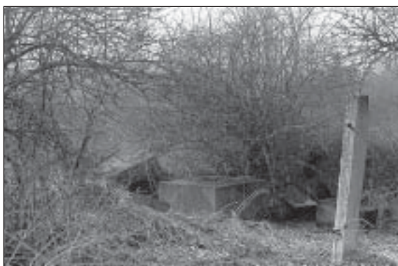
Podstavec památníku v Rakovníku – Huřvinách v roce 1978

pěkná ostuda. Fáma praví, že ji vojáci odtáhli do kasáren a zabetonovali pod tankovým rejdištěm.“ 72)