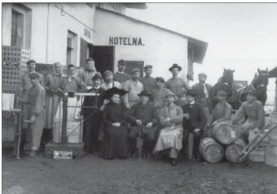
Třicáté výročí založení firmy – r. 1905 (SOka Rakovník)

„Na novém místě šla nám práce daleko lépe od ruky. Nebylo tam zle o kousek místa a mohli jsme si výrobu lépe uspořádat. Starostí ovšem bylo stále dost a dost. Nebyl jsem ještě dlouho v nové dílně, když si přišel za mnou soused stěžovat, že na jeho poli zrovna vedle naší dílny všechno obilí zežloutlo sodovými parami, unikajícimi z našeho závodu. Věděl jsem, že je v právu, a hleděl jsem po dobrém nějak věc s ním urovnat. Nabízel mi, abych jeho pole najal – ale já se rozhodl raději je koupit. A dobře jsem udělala! – To pole se mi krásně hodilo, protože zanedlouho jsem musil dále závod rozšiřovat. – Skoupil jsem brzy i ostatní pozemky okolo, protože závod rostl a rostl a musel jsem pamatovat na to, kam budu přistavovat později.“ 30)