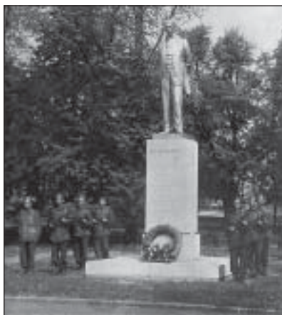
Masarykův monument po druhém odhalení v roce 1946