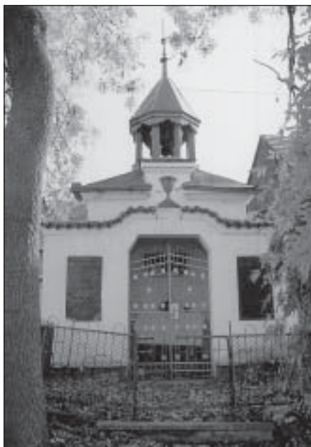
Současný stav hostokryjské kaple. Pohled ze severovýchodu a severu