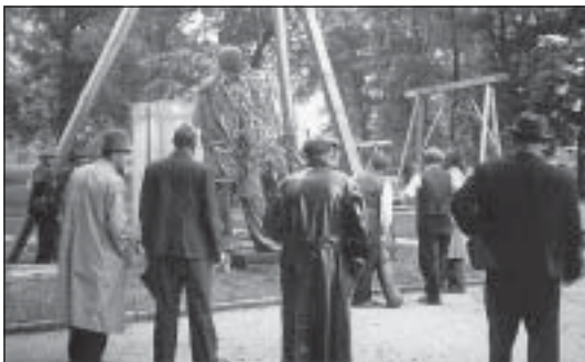
První odstranění sochy 25. června 1940

Spolu s tímto listem však již přišel na zdejší magistrát prostřednictvím rakovnického okresního úřadu přípis ministerstva vnitra, který ukládal odstranění symbolů bývalých státoprávních poměrů. Výnos Prezidia ministerstva vnitra 18. července 1940 ještě doplnilo nařízení tohoto znění: „ Dodatkem ke zdejšímu výnosu ze dne 16. června 1940 [...] se sděluje, že jest co nejrychleji z veřejností odstraniti veškeré pomníky, obrazy, pamětní desky a všechny jiné upomínky na T. G. Masaryka. Pod veřejností rozuměti jest nejen ulice, náměstí a sady, ale také všechny občanstvu přístupné prostory, úřadovny (služebny), školy apod. Při pomníku samém nerozho-