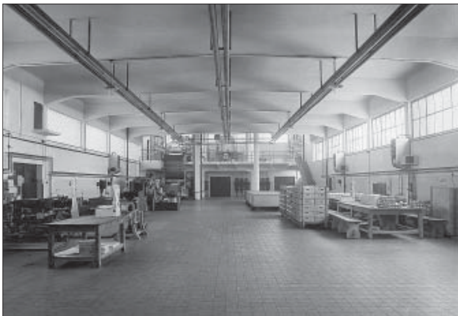
Výrobní hala margarínky v r. 1935