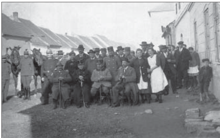
Odvod koní v Palackého ulici před čp. 40 – duben 1918 (MMNS, č. přír. 57/89)