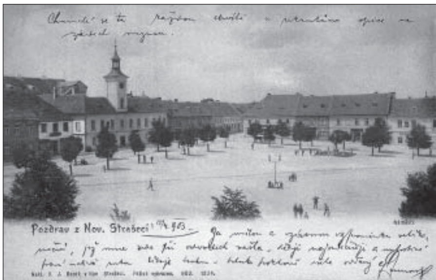
Nové Strašecí na počátku 20. století (MMNS, sbírka pohlednic)

událostech, o zabitých, raněných či zajatých vojácích. Omezilo se cestování a deformoval kulturní život. Tíživě dopadla válka na školství, na denním pořádku byla vynucovaná dobročinnost, do které byly školy zapojeny. Už vyhlášení války, které přišlo v době žní, a mobilizace mužů a koní měly dopad na sklizeň roku 1914. Po přechodu na válečné hospodářství se zintenzivnila účelová výroba, průmysl se podřizoval potřebám války. V Předlitavsku se zavádělo centrální hospodářské plánování, došlo k řízení průmyslové a zemědělské výroby a k dirigování procesu spotřeby. Po celé zemi postupně vznikaly vojenské lazarety a zajatecké tábory. 17)