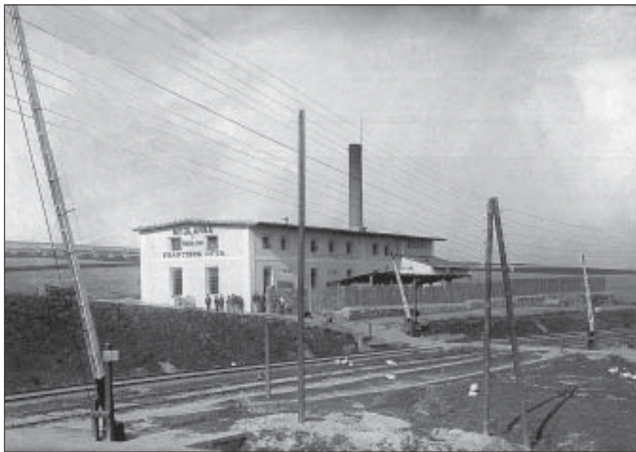
Ottova dílna postavená po r. 1900

V roce 1900 se tedy František Otta rozhodl zřídit vlastní dílnu. Ta byla prostorná, a proto nemusel šetřit místem. Před ní si dal postavit přístřešky pro uskladnění surovin a truhlářskou dílnu, ve které se vyráběly bedny. Také počet zaměstnanců se zvyšoval. V tomtéž roce zakoupil Otta, dle tržové smlouvy ze dne 1. srpna, dům na náměstí čp. 124/l od dědiců rodiny Skopovy, kam se s rodinou přestěhoval z domu čp. 117/l, v němž bydlel od svého příchodu do Rakovníka. 29)