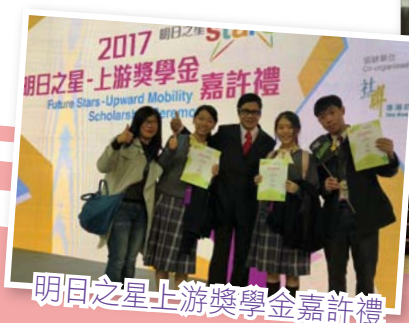
明日之星上游獎學金嘉許禮