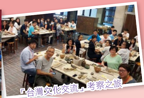
「台灣文化交流」考察之旅