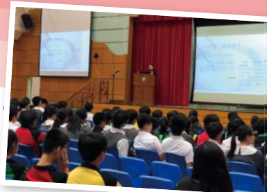
「不尋常食物 食物不尋常——文學中的食物書寫」講座