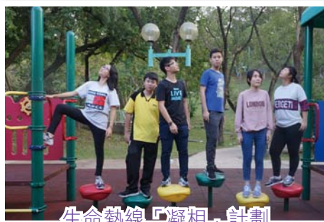
生命熱線「凝相」計劃