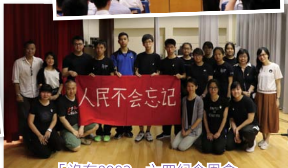
「沒有8903」六四紀念周會