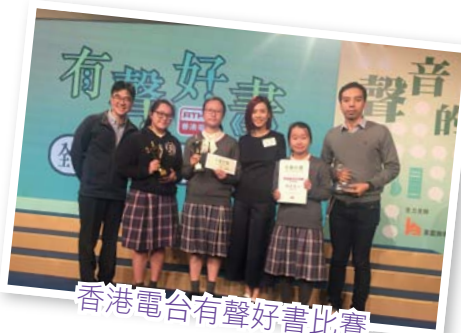
香港電台有聲好書比賽