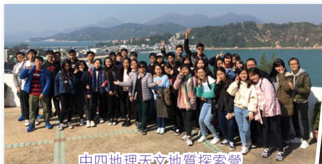
中四地理天文地質探索營