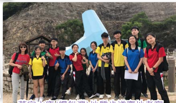
萬宜水庫(糧船灣)地質步道實地考察