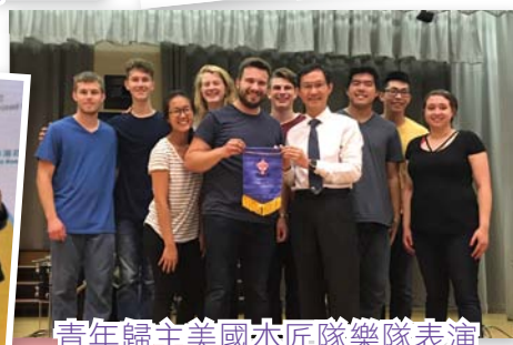
青年歸主美國木匠隊樂隊表演