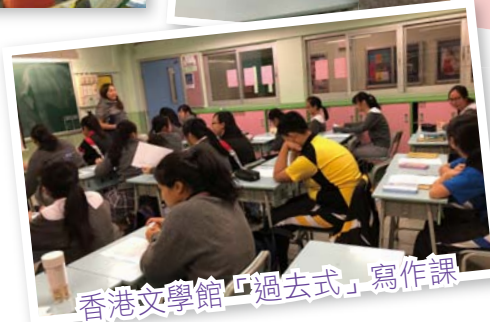
香港文學館「過去式」寫作課