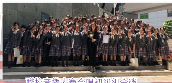
聯校音樂大賽合唱初級組金獎