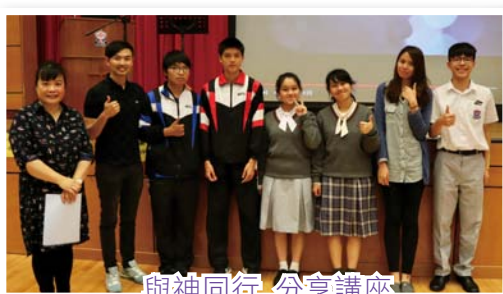
與神同行_分享講座