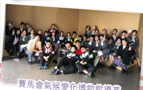
賽馬會氣候變化博物館導賞