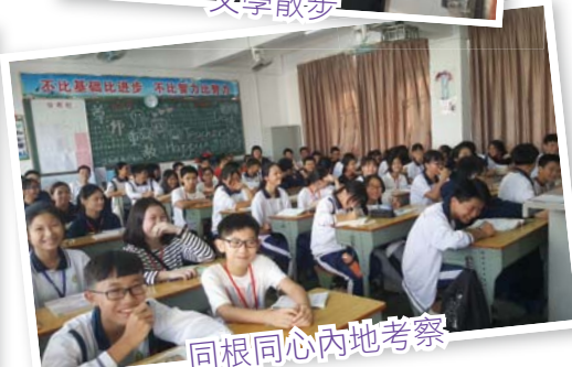
同根同心內地考察