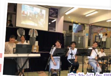
宗教組午間音樂會