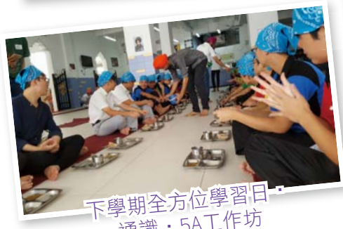
下學期全方位學習日 通識·5A工作坊