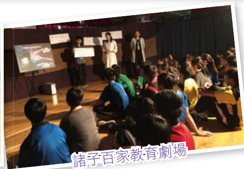
諸子百家教育劇場