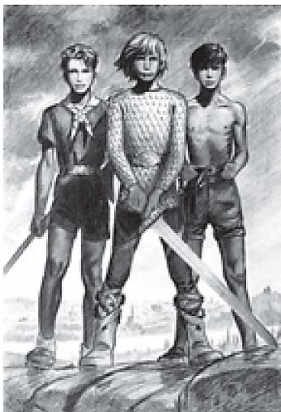
Защита ценностей, Запад.

Рисунок французского художника Пьера Жубера (1910-2002)