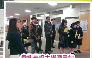
參觀長崎大學圖書館