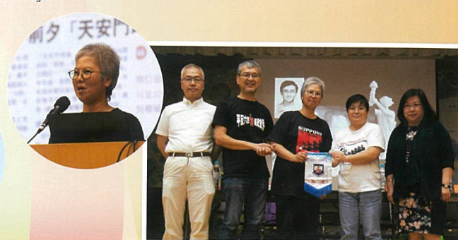
天安門母親運動義工來校介紹