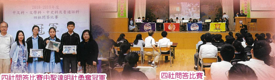
四社問答比賽由聖達明社勇奪冠軍

如同學參與兩個攤位遊戲並於遊戲券蓋上兩個印章，可即場兌換中國傳統民間小食(包括糖蔥餅、糯米糍、龍鬚糖及白糖糕等)。同學反應非常熱烈，積極參與各項活動，禮堂各個攤位皆擠滿參與的同學。