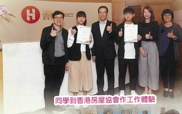
同學到香港房屋協會作工作體驗