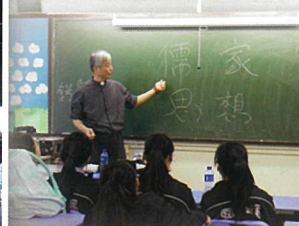
天主教同學會活動