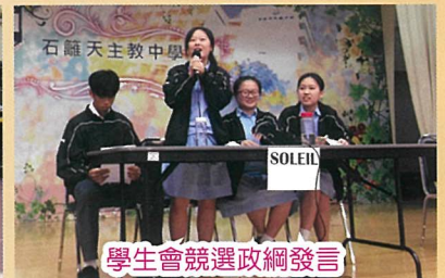
學生會競選政綱發言