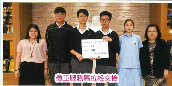
義工服務馬拉松交接