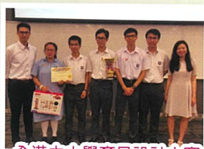
全港中小學產品設計大賽