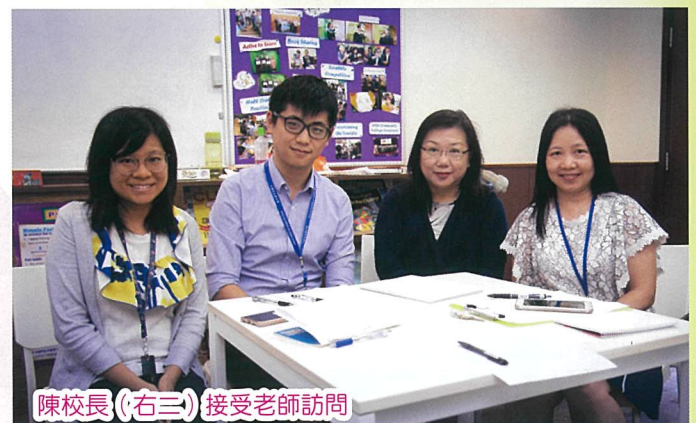
陳校長(右三)接受老師訪問

答：我覺得石天的學生有無限的發展空間，希望同學能善用時間，發揮所長。除了努力學習外，也可多元發展，在生活上取得平衡。在學校裡，同學是樂於學習的好學生；在家庭裡，但願同學是承擔家庭責任的好兒女。