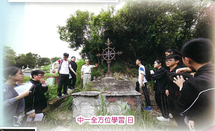
中一全方位學習日