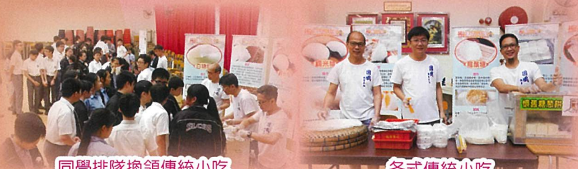
同學排隊換領傳統小吃

2019年5月14日至5月21日為文化週。文化週由中國語文科、中國文學科、普通話科及中國歷史科合辦。本年度主題為「飲食文化」，活動內容豐富，包括有早會閱讀指定篇章、「中國語文及文化常識知多少問答比賽」、星期五週會四社問答比賽及文化嘉年華攤位遊戲。