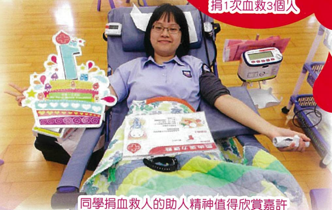
同學捐血救人的助人精神值得欣賞嘉許