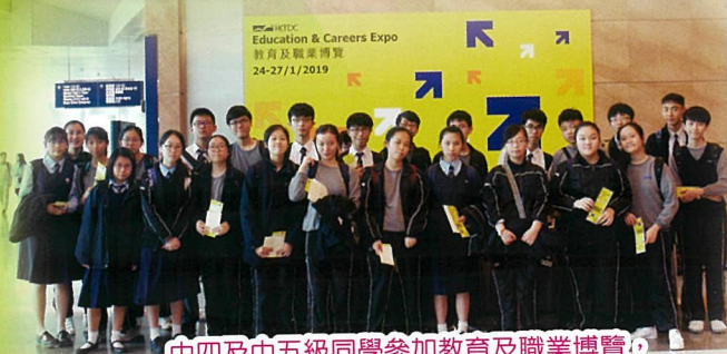
中四及中五級同學參加教育及職業博覽，及早認清目標