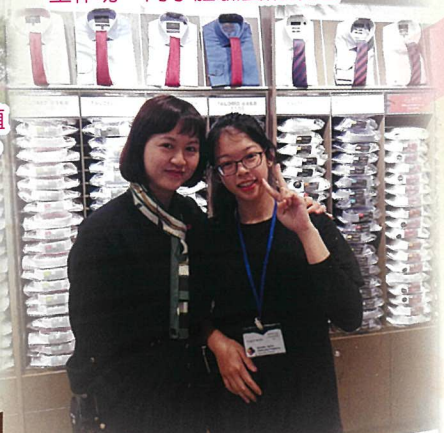
馬莎有限公司工作體驗計劃