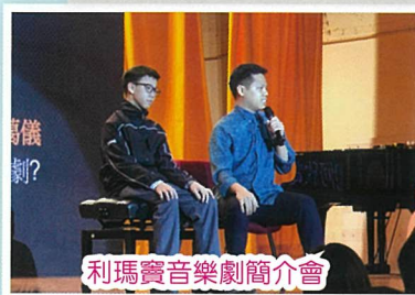
利瑪竇音樂劇簡介會