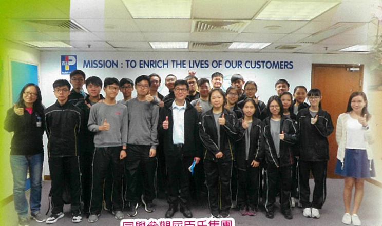
同學參觀屈臣氏集團

本年度的生涯規劃活動十分精彩。同學參加了不同的工作坊及參觀活動，從中認識自我，拓闊視野。同學更獲得不少寶貴的機會到不同的機構進行工作體驗，例如：香港房屋協會、社會福利署、香港貿易發展局、永利行測量師有限公司，實在獲益良多。以下是生涯規劃活動花絮：