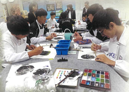
大華銀行舉辦「藝坊」水墨藝術工作坊，同學體驗藝術樂趣。