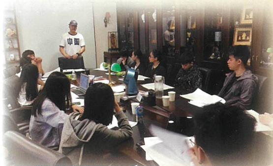
模擬法庭團隊聚精會神聆聽律師專業講解