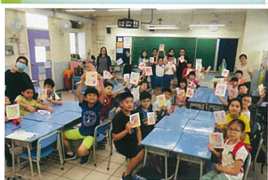
走出石天 - 堂區服務