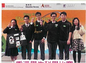
香港學生科學比賽

此外，有24位中五同學參加了香港理工大學主辦的「高中數理比賽2019」，同學需提早預備文憑試的考核範圍，作為公開考試前的預試。而初中亦有61名中二及中三的同學參加了由香港數理教育學會舉辦的科學評核測驗，以測試同學的科學共通能力。