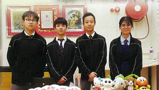
Working Reality - 同學一嘗營商滋味