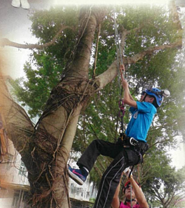
參加浸會大學樹藝及園藝業校園植物先鋒活動，攀樹的體驗真難忘。