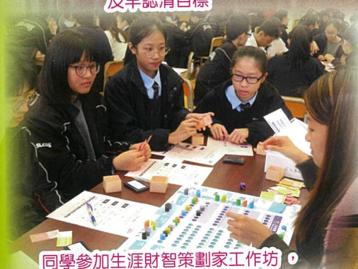
同學參加生涯財智策劃家工作坊，桌上遊戲真好玩