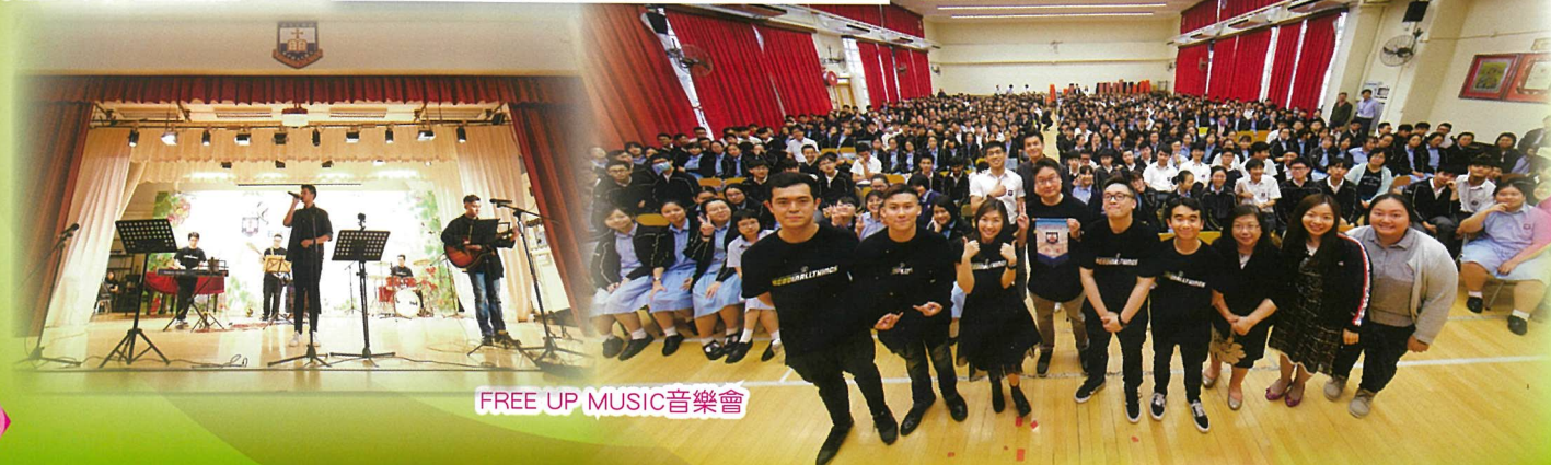
FREE UP MUSIC音樂會