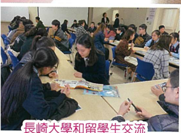
長崎大學和留學生交流