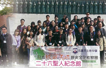
日本福岡長崎歷史文化考察團 二十六聖人紀念館