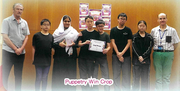
Puppetry Win Crop