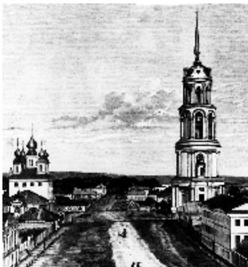
Вид на колокольню Воскресенского собора