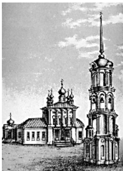
Литография Воскресенского собора из книги П. И. Гундобина

коих не для богослужбных целей воспрещается канонами Вселенской Церкви и карается Ею как святотатство □ миряне отлучением от Нее, священнослужители □ извержением из сана (Апостольское правило 73, Двухкратный Вселенский Собор. Правило 10) 126 .