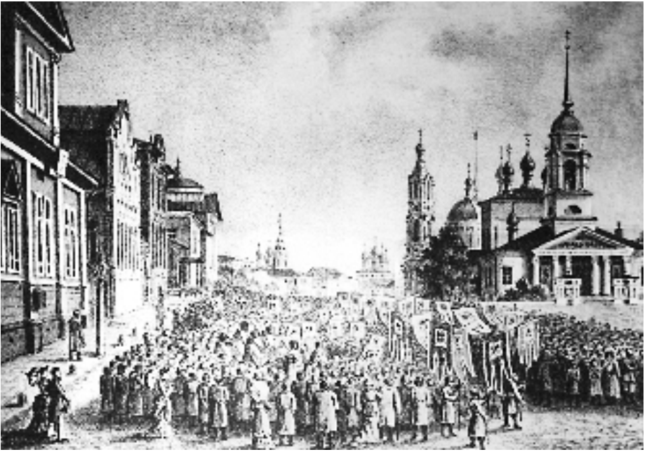
Литография с изображением Большого крестного хода в Шуе из книги прот. Е. И. Правдина

ющих... всех драгоценных предметов из золота, серебра и камней... 9 , в том числе всех освященных предметов.