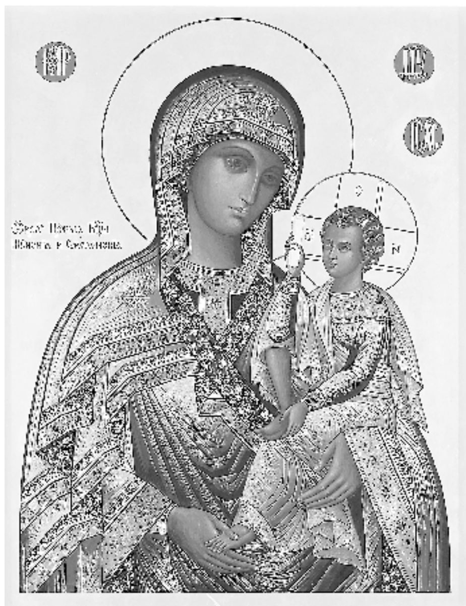
Шуйско-Смоленская икона Пресвятой Богородицы