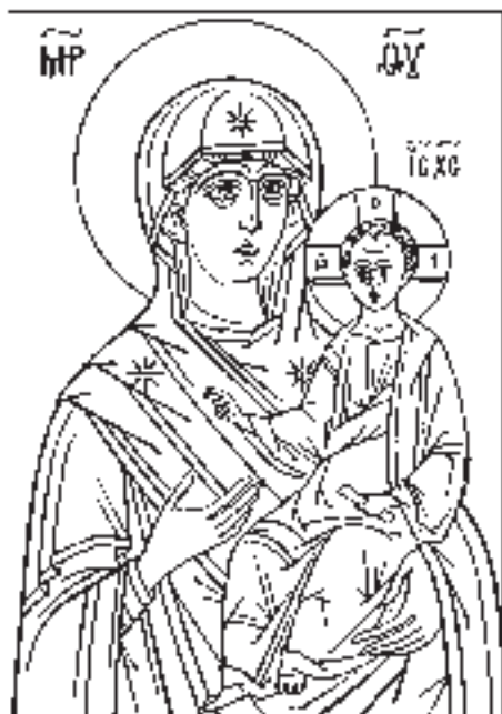
Икона Божией матери «Смоленская» (прорись)

последующих главах Откровения описывается последовательное снятие с Книги (свитка) семи печатей, знаменующее собою величественные и грозные события, совершающиеся в мире ангелов и людей.