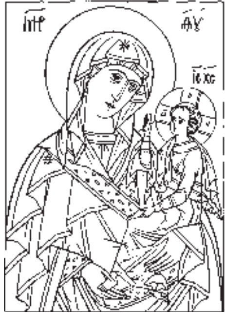
Шуйская икона (профись)

Значение образа пята поясняется и в стихах псалмов 40 и 55, связанных по смыслу с приведенными стихами из Книги Бытия. В этих псалмах царь и пророк Давид изливает пред Богом свою скорбь среди бедствий, которым он подвергается от своих врагов и врагов Божиих. Даже человек мирный со мною, на которого я полагался, который ел хлеб мой, поднял на меня пяту 77 , □ взывает праведный царь, уязвленный предательством Ахитофела