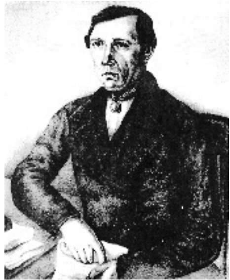
Историк Шуи В. А. Борисов (1809–1862)

надпись скорописью: іСия книга, именуемая чудо Пресвятой Богородицы Смоленския, принадлежит к павловской Соборной Спасо-Преображенской церкви, подписано тоя церкви причетником 1817 года декабря 20 дня 6 . Между двумя последними строчками надписи более бледными чернилами вписано: іПавлом Готовым и Калмыковым 6 . На следующем, последнем в книге листе небрежной скорописью выполнена другая надпись □ ісела Павлова Спасо-Преображенской церкви 6 .