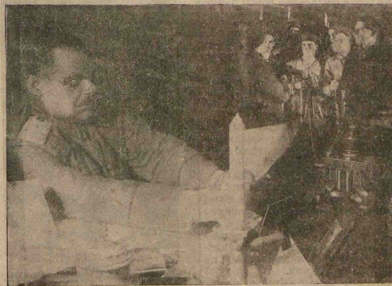
„О ЧЕМ ГОВОРИТ ЛИСТ БУМАГИ“.