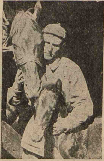
Из хроники «Красная Звезда». Демобилизованный красноармеец прощается со своими друзьями.