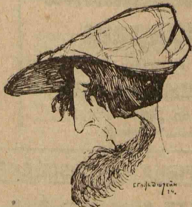
Режиссер А. Роом.