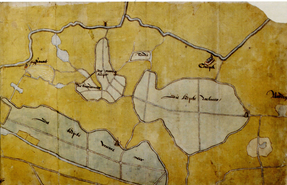
(met aan de zuidkant Costverloren) en Marewaardmeer, Oudie en Daalmeer. Nationaal Archief, Den Haag, VTH verzameling binnenlandse kaarten Hingman 15 e -19 e eeuw, (toegang 4.VTH) inv.nr. 2514

1566 noemden, was volgens hem het resultaat van verwarring met het Heilooërmeer, waarvoor inderdaad in 1566 een octrooi werd verleend. Dit water grensde aan de Achtermeer. Bovendien kwamen de ingelanden van de twee polders in 1579-1580 overeen dat de Heilooërmeer voortaan door de molen van de Achtermeer zou worden bemalen. 7