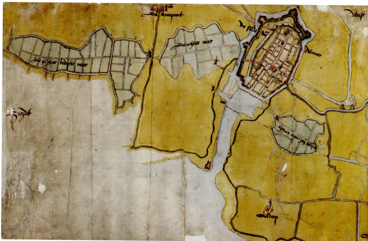
Alkmaar en omstreken in kaart gebracht door Louis Pietersz., 1573 (noorden rechts). De droogmakerijtjes rond de stad zijn duidelijk herkenbaar, v.l.n.r. de Heilooërmeer, de Achtermeer, het Zwijnsmeertje, de Vronermeer

1876, wees hij op de Achtermeer, maar noemde twee jaartallen: “eerst in 1532, later omstreeks 1566”. 3 De Vries was dus inmiddels op de hoogte van het octrooi uit 1532. Maar dat gegeven conflicteerde met uitspraken van diverse kroniekschrijvers als C. van der Woude in diens Kronyck van Alckmaar uit 1645. Hierin is een lijstje van landaanwinningen opgenomen en Van der Woude meldt bij de Achtermeer “bedyckt ontrent 1566”. 4 De Vries loste dit op door beide jaartallen te noemen.