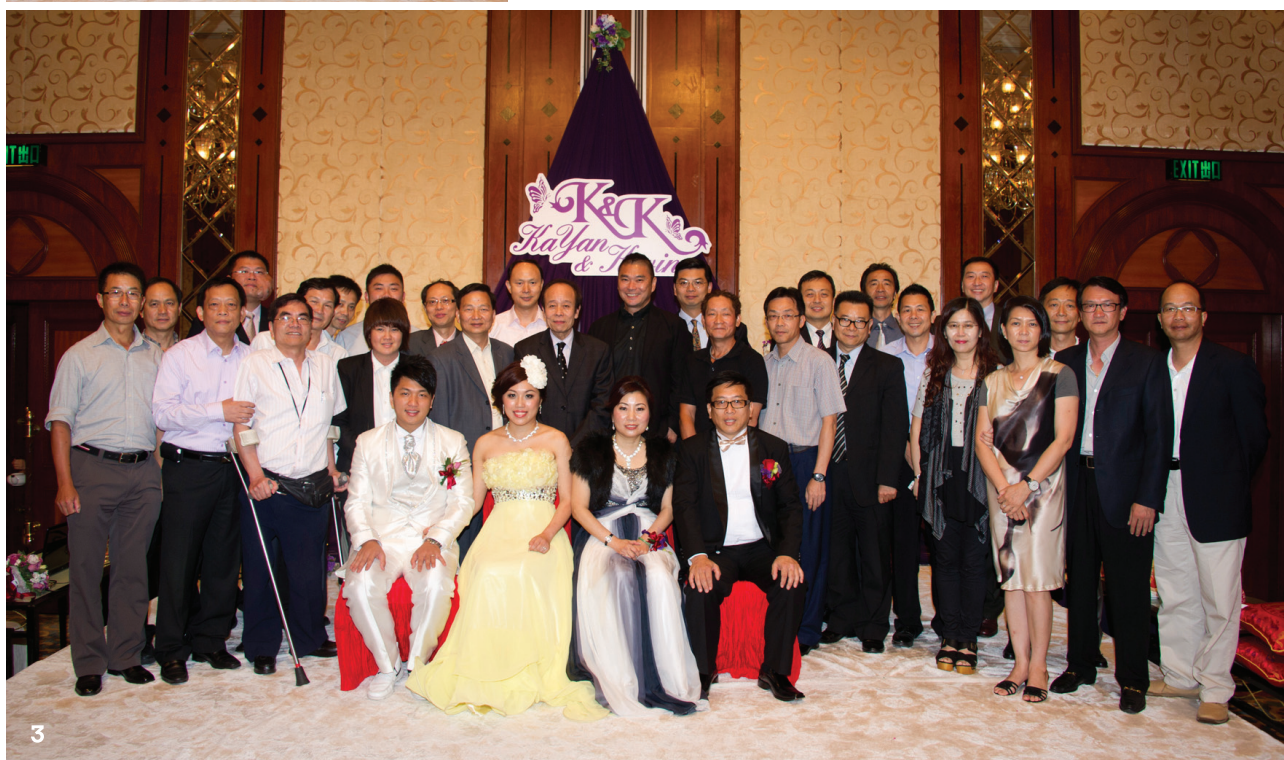
圖3 當然少不了會長的一班同學—何中的校友，當中可有你熟悉的面孔？