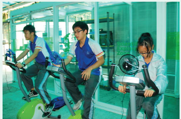
圖1 午休時間，學生正在以環保健身單車鍛鍊體魄。

猶記得去年母校的科學環保保育徑正式啟動，為母校的科學教育發展揭開了新一頁。今年，母校科學科再增設了環保健身單車及廚餘機，實踐環保校園的概念，讓學生躬行環保，配合「探知館」內外的模型及展板，寓學習於校園生活之中。學生可藉踏單車一面鍛鍊體能，一面體驗如何以動能發電。同時，校方會收集學生午膳的廚餘，讓學生再作加工處理，作為綠化校園的肥料。葉校長坦言，必須感謝校友會成立的「培育創意科學家基金」，母校的學弟學妹才得以享用各種先進新穎的科學教學設備，希望各位校友們繼續支持，令學生與學校在科學教育方面得以「持續發展」，延續這種創意科學的精神。