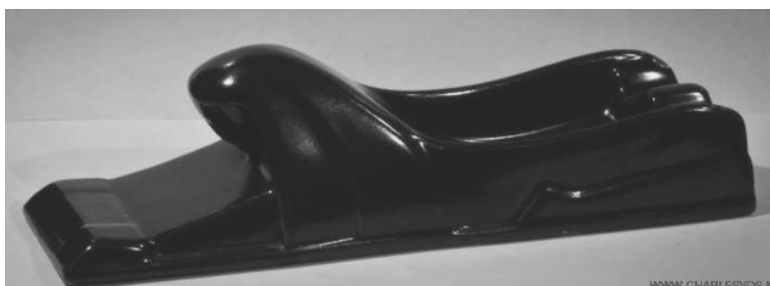
Sphinx by Charles Vos