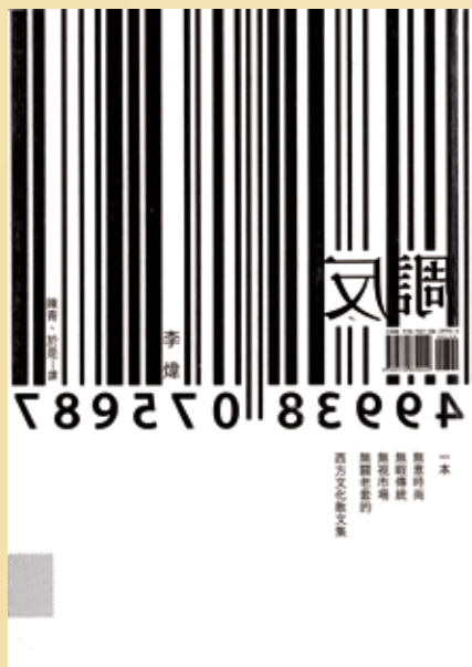
《反調》李煒著 陳青、於是譯 台北聯經出版社二零一二年出版