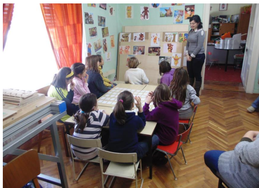
Híres Macik sétánya