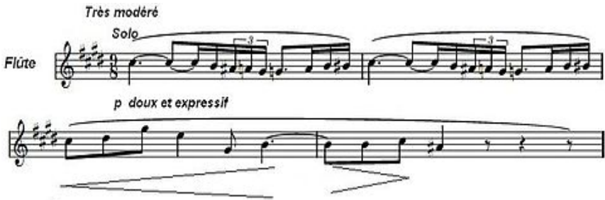
Thème du début du Prélude à l'après-midi d'un faune

En 1890, fut composée sa Suite bergamasque pour piano (inspirée par Verlaine et Fauré), en 1893, son quatuor à cordes et enfin, en 1894, il rencontra un énorme succès dans toute l'Europe avec Le Prélude à l'après-midi d'un faune pour orchestre (sur un poème de Mallarmé) et par la suite, avec l'opéra Pélléas et Mélisande d'après le livret de Maeterlinck. Puis naquirent des chefs d'œuvres comme Les trois chansons de Bilitis (1897-1898), Les Nocturnes (1897-1899), Estampes (1903), Masques et l'Isle joyeuse (1904), le poème symphonique La Mer (1905), Children's Corner (1906-1908) dédiée à sa fille. Beaucoup d'autres œuvres ont encore été écrites et créées.