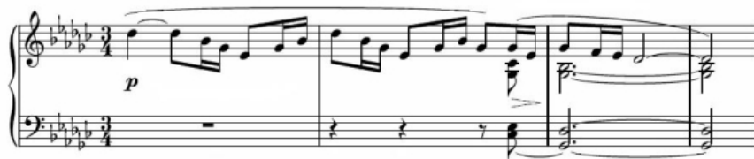
Début de la Fille aux cheveux de lin