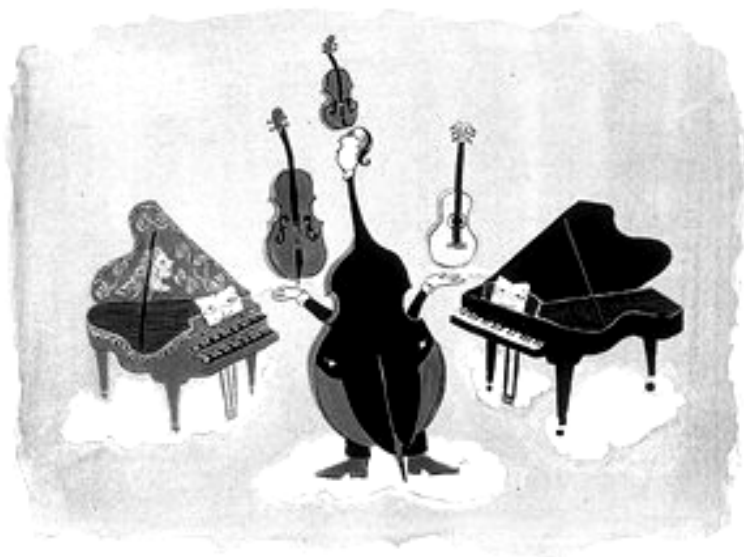
Jean Françaix et la Musique de Chambre