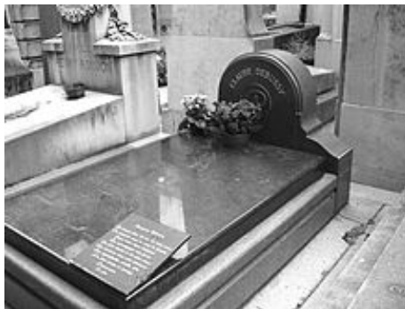
Tombe de Claude Debussy, au Cimetière de Passy (Paris)

Entre 1914 et 1917, il composa des sonates pour différents instruments, les Douze Etudes pour piano et beaucoup d'autres pièces. En 1910, sa santé se détériora rapidement suite à la découverte d'un cancer et il mourut en 1918.