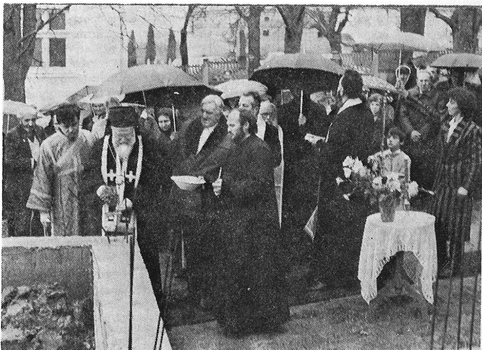
Освећење темеља новог парохијског дома у Цветојевцу

Српски осмогласник је конструисан из различитих напева. Тако први глас има 2, други 3, трећи 2, четврти 3, пети 2, шести 3, седми 1 и осми 4 напева. Српски осмогласник је, дакле удешен на напевима који се зову гласови. Један или више напева чине глас. Глас је, дакле, збир напева. Напев гласа је група од неколико мелодијских одсека — формула, најмање три а највише шест. У неким гласовима мелодијских одсеци имају мала одступања, варирања и проширења.