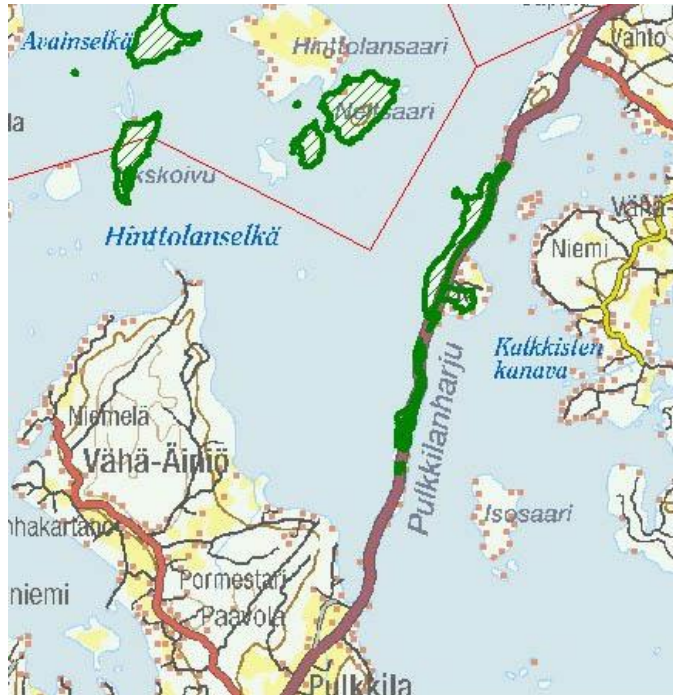
Kuva 2-4. Ote Päijänteen kansallispuiston rajauskartasta.