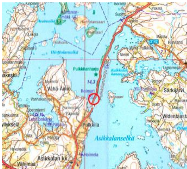
Kuva 1-1. Suunnittelualueen likimäärinen sijainti.

Suunnittelualue sijaitsee Pulkkilanharjulla Vähäsalmen rannalla.