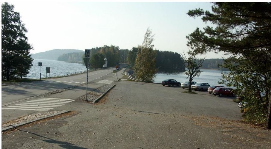
Kuva 2-7. Pulkkilantie Reimarin pihasta etelään, Vähäsaaren suuntaan nähtynä.

Pulkkilantien keskimääräinen vuorokausiliikenne (KVL) vuonna 2017 oli 1 272 ajoneuvoa vuorokaudessa. Tästä raskaan liikenteen osuus oli 86 ajoneuvoa. (Liikennevirasto)