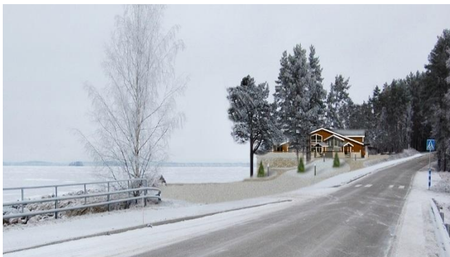
Kuva 5-3. Kuvasovite suunnitellusta Reimarin uudesta rakennuksesta etelästä Pulkkilantieltä nähtynä.