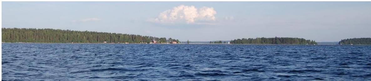
Kuva 2-6. Näkymä Hinttolanselältä kuvattuna kohti Reimaria. (Juha Eskola)