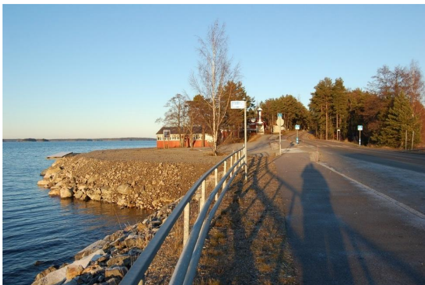
Kuva 2-5. Reimarin alue Vähäsaaren suunnasta nähtynä joulukuussa 2009.

Rakennusten eteläpuolella on suurehko pysäköintialue. Alueen puustoa on kaadettu rannan täyttäjien ja muun maaston muokkauksen yhteydessä.