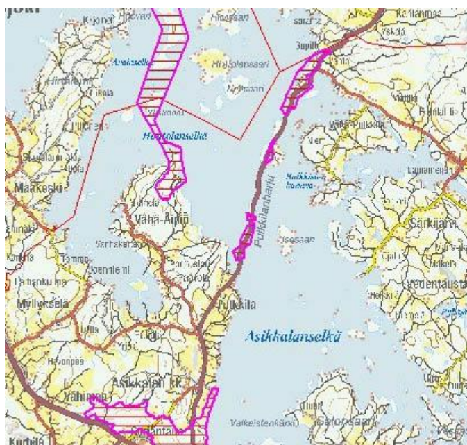
Kuva 2-3. Harjijensuojeluohjelma-alueen rajaus.

Suunnittelualue kuuluu valtakunnallisen harjijensuojeluohjelman alueeseen (valtioneuvoston päätös 3.5.1984). Harjijensuojeluohjelman ensisijaisena tavoitteena on säilyttää alueiden luonteenomaiset geologiset, biologiset, luonnonmaantieteelliset ja maisemalliset piirteet. Alueen käytön rajoitukset perustuvat maa-ainelakiin ja -asetukseen.