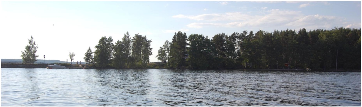
Kuva 5-2. Näkymä Pulkkilansalmelta kuvattuna kohti Reimaria.

Rantavyöhykkeelle sekä pysäköintialueen ja tiealueen väliin on pihasuunnitelmassa (liite 3) osoitettu istutettavaksi lehti- ja havupuita.