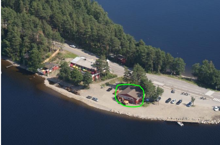
Kuva 5-1. Kartassa vihreällä ympyröity tanssilavarakennus on kaavassa esitetty purettavaksi ja alue varattu parkkialueeksi. Reimarin alue elokuussa 2009.

Rantavyöhykkeelle sekä pysäköintialueen ja tiealueen väliin on pihasuunnitelmassa (liite 3) osoitettu istutettavaksi lehti- ja havupuita.