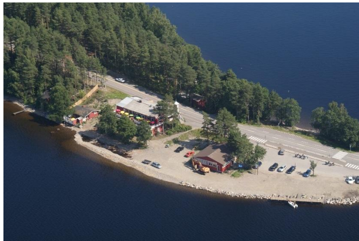
Kuva 2-1. Reimarin alue elokuussa 2009.

Suunnittelualueella on ravintola-, kesäkauppa- ja rantasaunarakennukset sekä pysäköintipaikkoja ja venelaituri. Alueella on jonkin verran puustoa. Rantaan on tehty vuosina 2008-2009 Itä-Suomen ympäristölupaviraston myöntämän luvan mukaiset täytöt. Samalla osa puustosta on kaadettu.