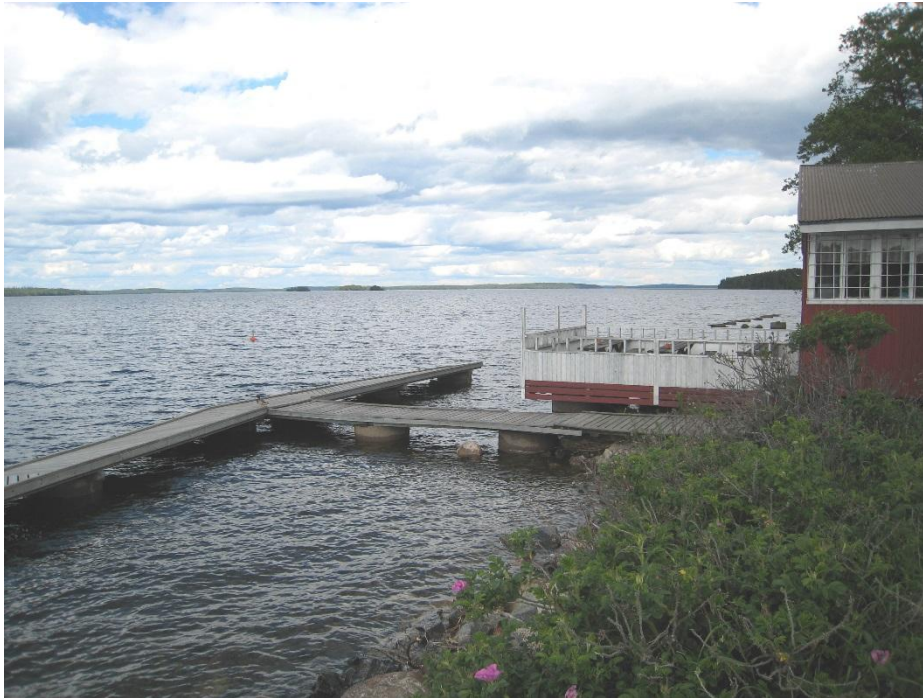
Kuva 2-2. Näkymä Reimarin venerannasta järvenselälle.