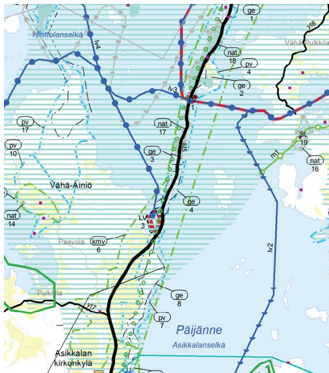
Kuva 2-9. Ote Päijät-Hämeen maakuntakaavasta.

Maakuntakaavassa ei ole osoitettu Reimarin alueelle käyttötarkoituksimerkintää. Maantie 134 on seututie. Pulkkilanharju on tärkeää pohjavedenhankintaan soveltuvaa pohjavesialuetta (pv4) ja arvokas harjualue tai muu geologinen muodostuma (ge4). Pulkkilanharjun kautta kulkee ohjeellinen ulkoilureitti. Lisäksi Reimarin alue kuuluu kulttuurihistorian tai maiseman kannalta valtakunnallisesti merkittävään alueeseen (kmv6 eli Kurhila-Pulkkilan valtakunnallisesti arvokas maisema 1995). Koko alue on osa kulttuuriympäristön tai maiseman vaalimisen kannalta tärkeää aluetta (ma). Alue on uusi valtakunnallisesti arvokkaan maisema-alueen ehdotus 2011.