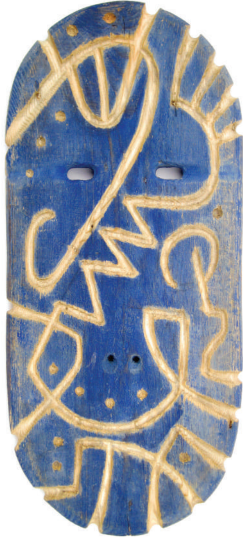
Blue Mask, carved colored pine tree, 52x 23 x 2.5 cm