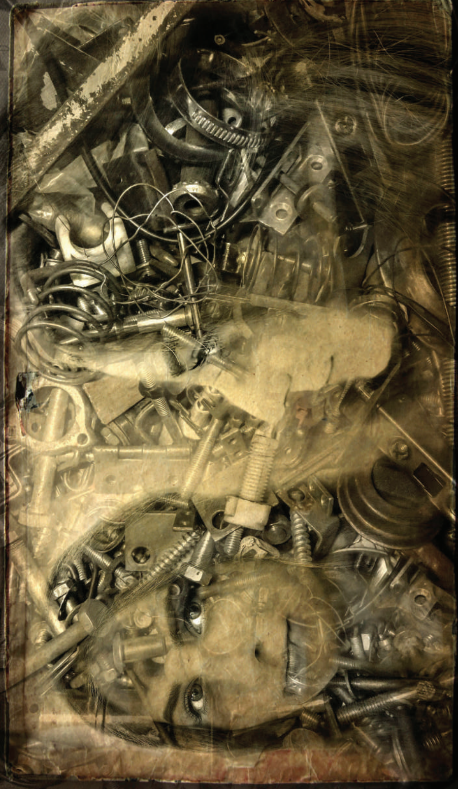
Somehow she asked me to make her portrait without going into details. 2018/2019 digital prints on black foam core, A2