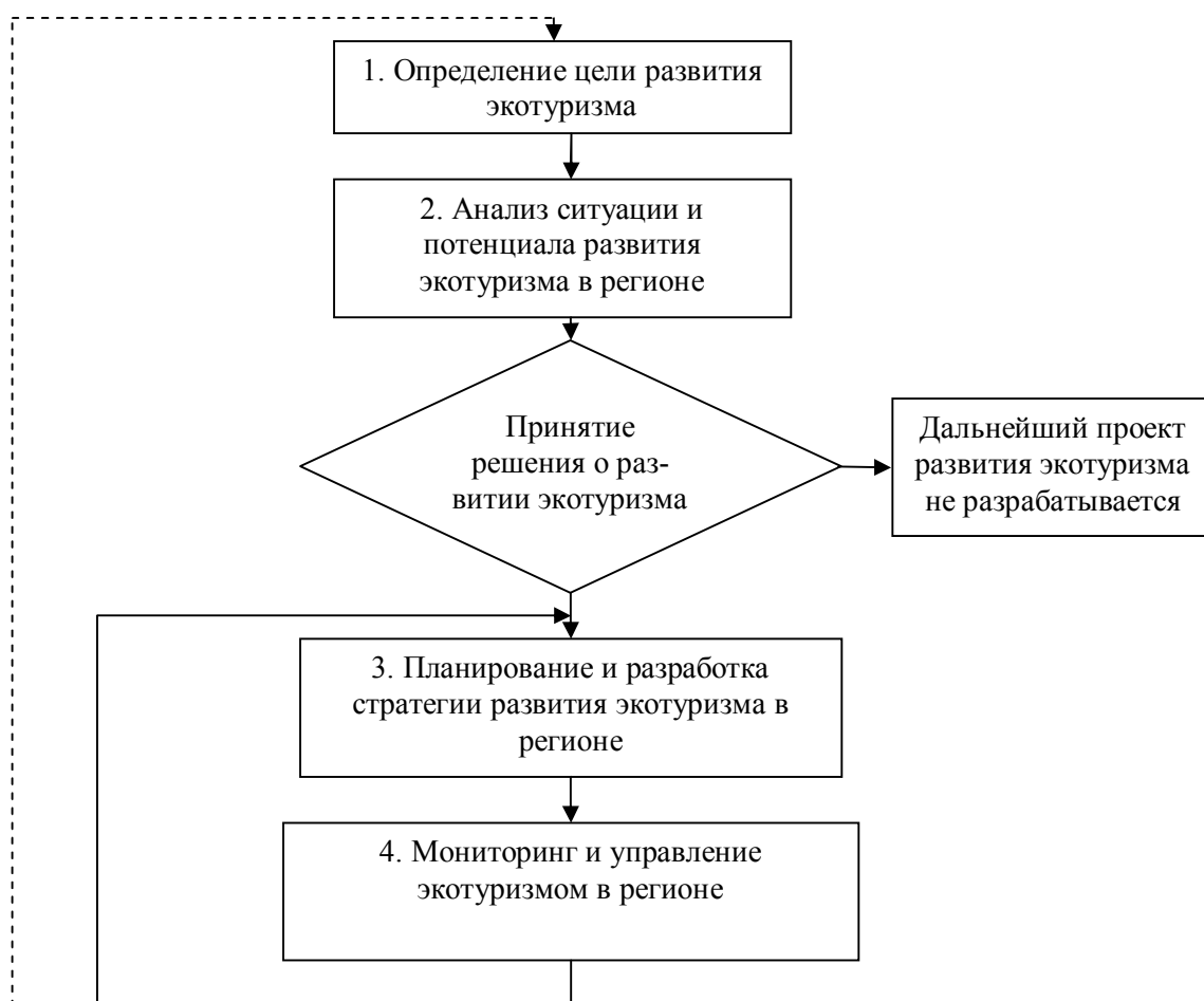
Рис. 3. Основные этапы формирования стратегии развития экологического туризма в регионе

мониторинга и контроля экологического и социального воздействия туристской деятельности, а также управления ими (их модификация и совершенствование в случае необходимости).