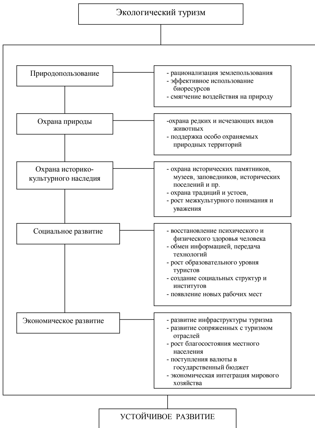
Рис.1. Каналы связи экотуризма и устойчивого развития региона

В настоящее время развитие экологического туризма, как и общества в целом, невозможно вне концепции устойчивого развития. Используя принципы концепции устойчивого развития, экологический туризм сможет преодолеть не только имеющиеся сложности, но и вывести другие отрасли, функционирующие на данной территории, на путь устойчивого развития (рис.1).