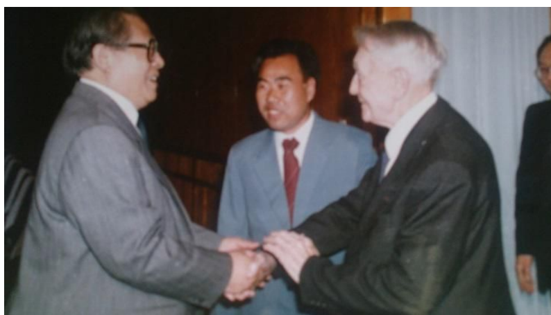
上图为江泽民同志在中南海接见弗朗克

我1991年去驻外使馆工作。因此，弗朗克1992年访华时，我未能再次陪同这位老朋友。这位老朋友已驾鹤西归多年，但是我和他相处的情景依然历历在目。一想起来，他当年的形象立刻浮现在我眼前。