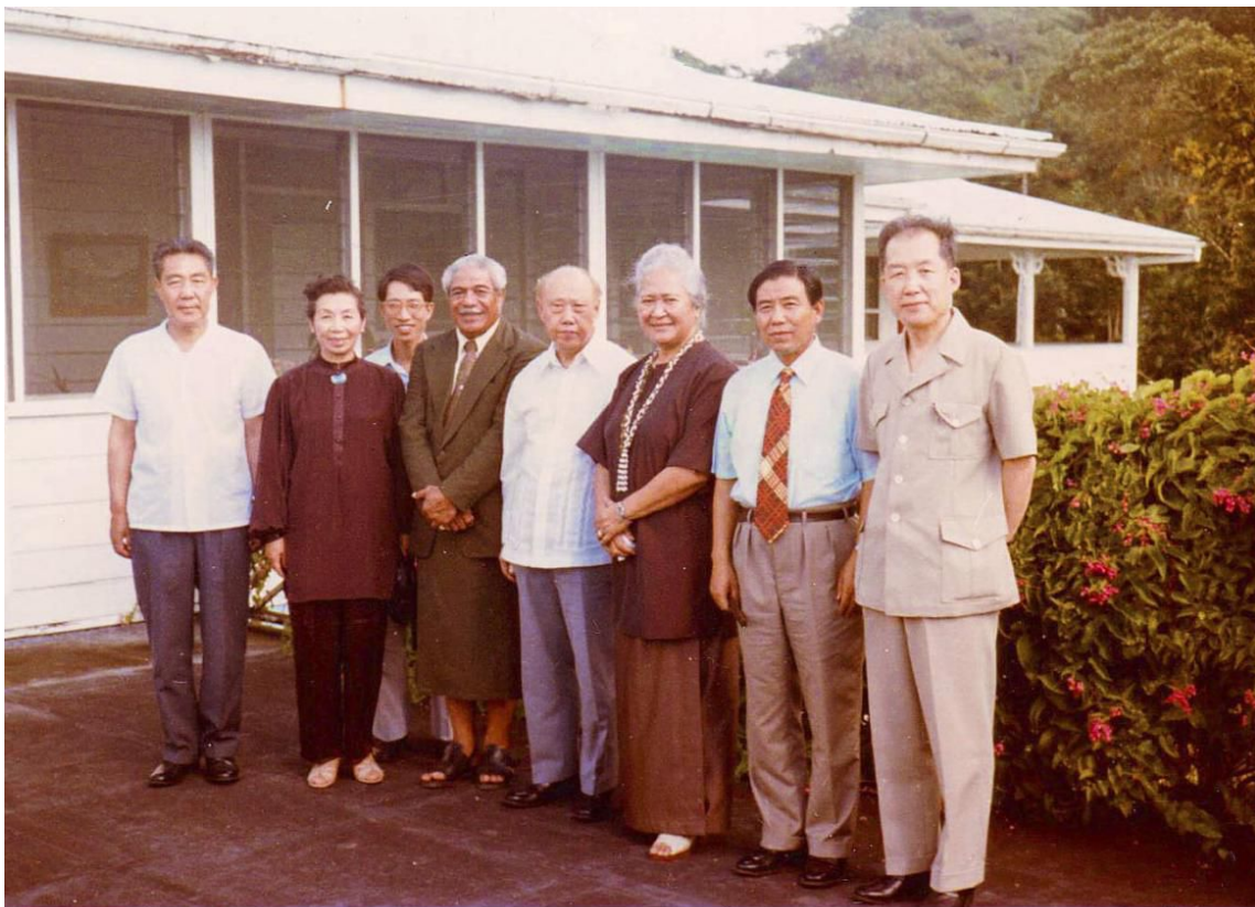
1981年5月王炳南会长率团访问新西兰（右起第四人为王炳南，右起第一人为作者）

炳南同志 1908 年生于陕西省乾县。1988 年在北京逝世，享年 80 岁。他曾在遗嘱中说过：“我死后，有人说声炳南是个好人，我就心满意足了。”认识他的人都会异口同声地称赞他确实是位好同志。