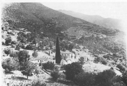
6. Μονή Καριών, γενική άποψη. (Αρχειο Γεωργ. Σιτηρίου).