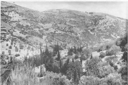
7. Μονή Καταρράκτου, γενική άποψη. (Αρχείο Γεωργ. Σιτηρίου).