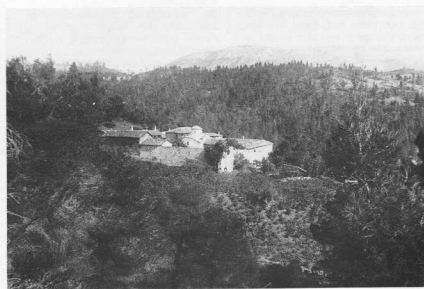
9. Μονή Οσίου Δαβίδ ή Γέροντος, γενική άποψη στις αρχές του αιώνα.