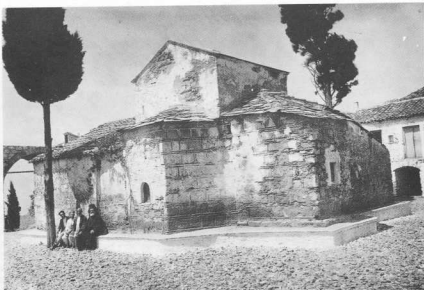
3. Μονή Λευκίων, άποψη του Καθολικού (από ΒΑ).