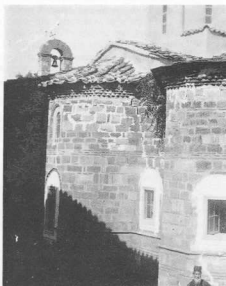
5. Μονή Γαλατάκη, άποψη του Καθολικού (από ΝΑ).