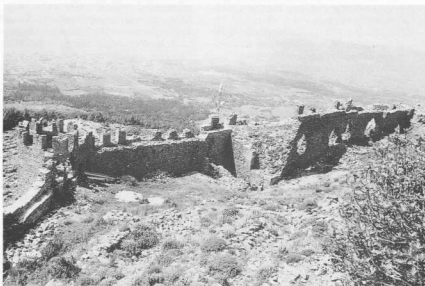
4. Καστέλλο - Ρόσσο Καρίστου, άποψη εσωτερικού του. Στους πρόποδες του η Παλαιόπολη, στο βάθος η Καρίστος.