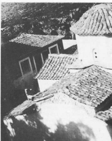
8. Μονή Σιφνός Κύμης, άποψη του Καθολικού.