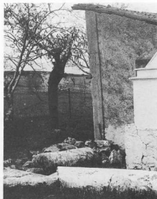
2. Βατώντας Νέας Αρτάκης, ερείπια παλιοχριστιανικού ναού.