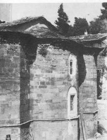
στις αρχές του αιώνα. (Αρχειο Γεωργ. Λαμπάκη).