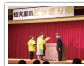
（知夫村どっさり祭）