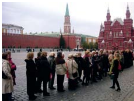
Röda Torget-SWEAuppställning för T-banan

Trafiken är enorm. Det verkar inte bara som att alla just fått bil, utan även som om de flesta just fått sitt körkort. Så se upp, ingen stannar bara för att du står vid markerad övergång. Tunnelbanan gick däremot mycket bra. Här vi gick fram som den bästa dagisklass, två och två i rad. Vad Ivan på gatan och de sjallettprydda damerna som tittade efter oss tyckte kan vi bara ana.