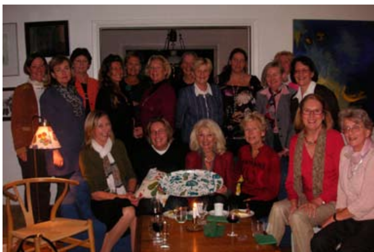
Nya StockholmsSweor på Hemvänderträff