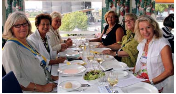
Lunch på Solliden