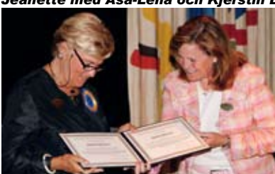
Årets Heders Åska