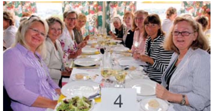
Sveor från när och fjärran