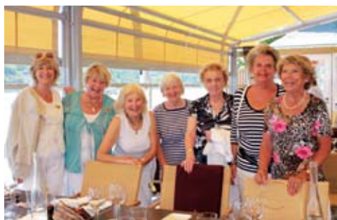
Förväntansfulla Sweor på Solliden