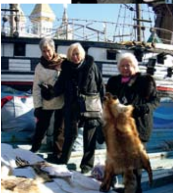
WiviAnne, Sofie o Ettan på skinnmarknad