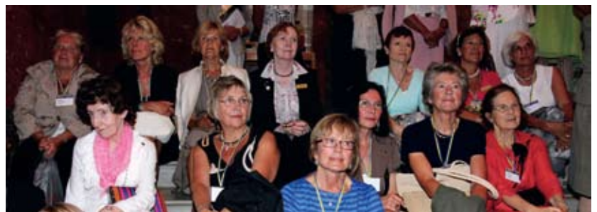
Andäktiga Sveor vid högtidsceremonin på Nationalmuseum Beridna Högvakten underhåller