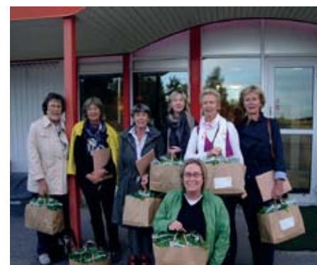
Sweor med Swegropåsar

Eva Thorson skrev och Cecilia Westling fotograferade