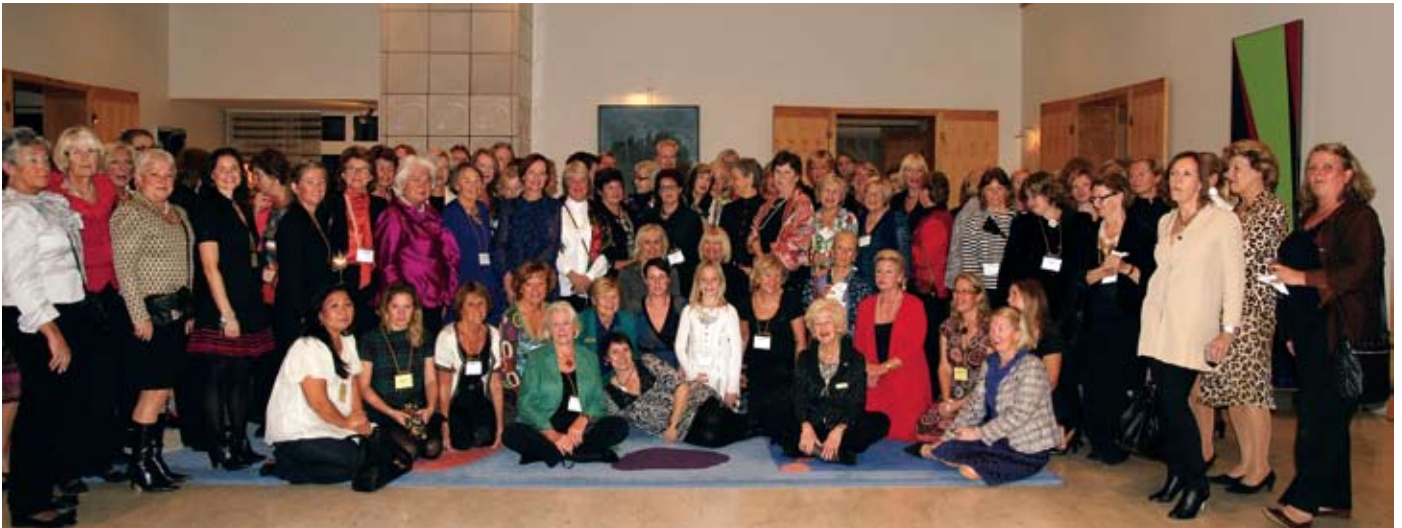
Regionmötesdeltagarna på Svenska Ambassadörens Residens