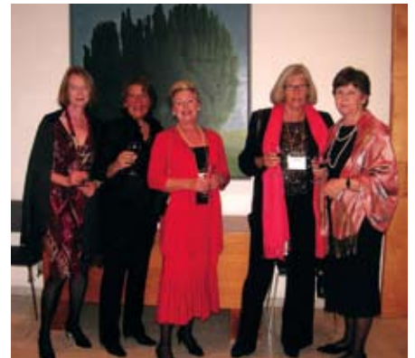
StockholmsSveor på Residenset