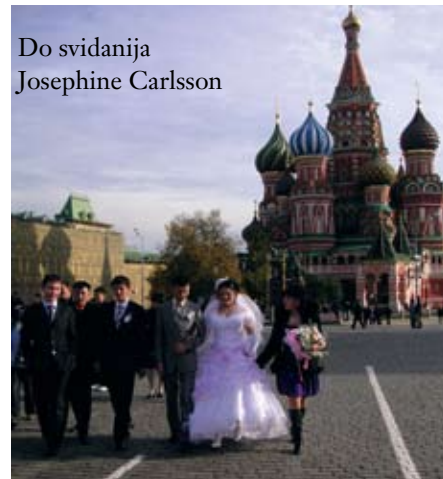
Bröllopsfölje framför Vasilijkatedralen

Det allra bästa, frånsett SWEA-känslan, var Bolshoiensembeln. Hissnande oförglömlig balett, dekor och kostymering att bara njuta av. Vill jag åka tillbaka? Definitivt. Jag vill se mer av Tretiakovgalleriets underbara konstskatter, jag vill njuta av utsikten från Swiss Hotel Space Bar, jag vill se Pusjkinmuseet och äta igen på Café Pusjkin, jag vill göra en båttur på Moskvafloden, jag vill försöka förstå lite mer.