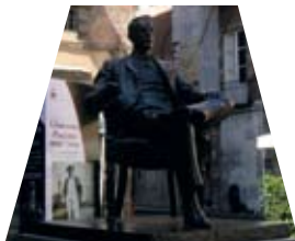
Puccini i Lucca

I Pisa tittade vi givetvis på det nyrenoverade lutande tornet, kyrkan och den gamla delen av staden. Det bästa med Pisa är närheten till den historiska staden Lucca. Staden, som är omgärdad av en 4 kilometer lång mur, har åtminstone funnits sedan romartiden. Historien berättar att Julius Caesar hade sitt vintertillhåll här och Garibaldi står staty mitt på det stora vackra torget. Ett besök i den annorlunda katedralen San Martino blir det förstas och sedan en god måltid på en av de många restaurangerna innan Puccinikonserten. Att Puccini föddes här präglar den lilla staden och man anordnar en Puccinifestival varje år.