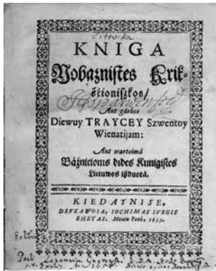
Knyga nobažnystės krikščioniškos. 1653.