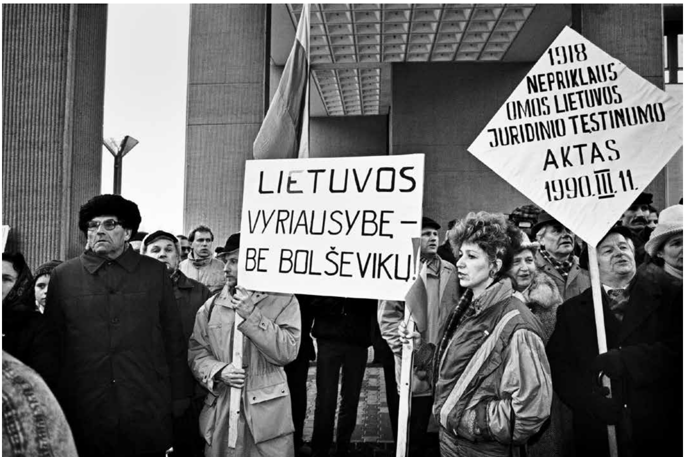
Prie Aukščiausiosios Tarybos rūmų belaukiant Lietuvos Nepriklausomybės paskelbimo. Vilnius, 1990 03 11

Vis dėlto šiuos samprotavimus norėtusi baigti optimistiška išvalga, kad per „dainuojančią revoliuciją“ taip ir likusi neįsteigta, o dabar akivaizdžiai niekėjanti Lietuvos valstybė nėra fatališkai pasmerkta išnykti visiems laikams. Ją gali išgelbėti iš principos gebančios bet kurią valstybę išpuoselėti arba pražudyti ją kuriančios ir saugančios tautos gera valia ir pasiaukojimo dvasia. Lietuvoje jos netrūksta. Tereikia šią dvasią suldyti su sąmoningu ryžtu, tai yra paversti ją protinga ir kryptingai veikiančia tautos ir visų norinčių gero savo valstybei piliečių valia.