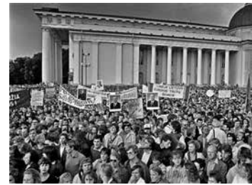
Sąjūdžio mitingas Gedimino aikštėje išlydinti Lietuvos delegatus į XIX TSKP konferenciją. Vilnius, 1988 06 24

Vidurio ir Rytų Europos veidą pakeitusios „aksominės revoliucijos“ neabejotinai buvo ir tebėra vienas mįslingiausių XX a. istorijos įvykių. Sunku tikėtis, kad įvairiems socia-