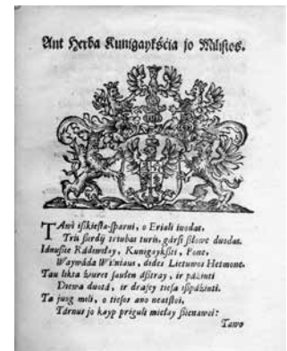
S. Jaugelio Telegos panegirika J. Radvilai.