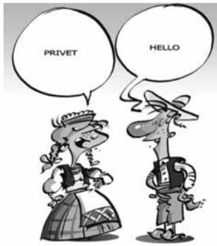
R. Daukanto piešinys.

O kam jį drausti, juk niekas juo ir nesinaudoja. Štai čia viskas atsiskleidžia. Taip, lietuviai Google vertėju nesinaudoja, nes juo praktiškai neįmanoma naudotis. Tačiau pasaulyje visi vertėjai kartu paėmus per metus išverčia tiek tekstų, kiek Google išverčia per vieną dieną! Ar kiti ne tokie išrankūs, kaip mes, lietuviai? Ne, jų vertimai, jeigu ir netobuli, tai nepalyginti kokybiškesni. Tai pasiūlykime Lietuvių kalbos komisijai parašyti laišką Google vadovams, kad ištaisytų padėtį. Juokinga, ar ne? Tai išprašykime nevykusį vertėją iš savo kompiuterių. Išeis ir pats Google , o be jo mes apsieiti nemokame. Darželinukas Google suranda mikliai ir prašo: „ pagūglink man tą ar aną“, mat rašyti dar neįpramoko.