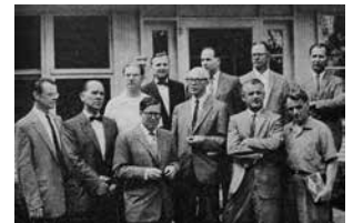
Lietuvių Fronto bičiulių būrelis studijų savaitės metu.

Pasipriešinimo vadovybė. 1941 m. rugpjūčio 5 d. vokiečiams prievarta sustabdžius Lietuvos Laikinosios Vyriausybės veikimą, dalis jos narių bandė sudaryti pagrindinę Vyriausybę, tačiau to padaryti nepavyko. 1942 metais pogrindyje veikė Tautos Taryba ir Vyriausias Lietuvių Komitetas. Pirmąjį sudarė kai kurie Laikinosios Vyriausybės nariai ir politikai, daugiau ar mažiau išsiugdę krikščioniškose organizacijose. Antrajame telkėsi liberalinės, tautininkiškos ir socialdemokratinės ideologijos veikėjai.