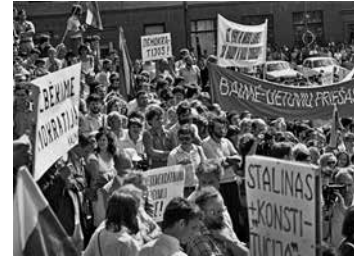
Sąjūdžio mitingas prieš įstatymą, ribojantį demonstracijų laisvę, prie Lietuvos TSR Aukščiausiosios Tarybos rūmų, Vilnius, 1988 07 26.

Atrodo, kaip tik čia glūdi pamatinės ir niekada visiškai neįveikiamos įtampos tarp pilietinės ir politinės visuomenių gelminis šaltinis. Tam tikromis sąlygomis politinę visuomenę, arba valstybę, tiesiogine šio žodžio prasme gali „praryti“ dėl valdžios kaip resurso beatodairiškai kovojanti pilietinė visuomenė. Kai noras ir gebėjimas laikytis politinės visuomenės sambūvio principų, arba bendrų žaidimo taisyklių, smarkiai sumenksta ar net visai išnyksta, prasideda modernios visuomenės slinktis antrinės, arba jau „civilizuotos“ prigimtinės būklės – anarchijos – link. XX a. Rusijos ir Vokietijos patirtys aiškiai atskleidė