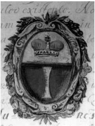
Kėdainių ir Jonušavos herbai 1648m. V. Vazos privilegijoje.

Tolesnius planus ir pradedančią įsibėgėti veiklą sugriauna karas. Žemaitiją ir Jonušo Radvilos Kėdainių dvaro valdą okupuoja švedai, rytinę Lietuvos dalį iki Nevėžio ir Vilnių – Maskvos caro kariuomenė. Karą lydi badas ir maras. 1655 m. spalio 2 d. buvo sudaryta Kėdainių sutartis, o po kelių mėnesių – 1655 metų pabaigoje – Jonušas Radvila mirė, būdamas 43 metų, tik 15 metų pergyvenęs savo tėvą Kristupą. Ankstyva mirtis, matyt, ir buvo ta kaina už savarankišką asmenybės laikyseną ir politikoje, ir renkantis tikėjimą, ir už palyginti savarankiškas kultūrinės nuostatas.