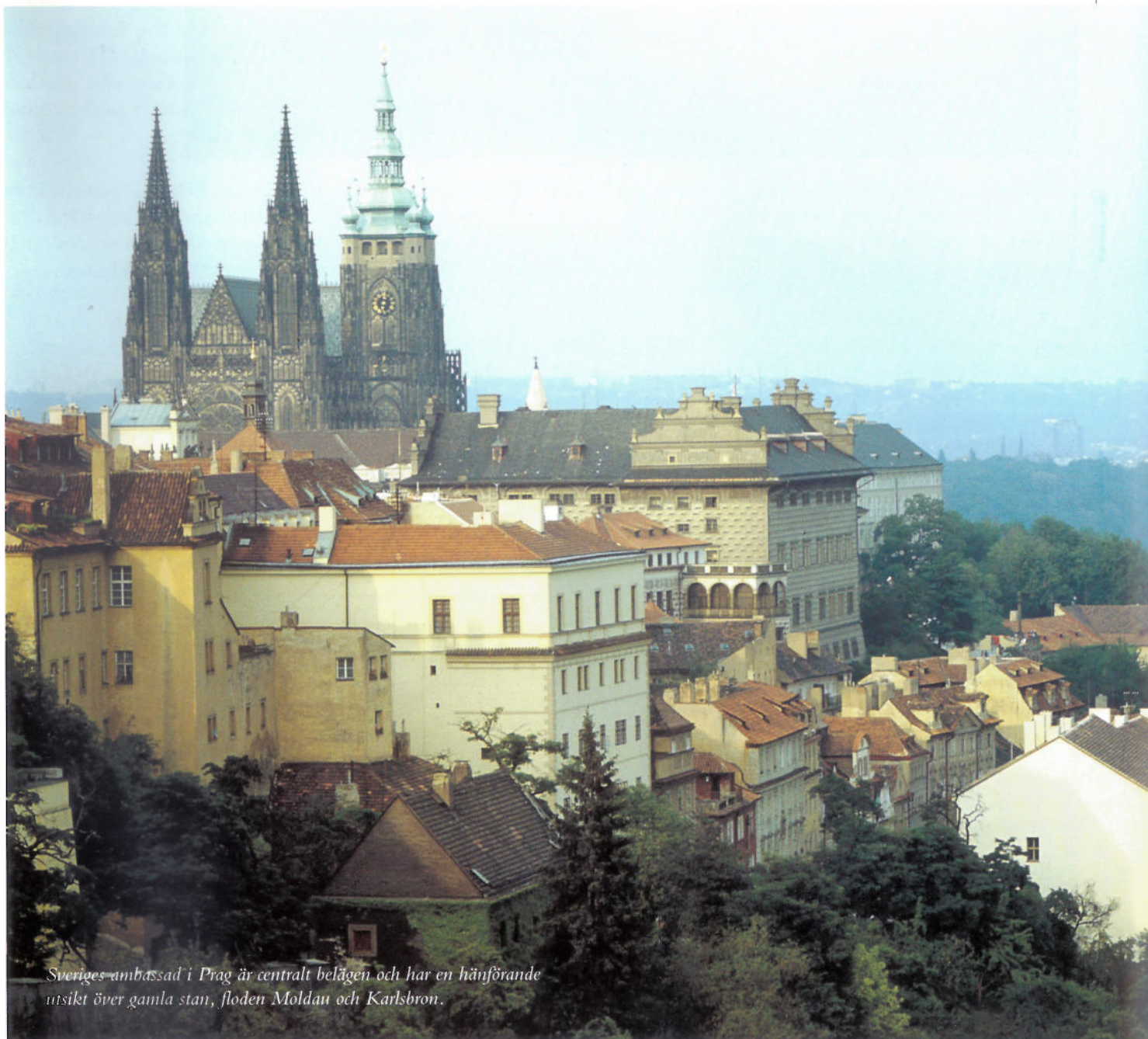
Sveriges ambassad i Prag är centralt belägen och har en hänförande utsikt över gamla stan, floden Moldau och Karlsbron.