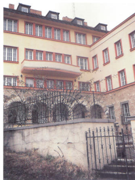
Sveriges ambassad i Prag finns i ett vackert litet palats som nu ska renoveras.

När kommunistregimen föll för fyra år sedan gav den tjeckiska sta-