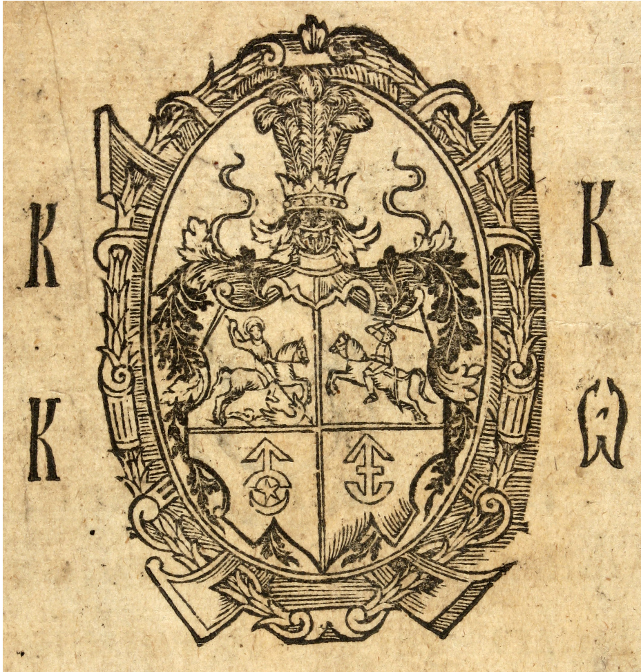
Рис.4: Герб князя Василя-Костянтина Острозького з «Острозької Біблії» 1581 року.

Дім Острозьких троє знаків слушно має в своїм гербі: