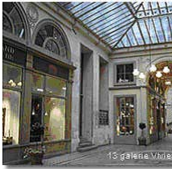
13 galerie Vivienne donde habitó Vidocq y también brindaba conferencias

El año de 1845, abrió una exposición en Londres, donde dio conferencias, contó interesantes sucesos en que había intervenido, y mostró sus capacidades para el disfraz. “ ¡Yo soy Vidocq! ” era su grito de triunfo, grito que utilizó el orgulloso detective de ficción de Agatha Christie cuando decía: “ ¡Yo soy Poirot! ” .