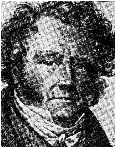
Vidocq, por Marie Gabriel Coignet

Contemplando su retrato grabado que de él hizo el artista Coignet, cuando Vidocq había alcanzado la madurez, llama la atención lo despejado de su frente y el recto mirar de sus ojos, unido todo ello a unas facciones regulares y hasta distinguidas. No es, sin duda, el rostro de un delincuente. De hecho, Vidocq no lo era en lo más profundo de su ser. Su rebeldía y su agresividad lo habían llevado al delito; su inteligencia, que era aguda y muy notable, podía sacarlo de él.