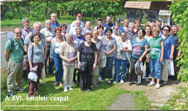
A XVI. kerületi csapat

TIZENKETTEDIK ALKALOMMAL SZERVEZETT ZARÁNDOKUTAT A CSÍKSOMLYÓI BÚCSÚRA A RÁKOSSZENTMIHÁLYÉRT KULTURÁLIS EGYESÜLET. A RÉSZTVEVŐK – AKIK A KERÜLET LEGÚJABB TESTVÉRTÉLEPÜLÉSÉN, CSÍKSZENTMIHÁLYON SZÉKELY CSALÁDOKNÁL SZÁLLTAK MEG – A TÖBBI KÖZÖTT MEGTEKINTETTÉK TOROCKÓT, A TORDAI HASADÉKOT ÉS A SÓBÁNYÁT, ILLETVE A KERÜLETI ADOMÁNYOKBÓL IS ÉPÜLT SZÉPHAVAS KÁPOLNÁT, ÜNNEPI SZENTMISÉN VETEK RÉSZT A CSÍKSZEREDAI SZENT ÁGOSTON TEMPLOMBAN, AZ ALSÓCSERNÁTONI NÉPRAJZI MÚZEUMBAN EMLÉKEZTEK MEG A TRIANONI DIKTÁTUM ALÁÍRÁSÁNAK 97. ÉVFORDULÓJÁRÓL, DE KORTYOLTAK AZ IGAZI CSÍKI NEDŰBŐL IS A SÖRGYÁRBAN. A KORÁBBI FELESLEGES PÁNIKKELTÉS ELLENÉRE MINDENKI EGÉSZSÉGESEN, ÉLMÉNYEKKEL GAZDAGON TÉRT HAZA, AZT PEDIG MINDEN BIZONNYAL SOHA NEM FELEJTI MAJD EL, MILYEN VOLT A 450. CSÍKSOMLYÓI BÚCSÚN TÖBB SZÁZEZER MAGYAR TESTVÉRÜNKKEL EGYÜTT ÉNEKELNI NEMZETI IMÁDSÁGUNKAT ÉS HÁLÁT ADNI BABBA MÁRIÁNAK AZÉRT, HOGY TOVÁBBRA IS VIGYÁZ RÁNK.