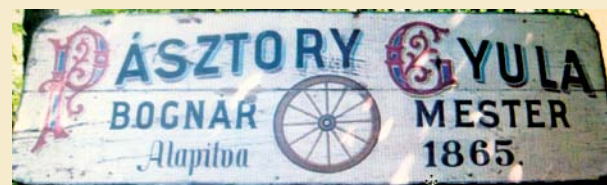
A Pásztori bognárműhely cégtáblája

Visszatérve a gyűjtésre, a gyűjtők köztudottan bogaras emberek. Képesek órákat eltölteni mások által megunt, poros holmik között, lupéval vizsgálgatni rég a túlvilágra költözött emberek arcvonásait, rendszert keresnek számok és évszámok között, újságcikkekből következtetnek eleink szokásaira. Egy igazi gyűjtő soha nem adja fel a hiányzó érme,