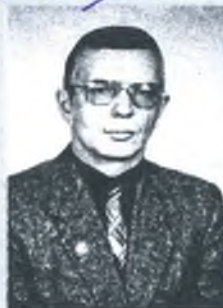
Редактор альманаха. Журналист.

Уважаемые горожане! У Вас в руках первый в истории нашего города журнал – альманах «Каменский Завод». Это особенное издание, уже потому, что не каждый город в России имеет свой периодический альманах.