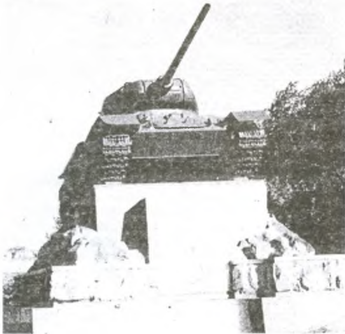
Нижний Тагил.

г. Челябинске на Комсомольской площади [11]. Это тот самый военный “бог” уральского Танкограда. Реактивная установка “Катюша” – памятник создателям гвардейских минометов, установлена была 8 мая 1975 г. в г. Челябинске на ул. Доватора, 15 [ 11 ]. Танк Т-34, последний из числа выпускавшихся на Уралвагонзаводе до сих пор стоит в качестве последнего образца военной техники на “вечной стоянке” у проходной с 8 сентября 1946 г. Этот танк – символ окончания войны [ 12 ]. Тем не менее, в 2000 году сняли его с пьедестала и заставили лихо пробежать на Уральской военной выставке вооружения как “легенда в броне”. Но до сих пор существует много образцов старого русского оружия с уральской маркировкой, о которых мало что или совсем ничего не известно.