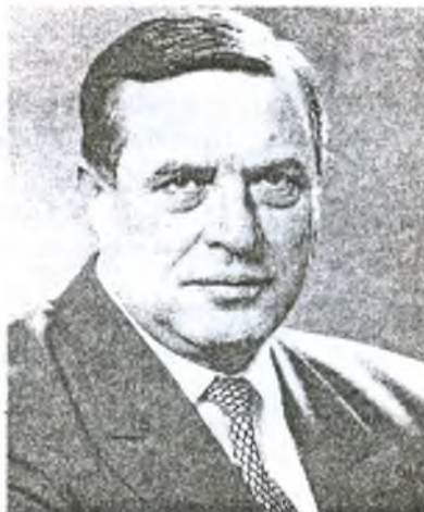
Геннадий Николаевич Селезнев спикер Государственной Думы, лидер движения «Россия»

Итоги право-радикального эксперимента у всех на виду. Многократное падение ВВП, полная дезорганизация финансовой системы, упадок наиболее высокотехнологичных секторов хозяйства, массовая безработица, катастрофическое снижение уровня жизни для большинства населения. Социальные завоевания СССР, такие, как гарантированная занятость, лучшая в мире система