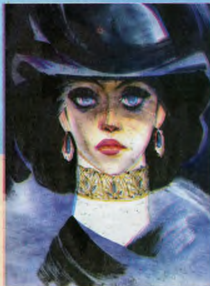
Женский портрет Гуашь