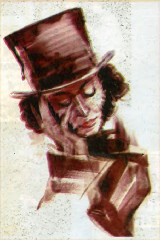
Мой Пушкин Акварель

Я стал художником потому, что вокруг было так много разноцветных глин по берегам Каменки и Исеги, что не рисовать было невозможно. Во время войны мои штаны были всегда разного цвета. И теперь, когда в наших