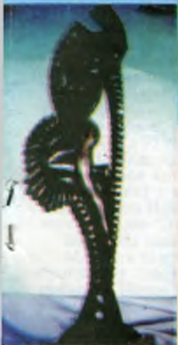
Птица счастья Сосна