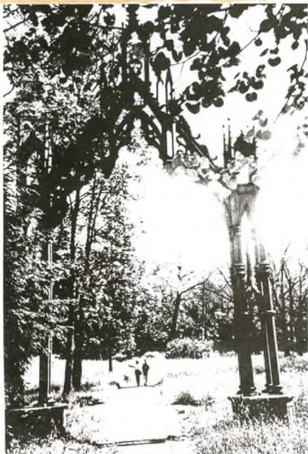
Арка Царскосельского парка.