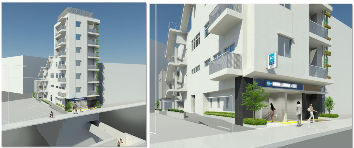
新設出入口外観イメージ