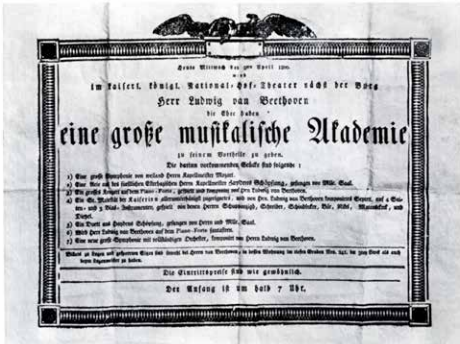
Affiche van de Akademie op 2 april 1800

Van even groot belang waren de Strijkkwartetten opus 18, die Beethoven enkele jaren later componeerde in opdracht van Lobkowitz. Doordat hij maximaal gebruik kon maken van de faciliteiten die Lobkowitz hem bood om in zijn Palais