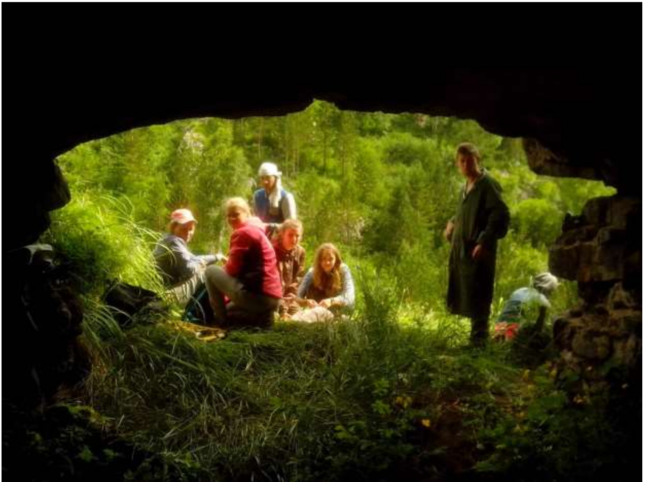
На выходе из пещеры