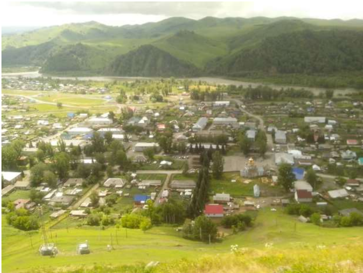
Церковь Казанской иконы Божией Матери

Село Чарышское основано в 1765 году и является административным центром Чарышского района. От базы до Чарышского 13 км пути (из них 4 по грунтовой и 9 по асфальтовой дороге). Село богато достопримечательностями.