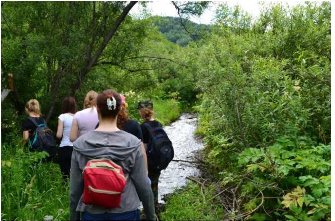
Дорога на «Стожок»