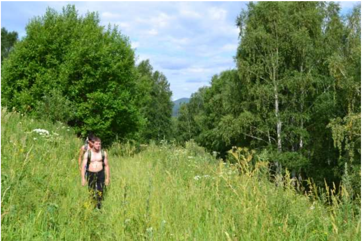
Дорога на «Стожок»

Расположена на левом берегу реки Чарыш, в 15 км от села Красный Партизан. Стожок – это каменный останец высотой около 20 м, по форме напоминающий стог сена. Под Стожком находится тихая глубокая заводь реки Чарыш с песчаным берегом, удобная для причала и купания. С другой стороны останца – большая поляна, рядом с останцем есть автомобильная дорога. До Стожка от базы Голубой утес можно добраться пешком, правда придется пройти достаточно серьезное расстояние -14 км. в одну сторону по довольно таки пересеченной местности.