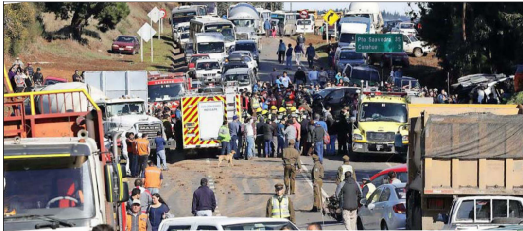
El fatal accidente de tránsito ocurrió en el sector Champulli.

La camioneta que se detuvo señaló con la intención de hacer un viraje hacia la izquierda. Sin embargo, según fuentes policiales, finalmente realizó el viraje de forma abrupta sin tomar en cuenta el desplazamiento del microbús, cuyo chofer también debió maniobrar repentinamente, por lo que perdió el control del vehículo.