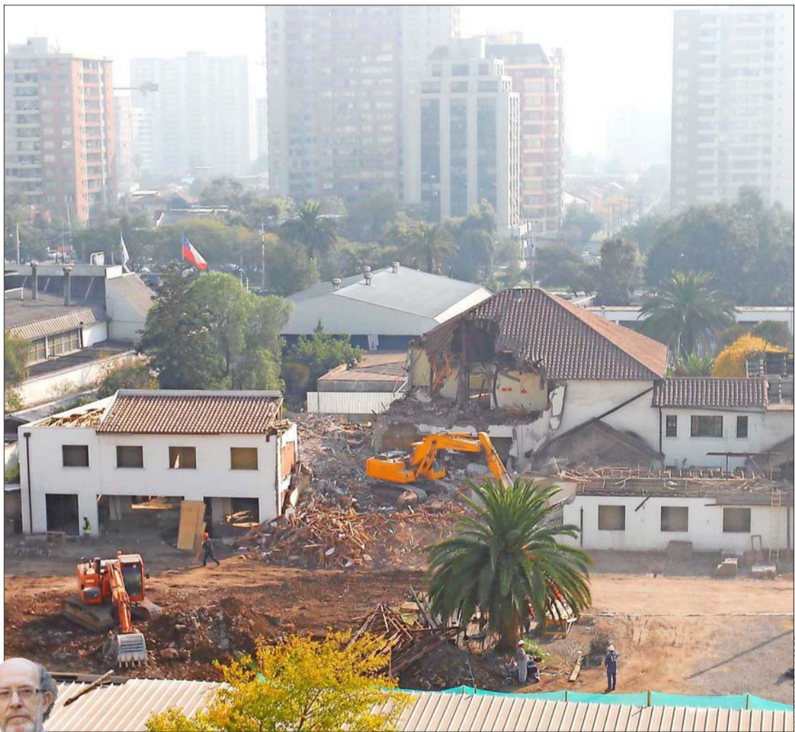
EJEMPLO.— La reciente demolición de dos casonas de San Miguel, para levantar la nueva Corte de Apelaciones de esa jurisdicción, es otro caso de una ciudad que se impone ante otra.

Cuando ya estaba casi lista, con los mejores monumentos que jamás se habían visto en esas tierras australes, con toda la ciencia de ingenieros militares llegados como expertos en fuertes y fortalezas del siglo 18, los impulsores foráneos fueron expulsados y las nuevas generaciones tomaron el control.