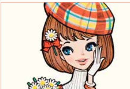
《ベレー帽の少女》『春のチャームブック』表紙イラスト復刻原画 2017年