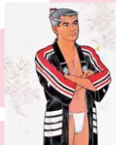
雑誌『薔薇族』表紙原画 (1993年頃)