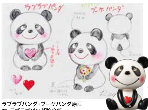
ラブラブパンダ・ブーケパンダ原画 右・ラブラブパンダ貯金箱