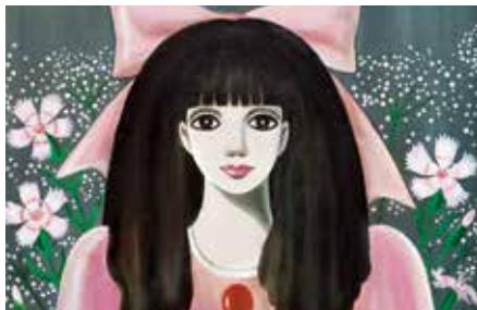
《ナナ・ヴィューの肖像》(1975年)

表面の作品/写真左上より時計回りに《ときめき》(『ジュニアそいゆ』第33号表紙イラスト復刻原画 2017年)、バッキンガムの近衛兵さん、パリのおまわりさん貯金箱、アップルパンダ原画、《海の記憶》、《眠り》、天使シリーズデッサン、《ピンクの少女像》(1959年 所蔵:弥生美術館)、《八人の魔女の肖像》(復刻 2013年)、《雪の日に》、《こんにちは! マドモアゼル》(『ジュニアの日記』表紙イラスト復刻原画 2017年)、《ジャスティン-私の人形-》(2001年)、花のレターセット(集英社『少女ブック』付録 1958年)、青い鳥レターセット(集英社『少女ブック』付録 1962年)、《MODEL》(付録用イラスト復刻原画 2017年)