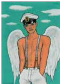
《天使ガブリエル》(2006~2007年)