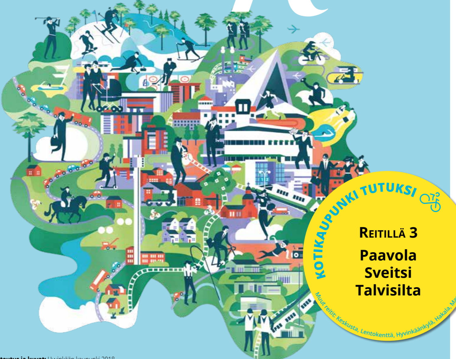
Toteutus ja kuvat: Hyvinkään kaupunki 2018 www.hyvinkaa.fi/teemakartat

Lukot eli supat ovat syntyneet jääkauden aikana jään sulaessa. Sveitsinharjun suurimman lukon pohjan ja sen viereisen harjanteen laen välinen korkeusero on 34 metriä. Supan rinteellä ollut iso hyppyrimäki purettiin 2012. Supassa on järjestetty monenlaisia tapahtumia kuten kesäjuhlia ja kruunuhäitä.