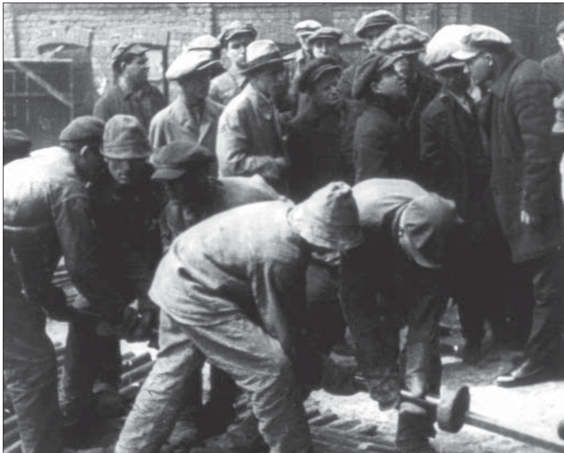
Група українських письменників під час відвідання металургійного заводу. Донбас, 1929 р. Од. обл. 1409.