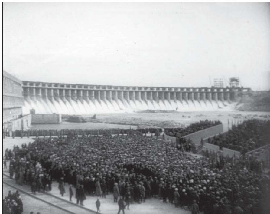
Святкові заходи, присвячені пуску Дніпрогесу. 1927 р.