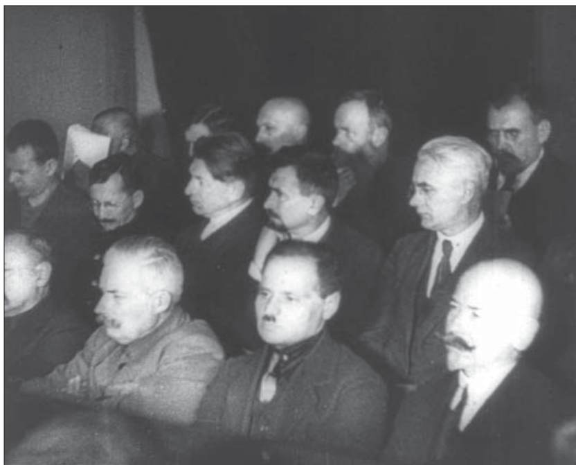
Судовий процес над членами СВУ. Харків, 1930 р. Од. обл. 2611.