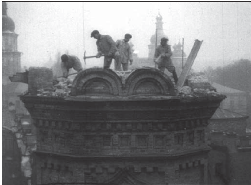
Розбирання на цеглу церкви “Трьох святих”. Київ, 1929 р. Од. обл. 3058.