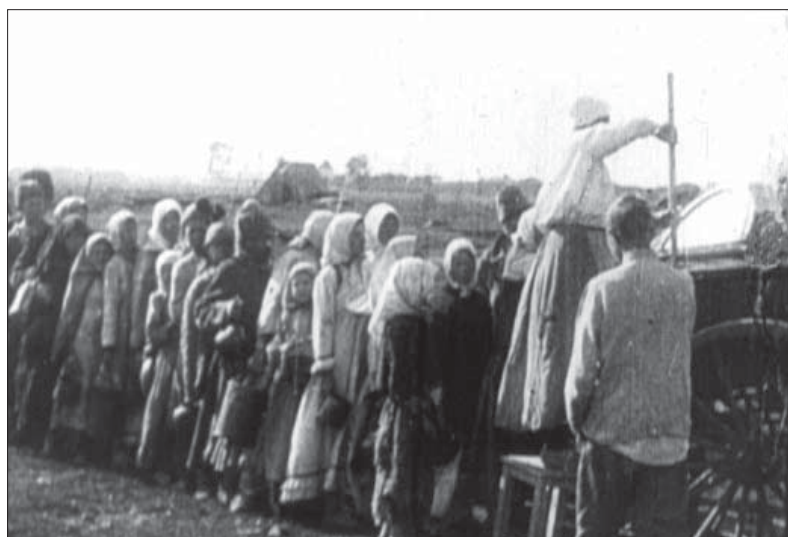
Голод в Україні 1921–1922 рр. Од. обл. 138.