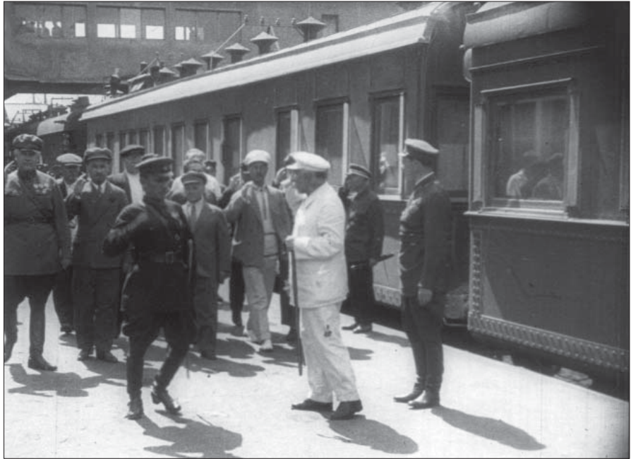
Керівники ЦК КП(б)У та Раднаркому УСРР на Київському залізничному вокзалі у зв'язку з переїздом до нової столиці. Київ, 1934 р. Од. обл. 2609.