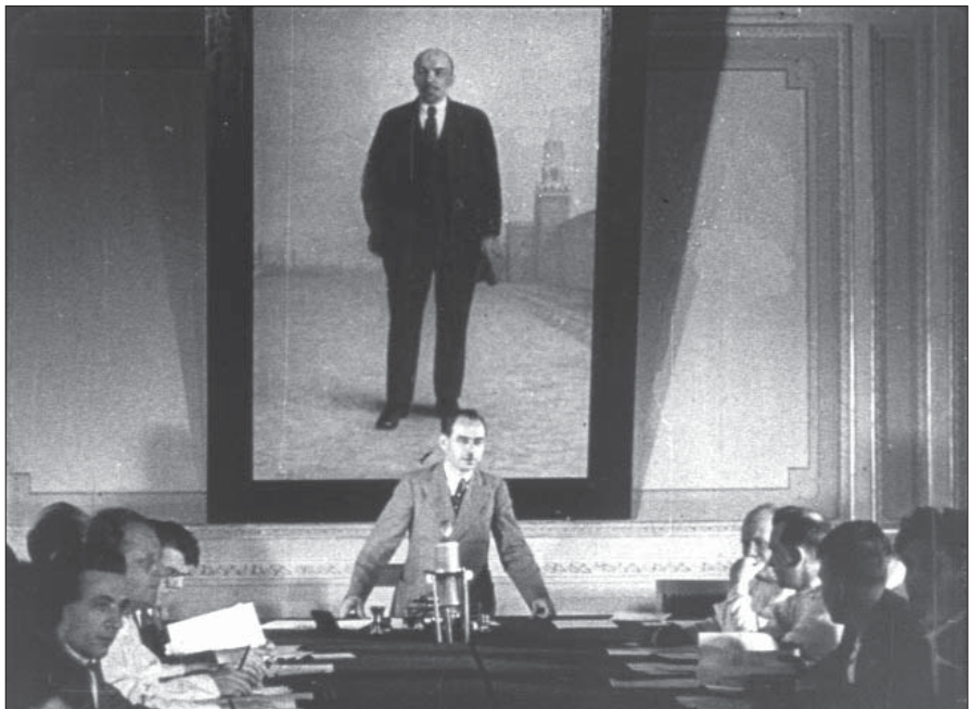
Перше засідання Президії Верховної Ради УРСР. Київ, липень 1938 р. Од. обл. 17.