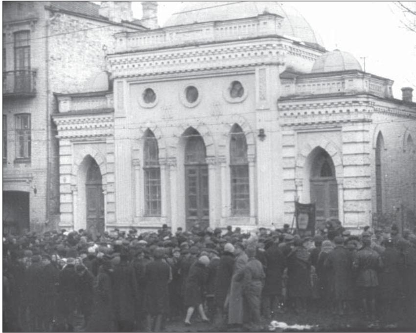
Антирелігійний мітинг у Дніпропетровську з вимогою закрити церкву “300-ліття дому Романових”. 1929 р. Од. обл. 1399.