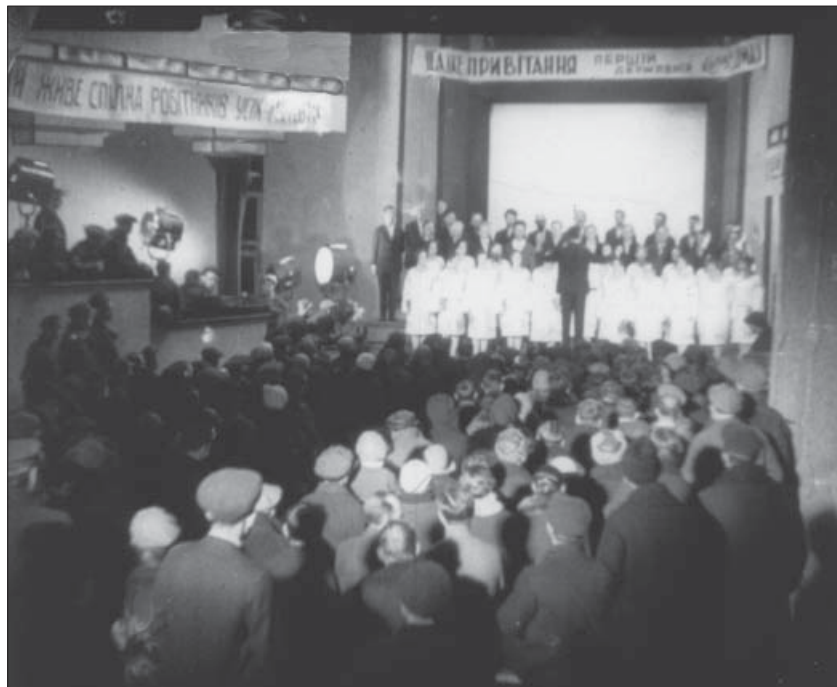
Капела "Думка" виступає перед працівниками Київської кінофабрики. Київ, 1930 р. Од. обл. 1452.