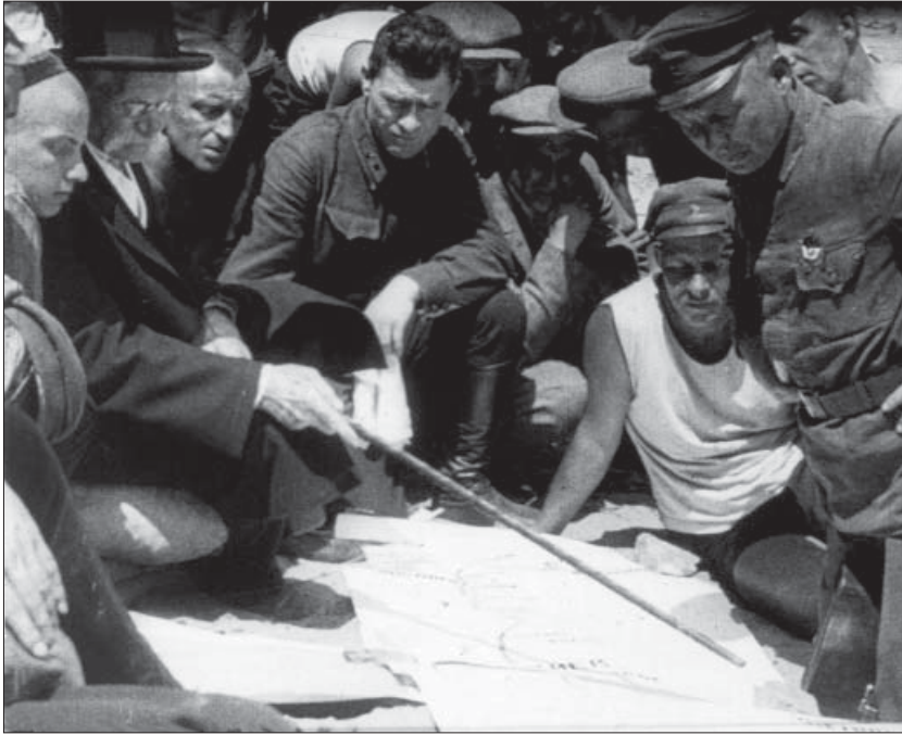
Академік ВУАН Д. І. Яворницький консультує учасників військово-спортивної експедиції. Дніпропетровськ, 1929 р. Од. обл. 1412.