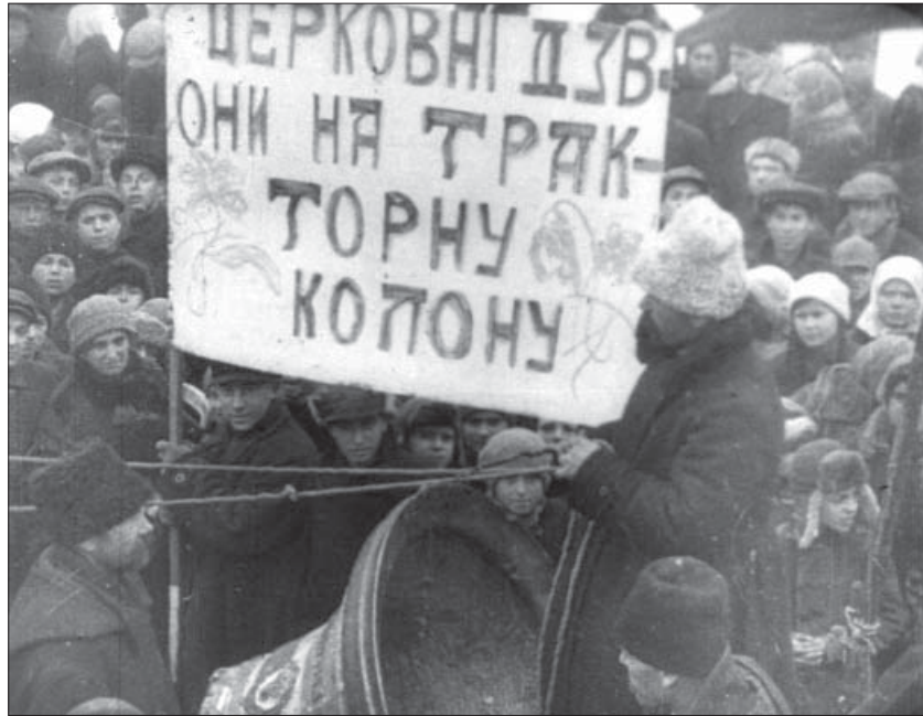
Церковні дзвони – на тракторну колону. Немирів, 1930 р. Од. обл. 1442.