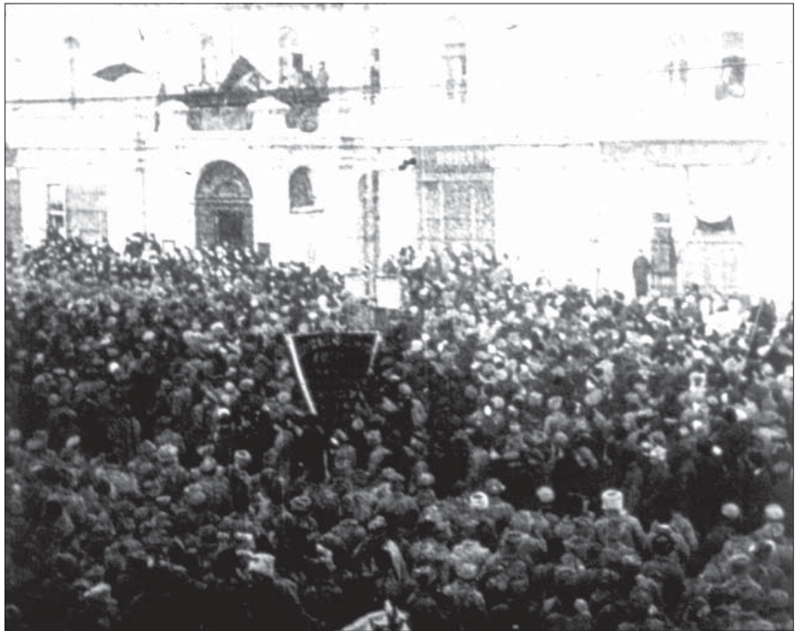
Мітинг на Думській площі з нагоди вступу до Києва 1-ї Української повстанської дивізії. Лютий 1919 р. Од. обл. 1680.