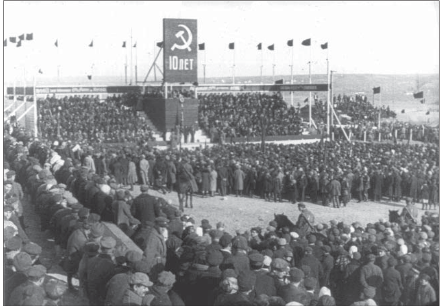
Урочистості з нагоди закладин Дніпрогесу. 1927 р. Од. обл. 2597.