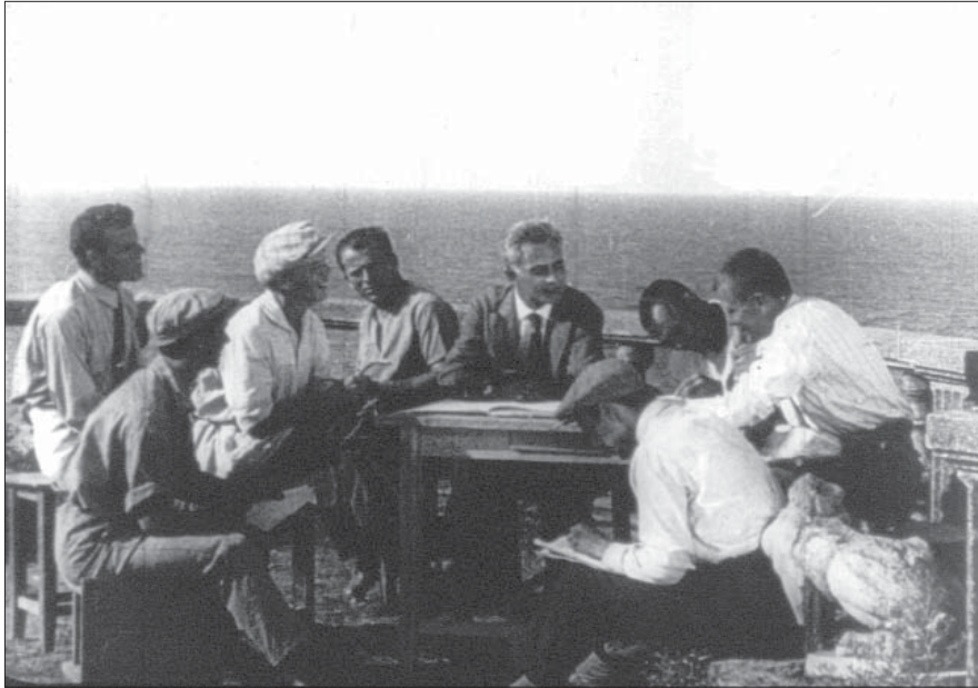
Керівник театру “Березіль” Лесь Курбас із групою акторів. 1927 р. Од. обл. 2601.