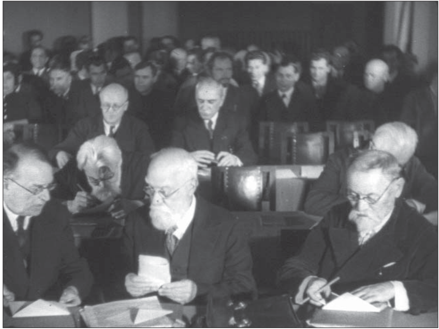
Загальні збори АН УРСР з нагоди обрання дійсних членів академії. Київ, 1939 р. Од. обл. 40.