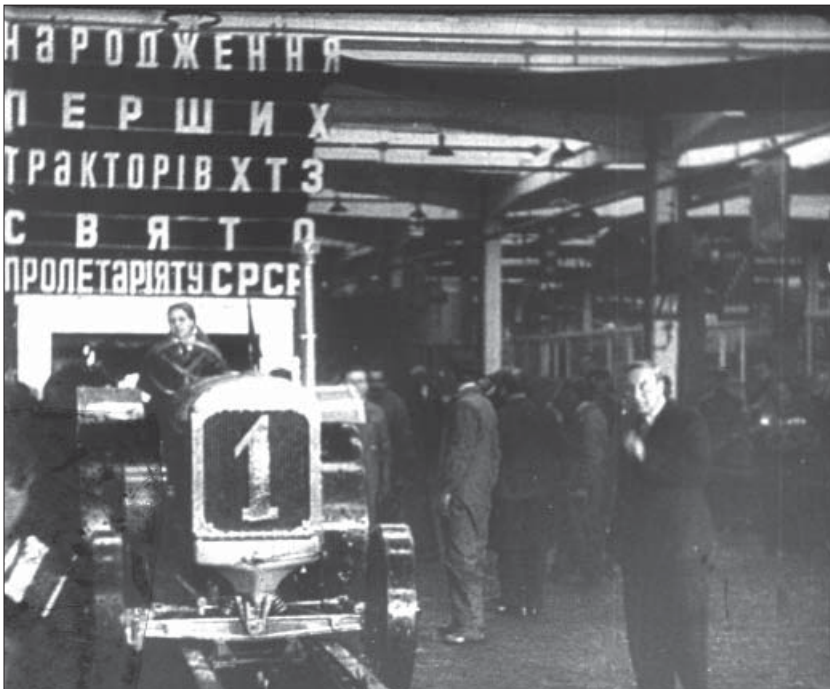
Перший трактор виробництва ХТЗ. Харків, 1931 р. Од. обл. 1695.