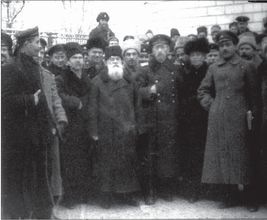
Голова Української Центральної Ради М. Грушевський серед делегатів 8-ї сесії УЦР. Київ, грудень 1917 р. Од. обл. 1696.