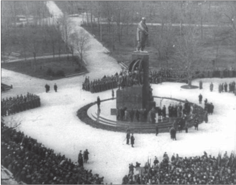
Урочистості з нагоди відкриття у Харкові пам'ятника Т. Г. Шевченку. 1935 р. Од. обл. 1678.