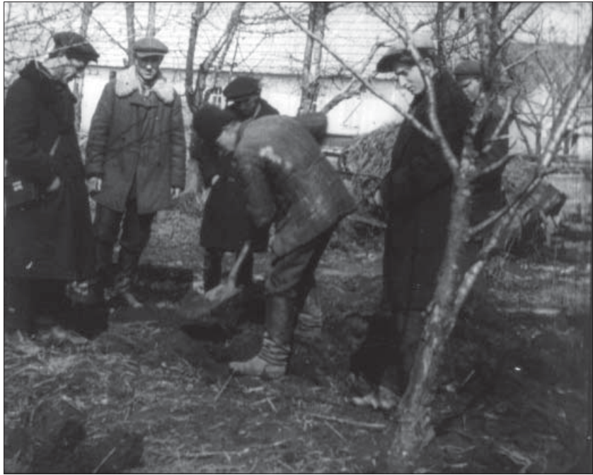
Пошуки захованого майна на подвір'ї заможного селянина у с. Сурсько-Литовське. 1931 р. Од. обл. 1517.