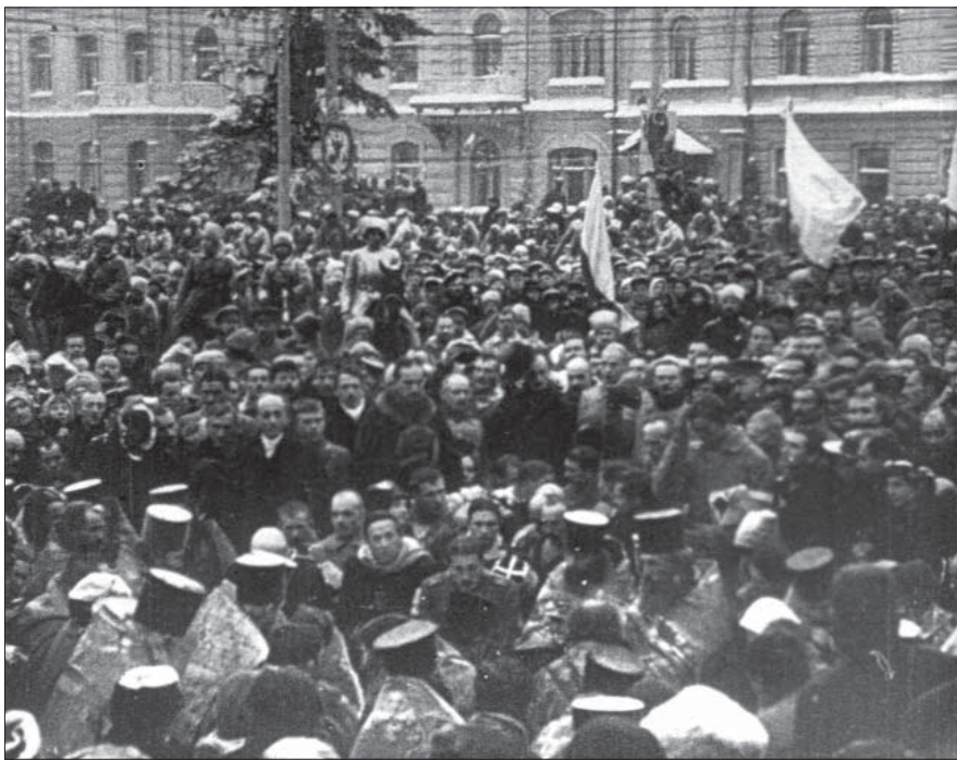
Урочистий молебень на Софійській площі з нагоди вступу до Києва військ Директорії. Грудень 1918 р. Од. обл. 593.