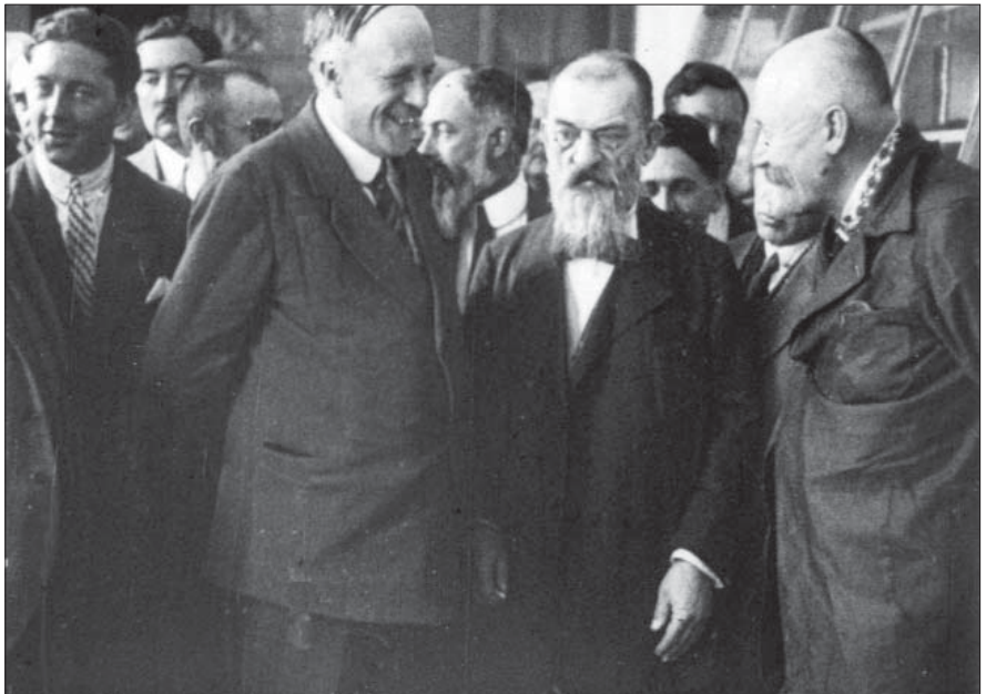
Президент ВУАН Д. К. Заболотний і академік П. А. Тутковський під час зустрічі з членами кооперативної делегації Франції. Київ, 1929 р. Од. обл. 1413.