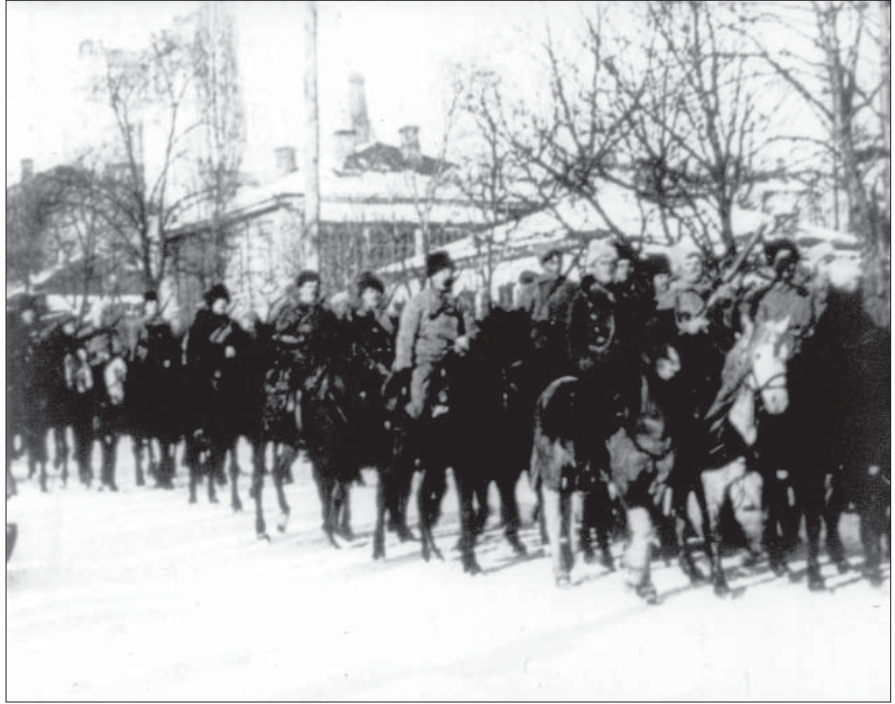
Вступ до Києва 1-ї Української повстанської дивізії. Лютий 1919 р. Од. обл. 1680.