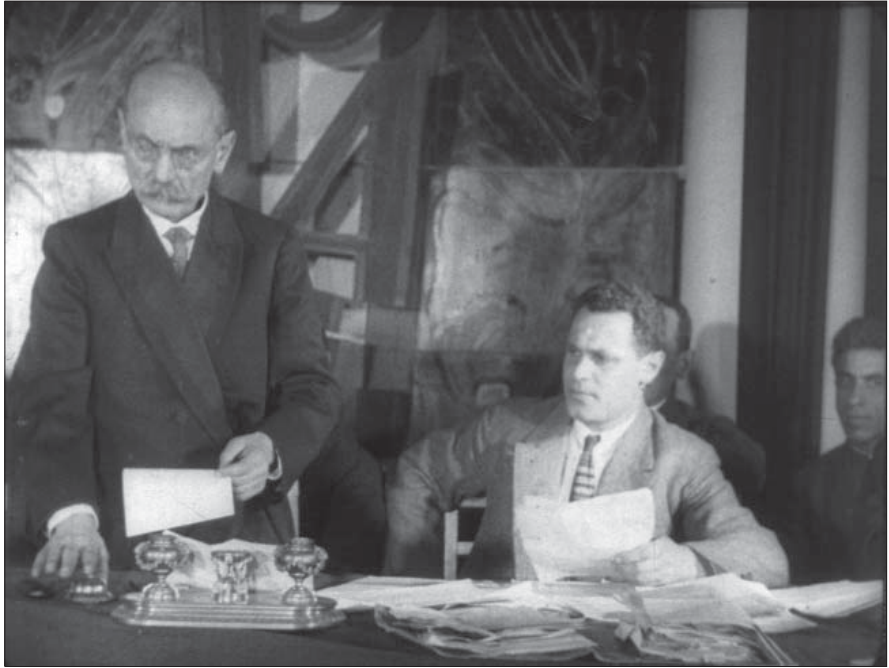
Президент ВУАН В. І. Липський відкриває засідання з нагоди створення нової кафедри. Київ, 1928 р. Од. обл. 3052.