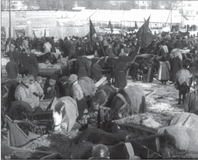
Колективне здавання зерна селянами с. Іллінці. 1931 р. Од. обл. 1387.