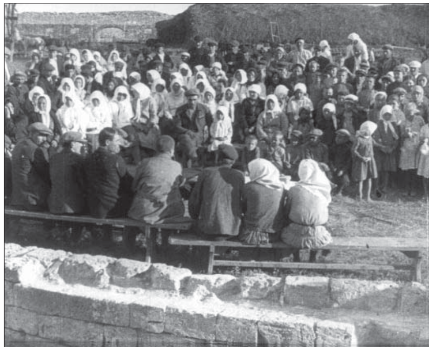
Збори односібників з нагоди вступу до колгоспу. Миколаївщина, 1931 р. Од. обл. 1490.