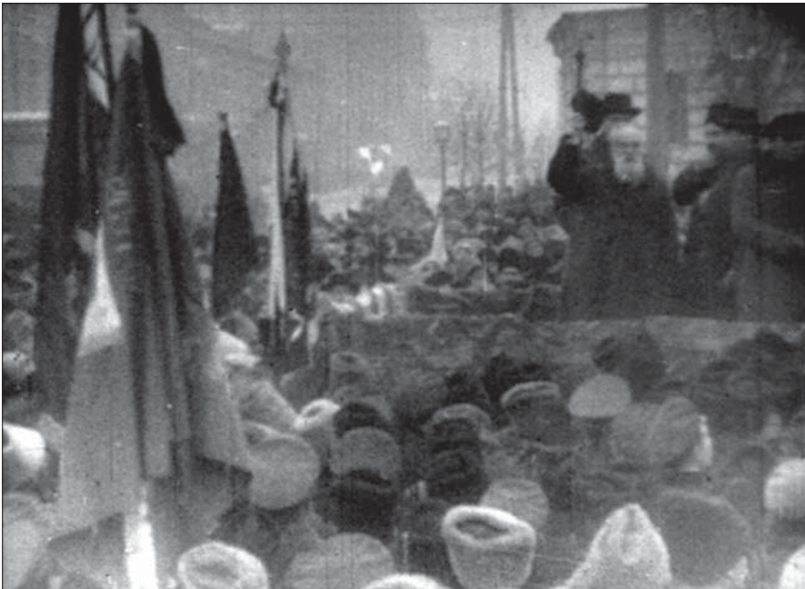
М. Грушевський виступає на мітингу на Софійській площі. Київ, грудень 1917 р. Од. обл. 3295.