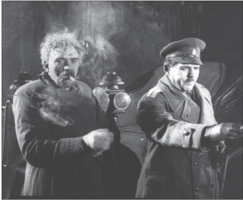
Актори А. Бучма і Ю. Шумський під час зйомок фільму “Нічний візник”. Одеса, 1929 р. Од. обл. 1386.