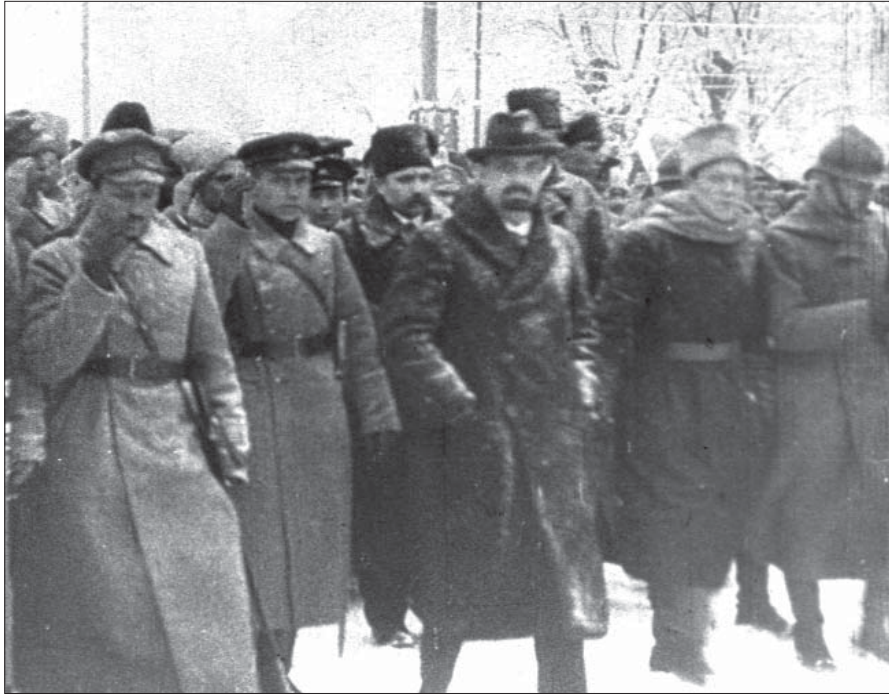
Вступ до Києва військ Директорії на чолі із С. Петлюрою та В. Винниченком. Грудень 1918 р. Од. обл. 593.