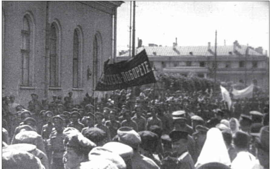
Маніфестація солдат-українців Петроградського гарнізону на підтримку УЦР. Петроград, грудень 1917 р. Од. обл. 3295.