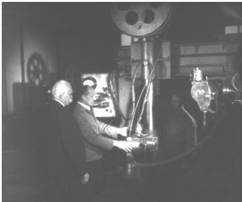
Академік ВУАН С. О. Патон біля нового електрозварювального апарата. Київ, 1939 р. Од. обл. 42.