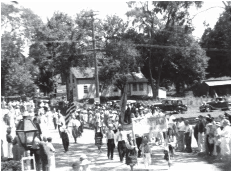
Демонстрація українців Істфорда на честь героїв, що полягли за волю України. США, 1930-ті рр. Од. обл. 11993.