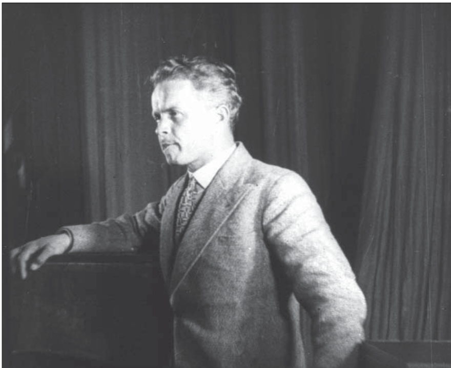
Режисер О. Довженко виступає в робітничому клубі під час проведення кінотижня. Харків, 1927 р. Од. обл. 1441.