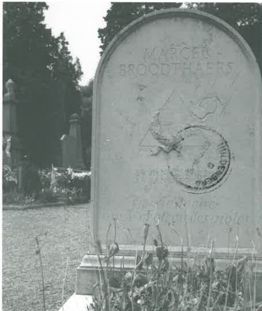
Het grafmonument van Marcel Broodthaers.