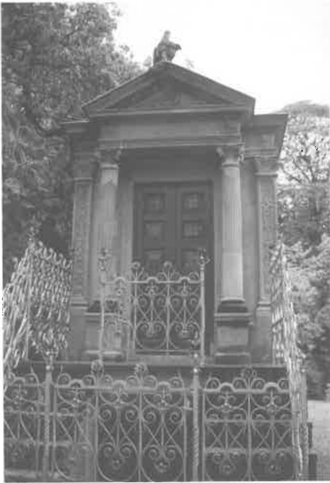
Zorgvlied, mausoleum Oscar Carré.