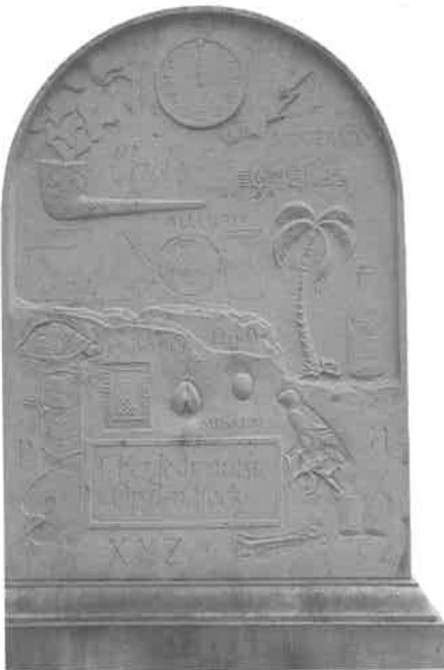
Achterkant van de grafstèle van Marcel Broodthaers.

Broodthaers presenteert zijn werk vaak in de vorm van (soms) ingewikkelde raadsels en rebussen. Toch zijn er enkele steeds weerkerende elementen. Er zijn de eierschelpen en mosselschelpen waarmee hij