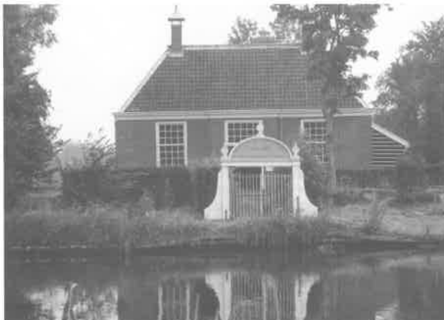
Ouderkerk ald Amstel. Het Rodeamentoshuis met aanlegsteiger