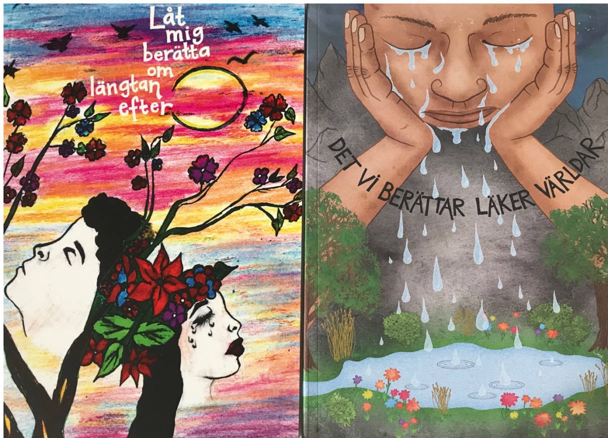
Omslaget till antologin "Låt mig berätta om längtan efter" (2019) är ritat av Silvana Menes och "Det vi berättar läker världar" (2018) av Sarah Katarina Hirani. © Fipoh

Förutom att arbetet med narrativ terapi utgör en viktig del i behandlingen av trauma är det också ett sätt för målgruppen att göra sin röst hörd. I "En liten bok av Fipoh" förhåller sig projektet kritiskt till att Folkhälsomyndighetens senaste och hittills största kartläggning av nyanlända barns och ungas hälsa i Sverige endast inkluderar de som har ett uppehållstillstånd i Sverige. Genom att exkludera till exempel de som befinner sig i en utdragen asylprocess eller de som tvingats in i papperslöshet osynliggörs ett stort antal barn och unga som mår väldigt dåligt. Fipoh har satsat på att lyfta även deras berättelser då vi vuxna måste lyssna på dem.