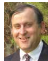
פרופ' אביעד הכהן, דיקן ביה"ס למשפטים והמרכז האקדמי שערי משפט

את מקום הנשמה ידעת? והמצפון, אותו ראית? המי־ששת צדק? ומה ריחה של אמת, טעמו של חסד? שופט לא ידע, לא לבנות בית לא להקים גשר לא לשתול גן פלא. שופט לא לימד עצמו כל אלה. זה דברו של שופט: טובל בקסת עטו וכותב משפט וצדק וחסד. ואלה יהיו עמנו באשר נלך ונבוא, תמיד, בכל יום ובכל עת ובכל שעה.