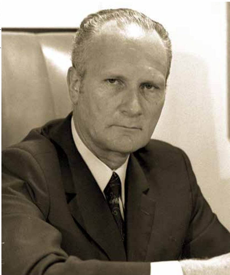
שמגר בכהונתו כשופט בית המשפט העליון, 1976

כיועץ המשפטי לממשלה ביסס את בניין "הנחיות היועץ המשפטי לממשלה" - היכל מפואר של 11 כרכים מלאים וגדושים בהנחיות בכל תחומי המשפט החוקתי והמינהלי