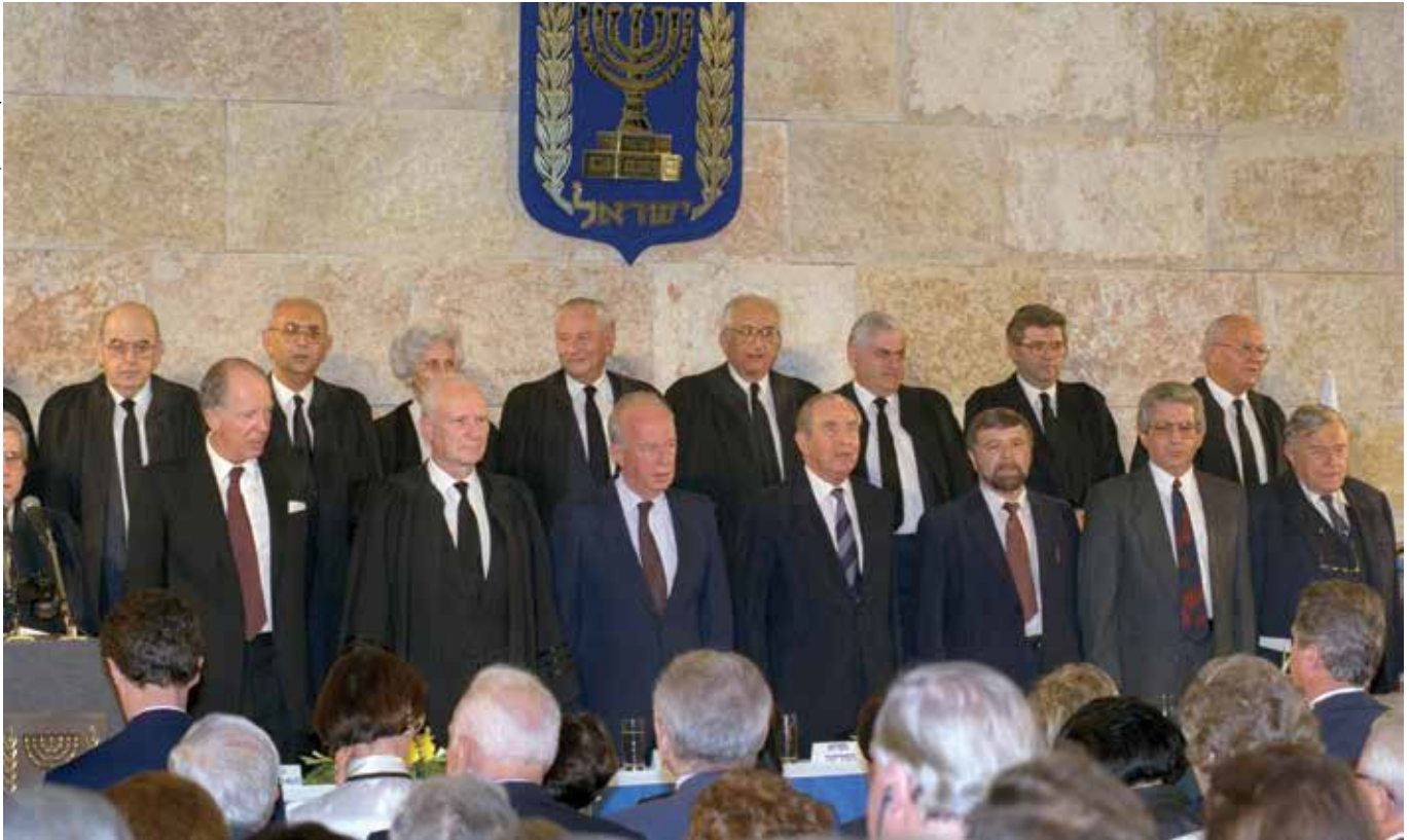
שותף פעיל בבניית משכן הקבע. הנשיא שמגר עם ראש הממשלה רבין ועם הנשיא הרצוג בטקס חנוכת בית המשפט העליון, 1992