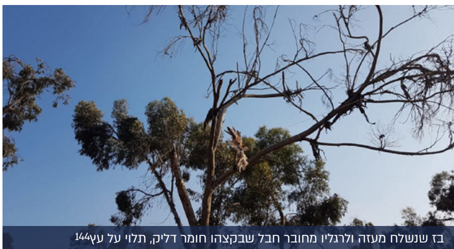
בז שנשלח מעזה ולרגליו מחובר חבל שבקצהו חומר דליק, תלוי על עץ 144

מאמציו באפיק התודעת-אזרחי בדמות "צעדות השיבה" הבלתי-אלימות, לכאורה, באמצעות רתימת ארגוני סיוע בין"ל וארגוני דה-לגיטימציה לציודו. זאת, תוך כדי יצירת דה-לגיטימציה לישראל והגברת השימוש בשיח הקורא ל-BDS. 143 צעדות אלה, הממומנות על-ידי חמאס, כוללות ניסיונות חבלה בכוחות הביטחון סביב גדר הגבול, הנחת מטענים, הפרחת עפיפוני תבערה לעבר יישובים ישראלים ופגיעה במערכת האקולוגית באזור. רוב ההרוגים הפלסטיניים בצעדות משתייכים לארגוני טרור פלסטיניים ובראשם חמאס והחזית העממית לשחרור פלסטין.