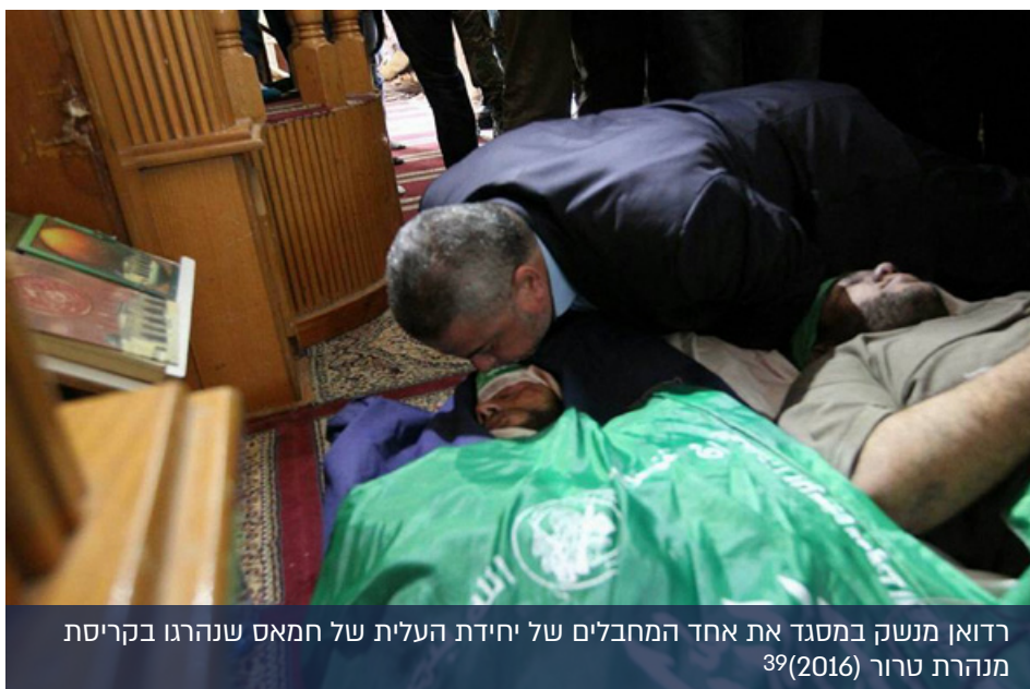
רדואן מנשק במסגד את אחד המחבלים של יחידת העלית של חמאס שנהרגו בקריסת מנהרת טרור (2016) 39

תומכת בהתנגדות מבחינה פוליטית, חומרית, צבאית ותקשורתית". 36 לרדואן התבטאויות מסיתות ואנטישמיות חריפות ביותר לאורך השנים. רדואן משמש גם כנציג חמאס ב"רשות הלאומית העליונה לצעדות השיבה ושבירת המצור", הגוף המארגן את הפעילויות במסגרת צעדות הטרור שהחלו במרץ 2018. 37 במסגרת זו, התבטא רדואן (נובמבר 2018): "הפחדנים האלו, אלו שמתאמים, משתפים פעולה, ומנרמלים (את היחסים) עם הכיבוש. הם יישרכו בגיהנום ביחד עם הקופים והחזירים. אתם יודעים מי אלו הקופים והחזירים? אלו הם היהודים, שהפך אותם האל לקופים ולחזירים". 38