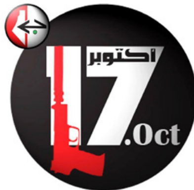
الجبهة الشعبية لتحرير فلسطين Popular Front for the Liberation of Palestine

והביאה מדבריו של בכיר החזית העממית המכנה את הרצח סמל להרואיזם ("a symbol of heroism"). 73 קייטס אף מפנה במאמר שלה לאתר החזית העממית המהלל את הרצח: