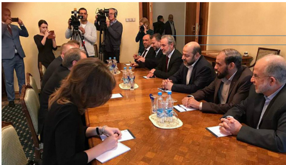
סואלחה אבו מרזוק

ב. במהלך הפגנה בלונדון לאחר מבצע עמוד ענן (2012) התבטא בשבח ירי הטילים: "באנו לחגוג את תבוסתו של 'הצבא הבלתי-מובס' שטילי ההתנגדות הפלסטינית הביסו אותו." 220