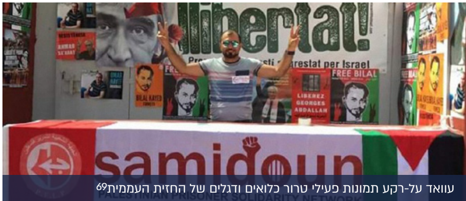
עוואד על-רקע תמונות פעילי טרור כלואים ודגלים של החזית העממית 69