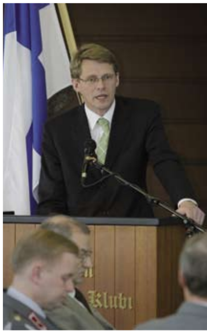
Puolustusministeri Matti Vanhanen puhumassa kadettiisiin upseeri-tapaamisessa Helsingin Suomalaisella Klubilla.