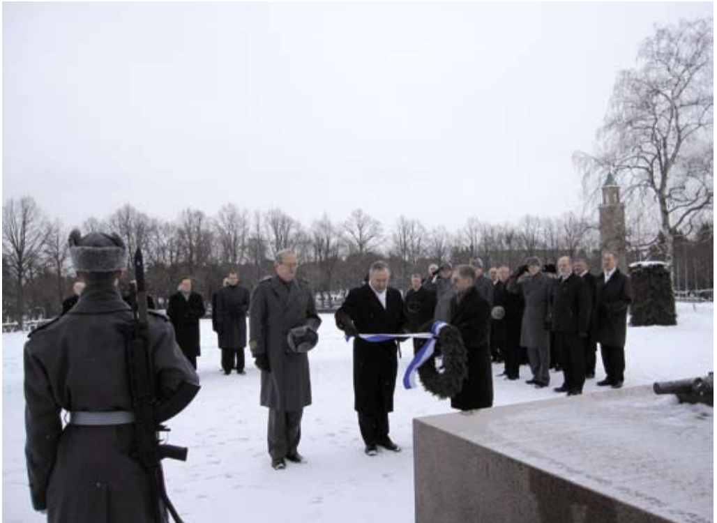
Seppelenlaskutilaisuus 27.1.2009 Hietaniemen sankarihautausmaalla.