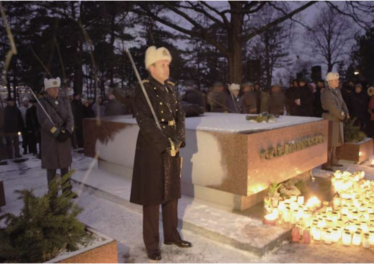
Kenraalit kunniaavartiossa Suomen Marsalkan hautapaadella, etualalla puolustusvoimien komentaja amiraali Juhani Kaskeala.

kuultiin tapahtumassa ensimmäistä kertaa mieskuorolaulua. Silloin ohjelma oli seuraava