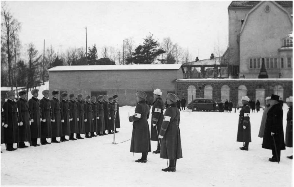
Kadettikoulun vuosipäiväjuhlan paraati 28.1.1939 Munkkiniemen urheilukentällä. Sotamarsalkka Mannerheim suorittamassa paraatikatselemusta.