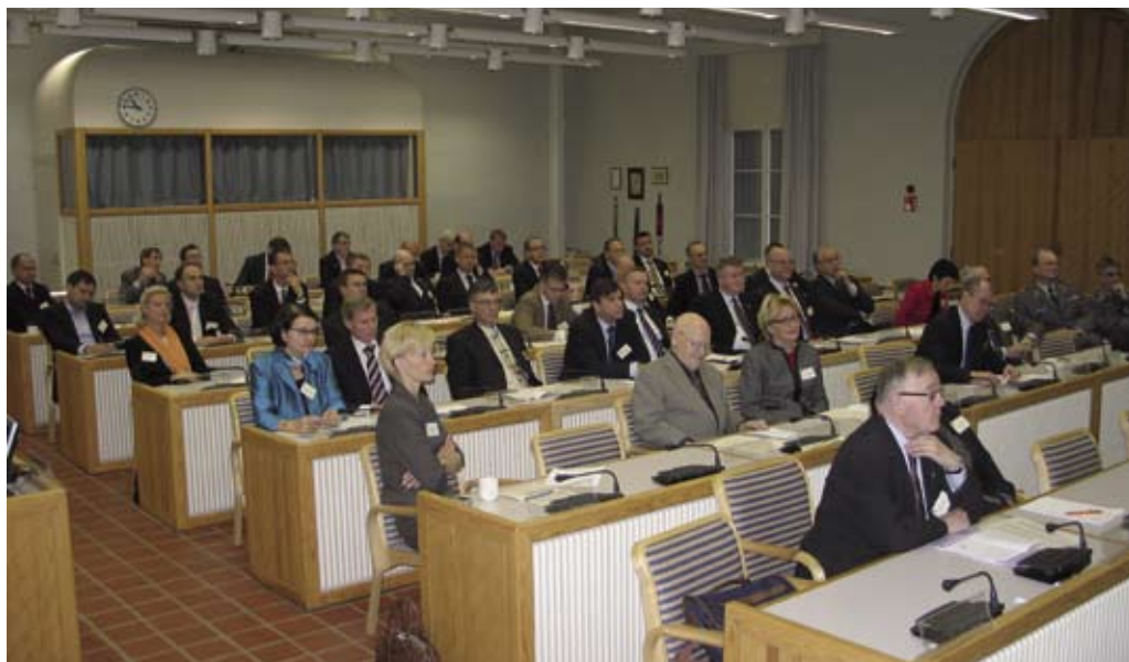
Seminaariin osallistujat kuuntelemassa esitelmää.