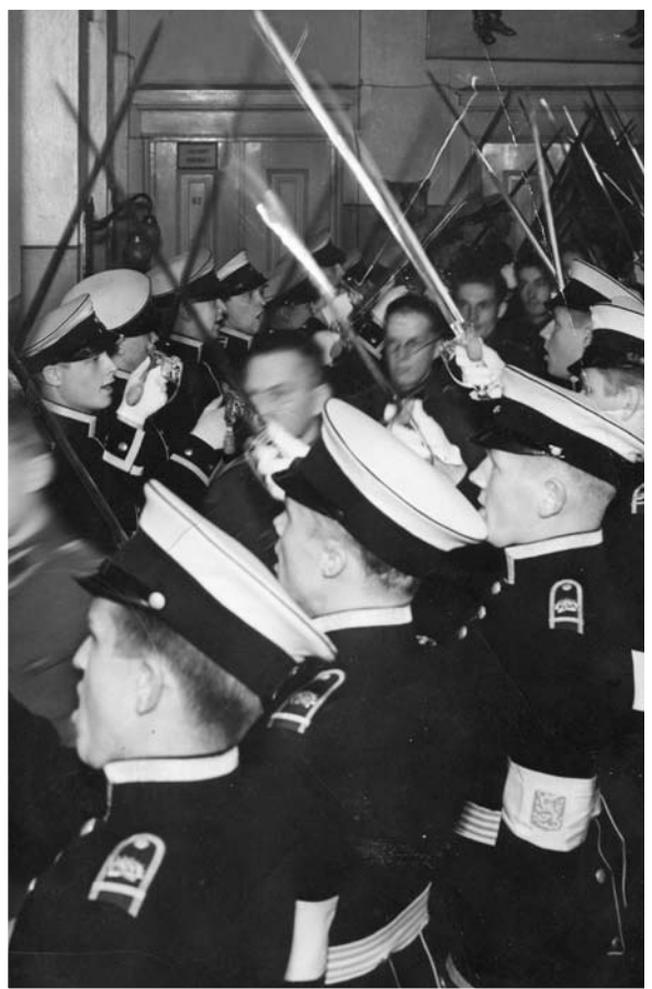
Nuoremmat kadetit saamassa diagonaali puvut 1939 Munkkiniemen Kadettikoulussa.