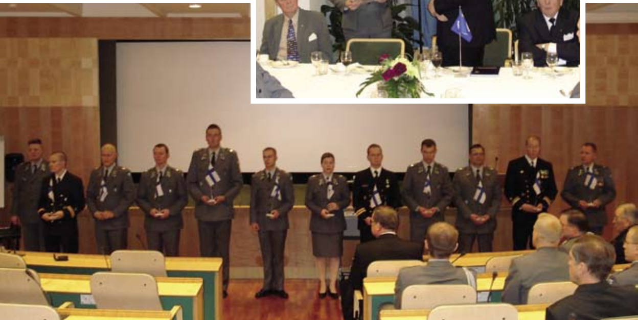
Vuonna 2006 valmistuneet uudet upseerit Metsäliiton tiloissa.