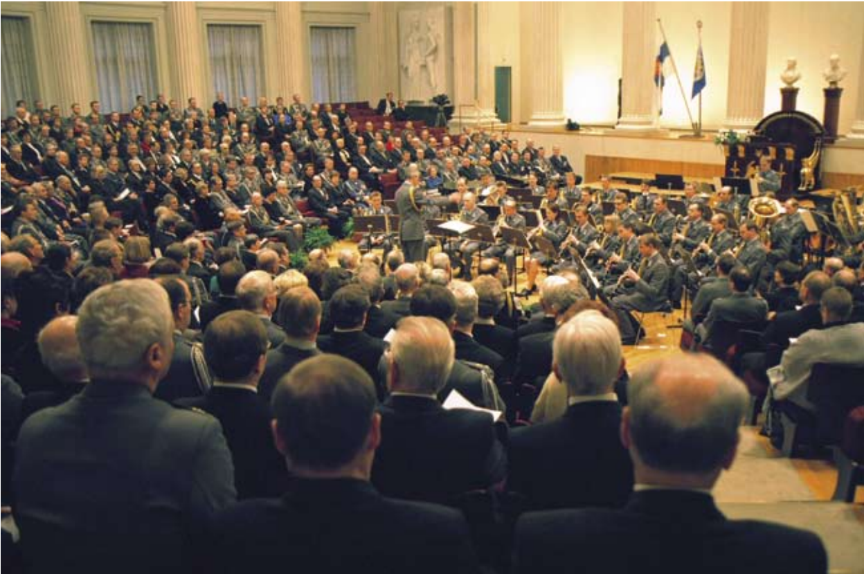
Kadettikunnan 80-vuotisjuhlallisuuksien päiväjuhla Helsingin Yliopiston juhlasalissa.