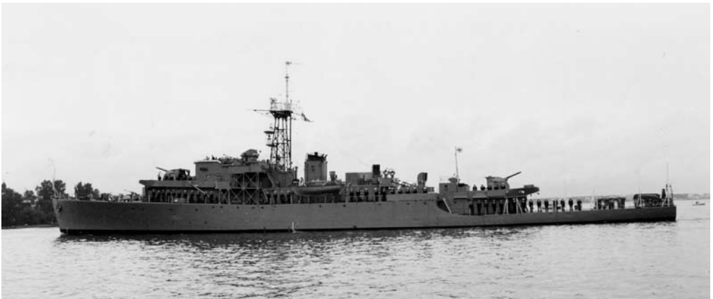
Koululaiva Matti Kurki Helsingin edustalla.