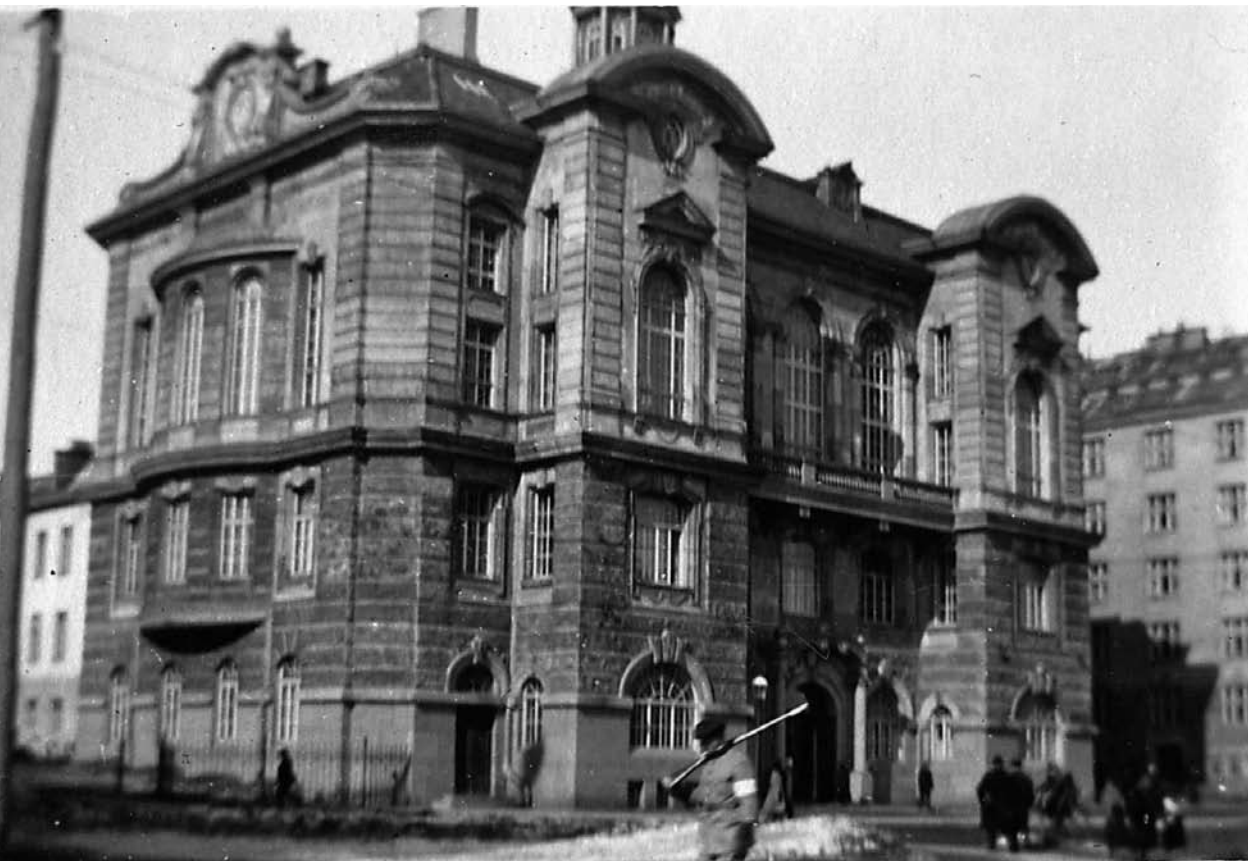
Kadettikoulurakennus Helsingissä Arkadiankadulla.