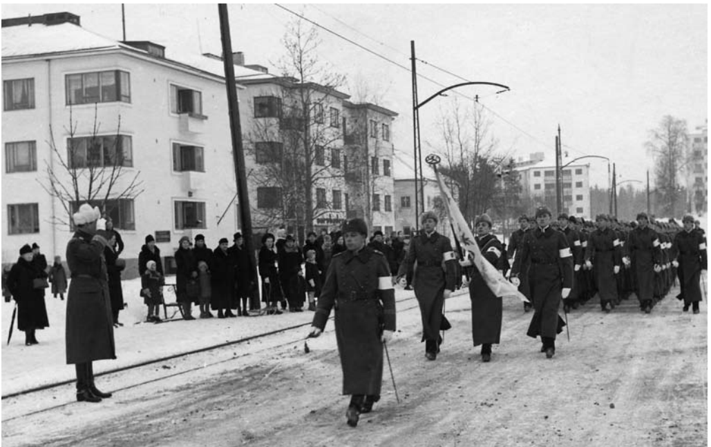
Sotamarsalkka Mannerheim ottamassa ohimarssia vastaan 28.1.1939 Munkkiniemessä.