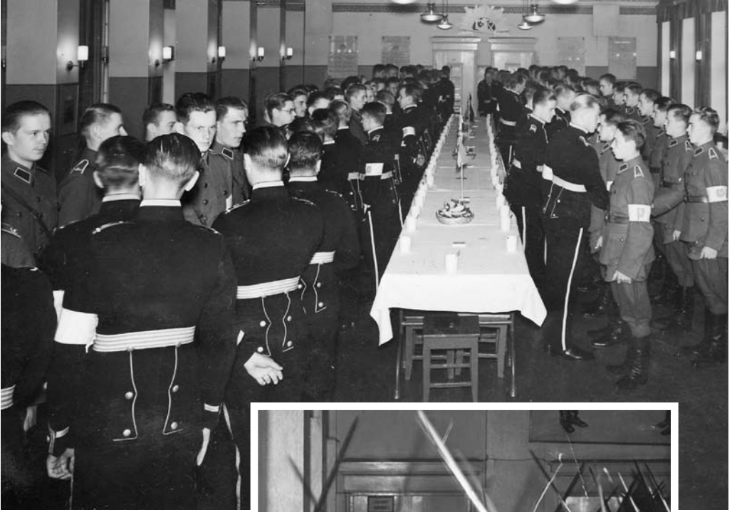
Vanhemmat kadetit "heittämässä tittelit pois" nuorempien kadettien kanssa 1939 Munkkiniemen Kadettikoulun ruokasalissa.