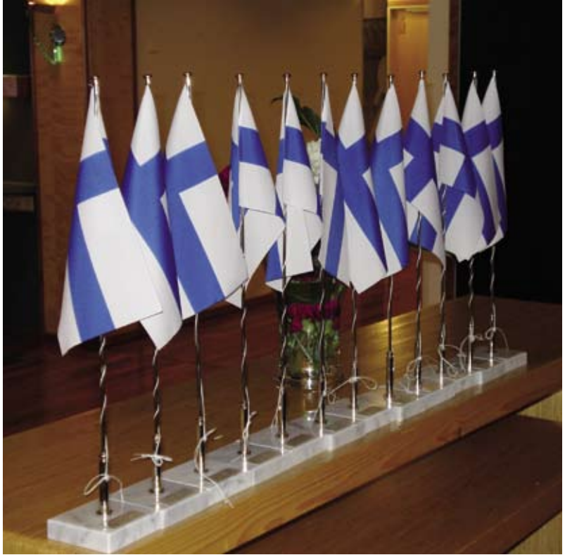
Näyttävä Suomen pionislippujen rivistö valmiina jaettavaksi uusille kadettiupseereille.

myöhemmin tähän tapahtumaan on liittynyt Suomen pionislipun luovuttaminen vaalittavaksi, vastavalmistuneelle upseerille. Viime vuosina on kadettikvartetti ja Kaartin Soittokunnan soittoryhmä viihdyttäneet osallistujia.