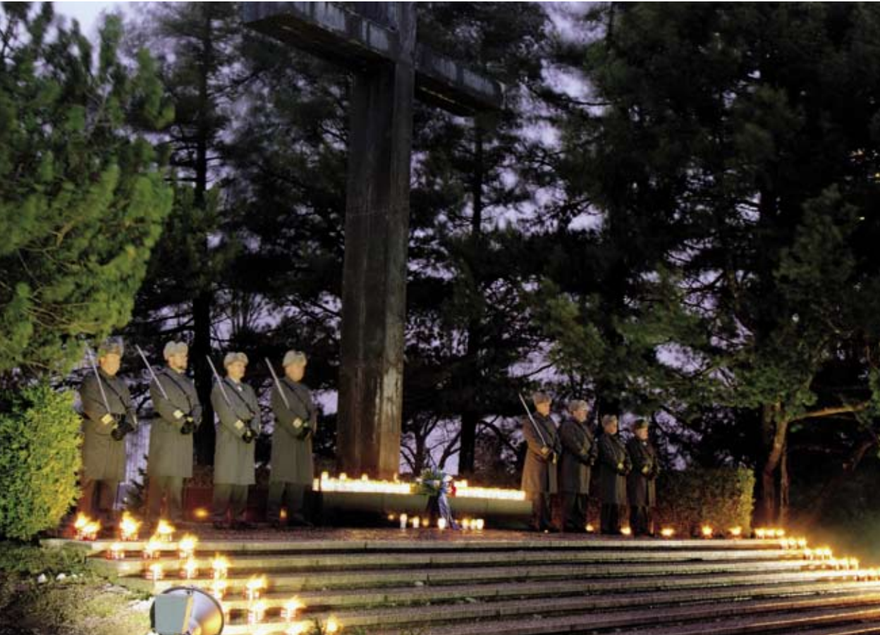
Jouluaaton muistohetken kunniavartiointi sankariristillä Hietaniemen sankarihautausmaalla.