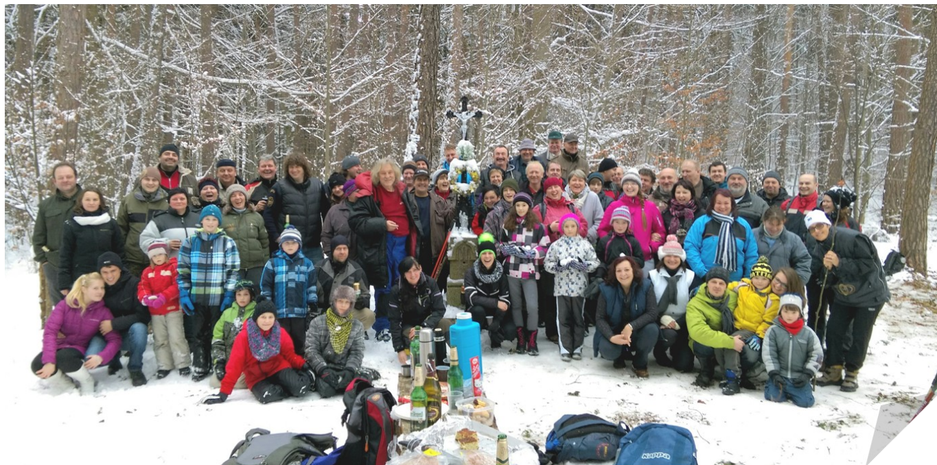
U křížku na Čepičné