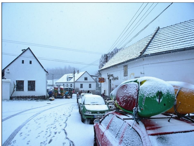
Bílá zima přišla v cíli