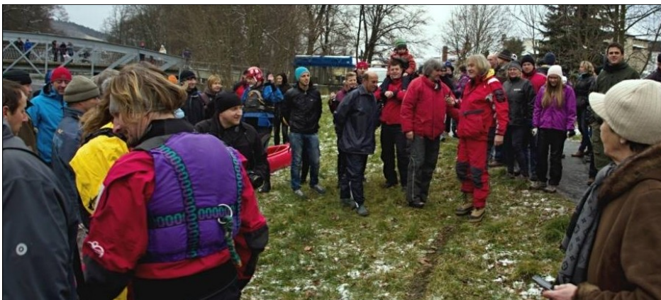
Instruktáž před sjezdem