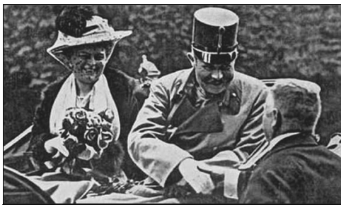
Ferdinand d'Este s Žofií Chotkovou

uvádějí, nebylo Sarajevo nejhlavnějším a jediným důvodem, proč první světová válka vznikla. Hlavní evropské mocnosti vytvořily zásadní seskupení a sice Dohodové mocnosti, které byly reprezentovány Ruskem, Francií a v pozadí opatrnou Británií a jako protiváha zde vznikl spolek Ústředních mocností (tak se označovaly), Rakousko – Uhersko, Německo a původně nevyzpytatelná Itálie.