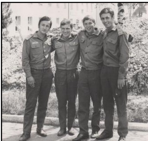
Kamarádi ve zbrani (1973)

Samozřejmě, že jsem mu to musel zatrhnout. Spoustu času jsem tedy byl nucen trávit v nekonečném bahně výcvikového prostoru Hradiště v Doupovských horách. Byla to sice otrava, ale člověk si musel poradit. K přežití bylo důležité teplo, to zajišťovala sanitka, vynikající skříňová Tatra 805, která měla malá kamínka, která se ládovala zvenku a pak hlavní zásada, nikdy se nehnout od polní kuchyně. Mimochodem k té sanitě. Říkalo se jí kačena pro její měkké pérování a houpavý pohyb. Měla vzduchem chlazený motor, který vytvářel typický ječivý zvuk a používala se na všechno možné. Náš