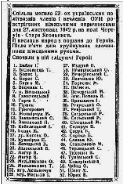
Листівка ОУН(б) із переліком розстріляних 27.11.1942 р. націоналістів (зворотний бік)