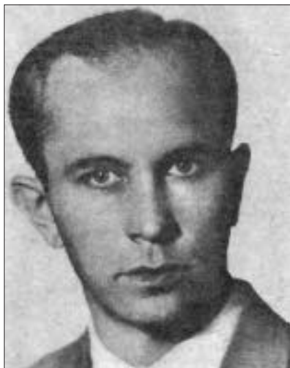
Володимир Федак – тереновий провідник ОУН(б) в Німеччині 1943 р.