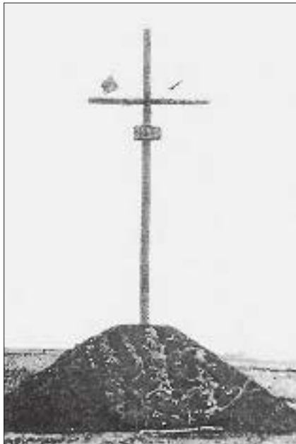
Братська могила націоналістів, розстріляних Гестапо 27.11.1942 р. неподалік Старої Ягільниці