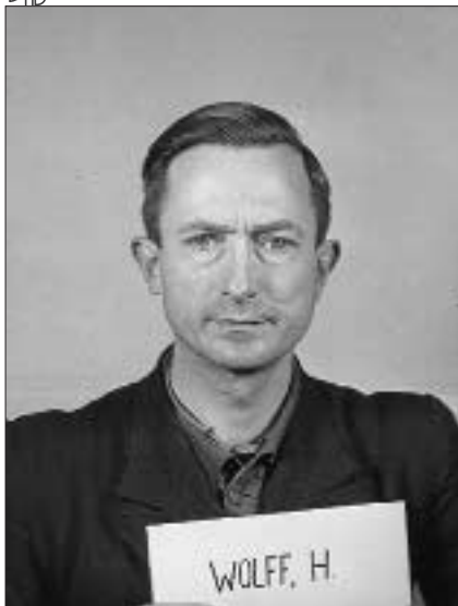
Обер-штурмбанфюрер СС Ганс Гельмут Вольфф на Нюрнберзькому процесі

До початку масових арештів членів ОУН А. Мельника слідчі його не викликали.