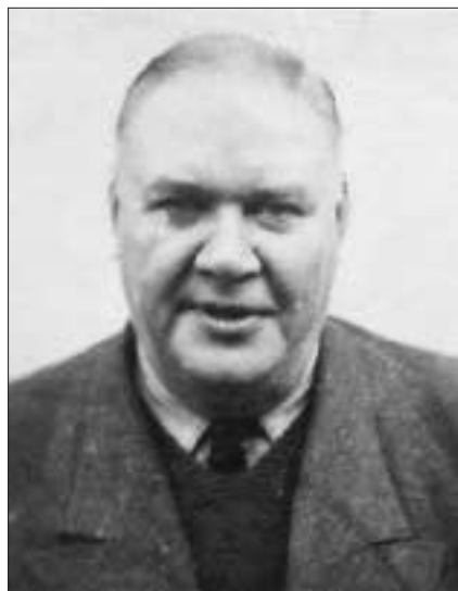
Гауптштурмфюрер СС Віллі Вірзінг. 1950 р.

24 січня 1951 р. в м. Нюрнберг-Фюрті у Західній Німеччині відбулося судове засідання у справі гауптштурмфюрера СС Вільгельма Вірзінга. Йому інкримінували участь у 15 допитах, на яких він сам або інші особи за його наказами застосовували тортури. Жертвами цих тортур під час Другої світової війни були українські націоналісти.