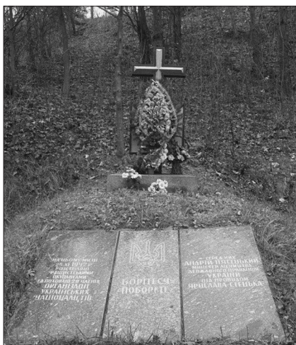
Пам'ятник розстріляним Гестапо у Львові 27.11.1942 р.