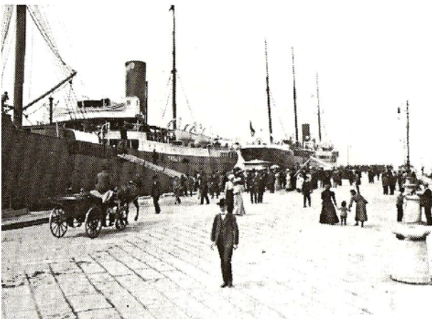
Svenska truppen går ombord på S/S Talia i hamnen i Triest. I skeppet bakom, S/S Amfitrite, färdades norrmän, Danskar, tyskar och ungrare.