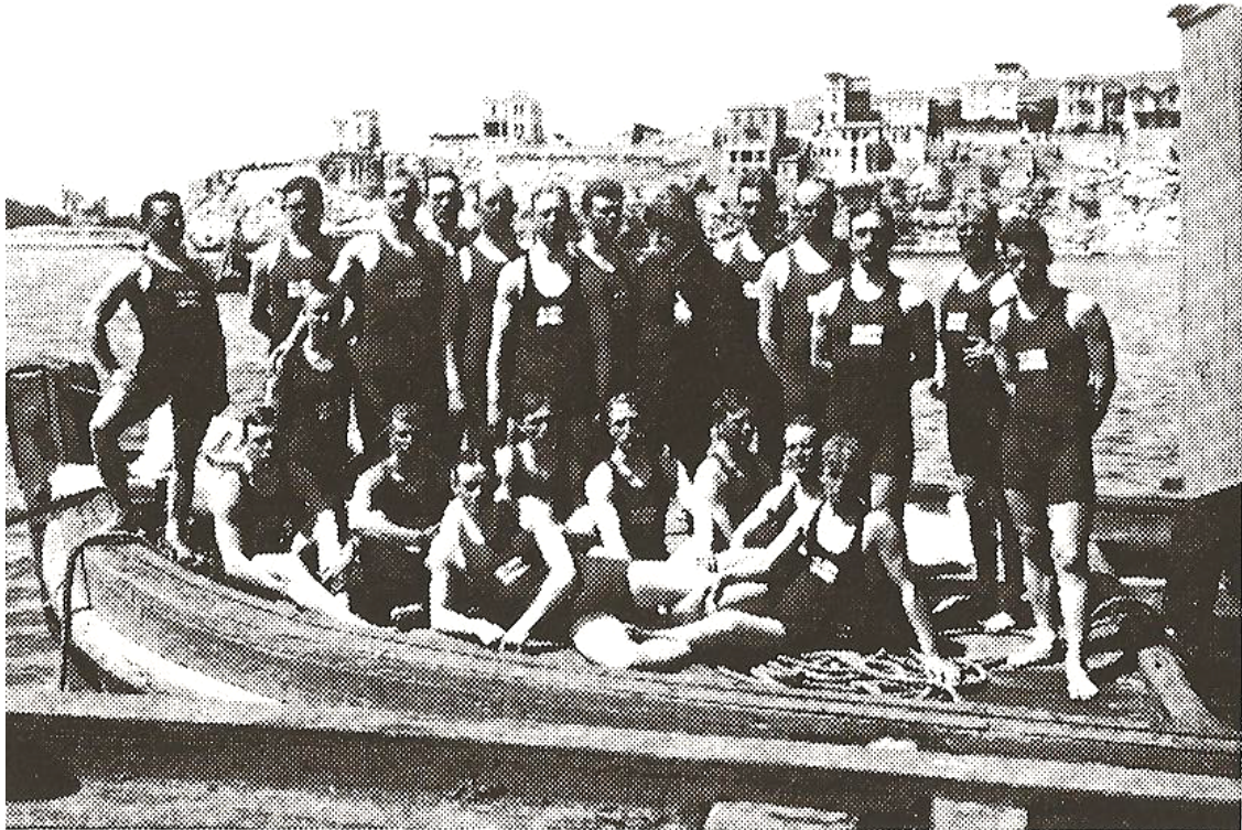
Den svenska OS-truppen i simning 1906 vid Phaleron.