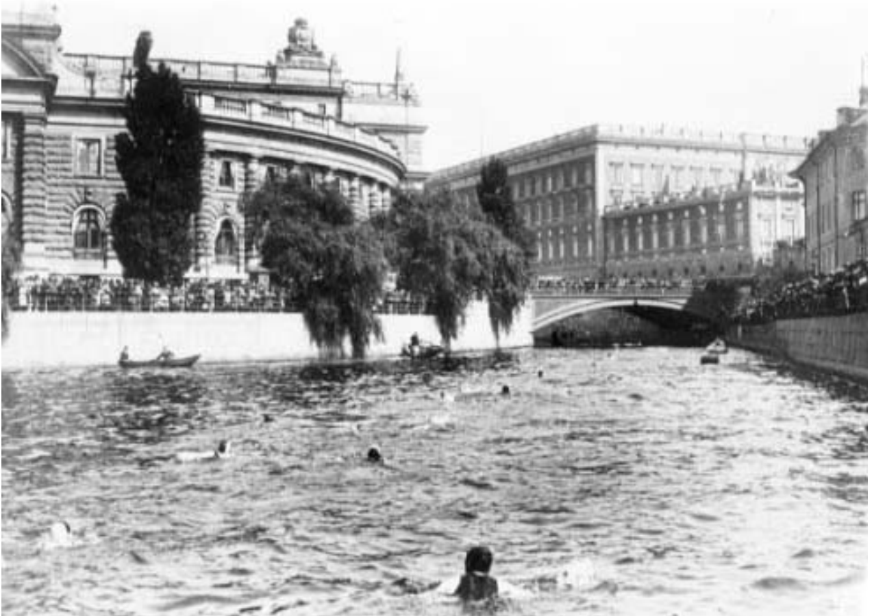
Strömsimningen (se 100ÅB/s.260) - simmarna på väg in i Stallkanalen, under Stallbron, mellan Riksdagshuset och Slottet.