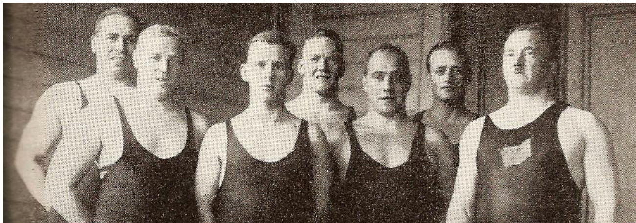
Neptuns första vattenpolomästare, 1925, och som försvarade titeln året efter.