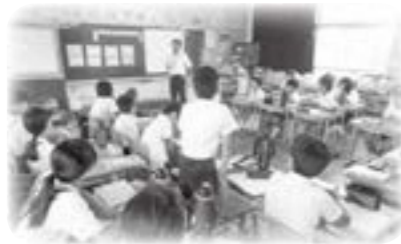
小学校の授業風景