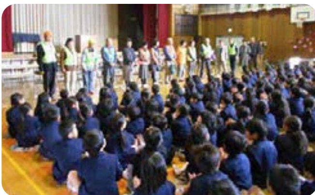
ありがとうございます。地域ボランティア感謝の会(国府小学校)