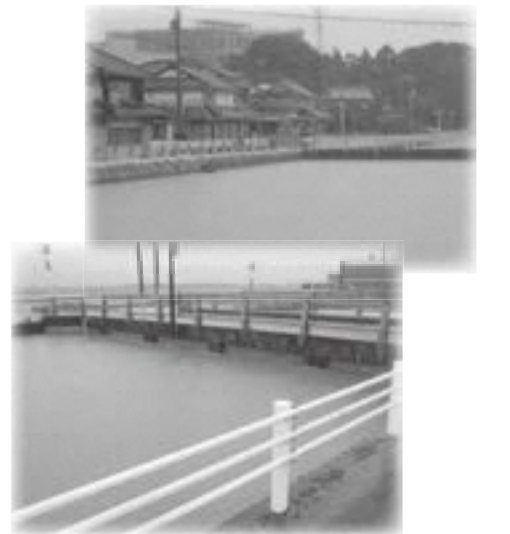
豪雨により氾濫しそうになっている干田川