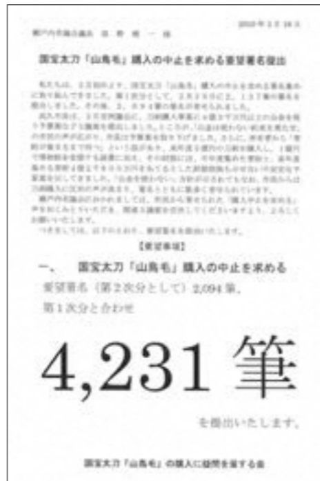
提出された国宝太刀「山鳥毛」購入の中止を求める要望署名