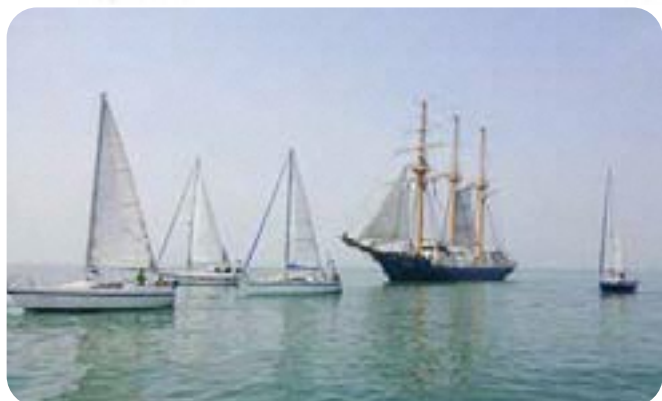
牛窓ヨットクラブの皆さんが、「帆船 みらいへ」にウェルカム伴走