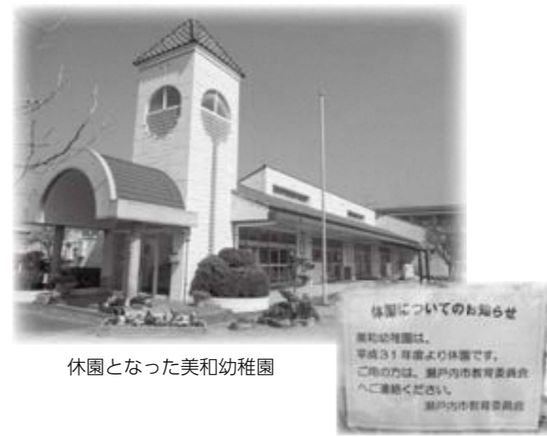
休園となった美和幼稚園

ろう者の方が地域社会において情報の取得や、手話の利用しやすい環境の整備として市職員を対象に手話研修を行った。