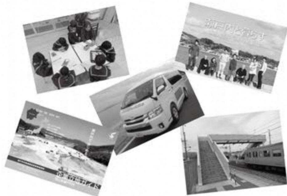
企業誘致、子育て支援、公共交通の充実、公共施設のバリアフリー化など課題は多い

入口の自動ドア化、多目的トイレの設置、点字表示を行うなど、バリアフリー化を目指して取り組んでいる。