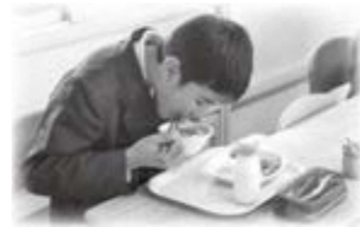
おいしく給食を食べる児童

業者選定は、プロポーザル（提案型）方式で行い、選定に際しては、提案金額に加え、提案された諸々の事項を総合的に審査し、慎重に決定する。