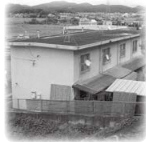
建て替えが急がれる市営住宅

問 平成32年度国保税の引き上げもありうるとのことだが、国保に活用されてこなかった財政安定化支援事業2億円は国保に使うと市長は約束している。 市長 現時では、市単独での事業であった。県下統一化された今、基準外の一一般会計の繰り出しは難しくなってきた。