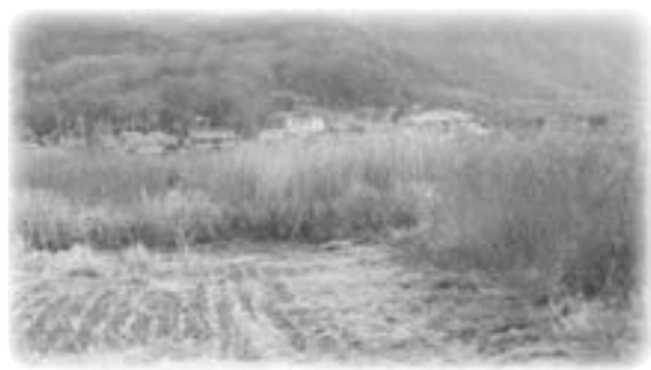
どうにかせんと、耕作放棄地(長船町磯上地域)

従前から述べている私自身の言葉に対する責任もあるわけであり、その責任を果たすためのあらゆる努力を注いでいきたい。