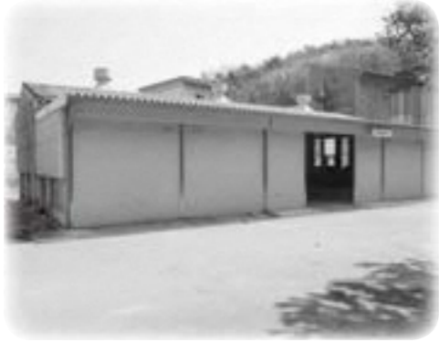
老朽化しているストックヤード

答 将来的には閉鎖する方向である。解体や跡地の利用について、地元の方と具体的な話をし、早いうちに計画を立てる。