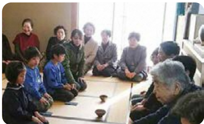
一服どうぞ(長船東保育園 地域サロンとの交流お茶会)