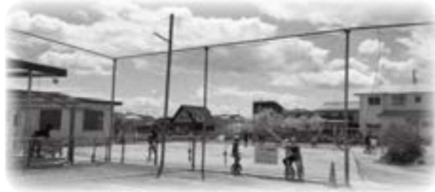
市内の放課後児童クラブ

問 子育て支援策を一生懸命やっていきたいと思いは変わりはないので、財政が許せば前向きに考えたい。 市長 子育て支援策を一生懸命やっていきたいと思いは変わりはないので、財政が許せば前向きに考えたい。