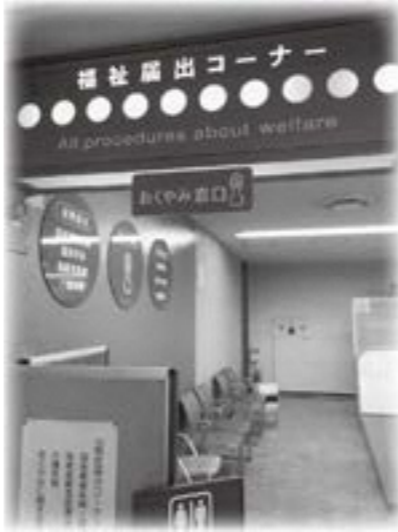
松山市で取り組んでいる市民サービス

条例を制定することによって、これまででできなかった事業を進めていける事案があるか否か。また、条例を制定するようになれば、その機運を高める組織づくりも必要と考え、検討する。