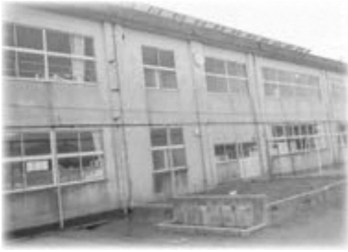
まだ40年持たすのか 行幸小学校

問 行幸小学校校舎は、来年度から約10億円をかけて大規模改修の予定だが、ハザードマップでは、3mから5mも水が来ると想定している。避難所にも指定されており、建て替えて高層化するべき。教育委員会に危機管理面から計画を見直せないかと提言しても、答えは返って来ない。危機管理部にはその権限もない。これでは、組織として機能しないのではないか。