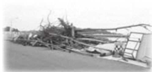
台風時の流木などの対応をどうしていくのか