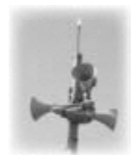
聞こえにくい屋外スピーカー