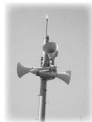
聞こえにくいと言われる防災行政無線

また、小学校において、総合学習の時間を使い、手話出前講座を行い、子ども達に手話への理解も深めてもらった。 今後も研修や講座を開催すると共に、広報紙やリーフレットの配布など啓発に取り組む。