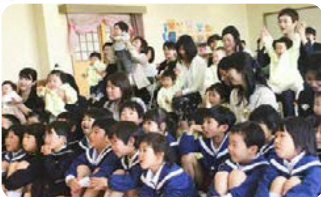
読み聞かせの絵本に夢中(福田保育園)