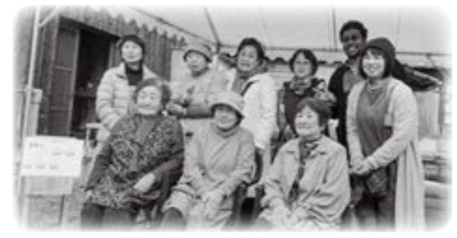
地域おこし協力隊と地域の人で開催した牛窓のまち歩きイベント

問 地域おこし協力隊の活動は市政にどう生きているか。また、任期終了後、ビジネスとして活躍できるよう行政としてフォローすべきでは。 消防長 平成31年度から電話通訳センターを介した3者間同時通訳を導入し、英語をはじめとし、16言語に対応できる予定である。