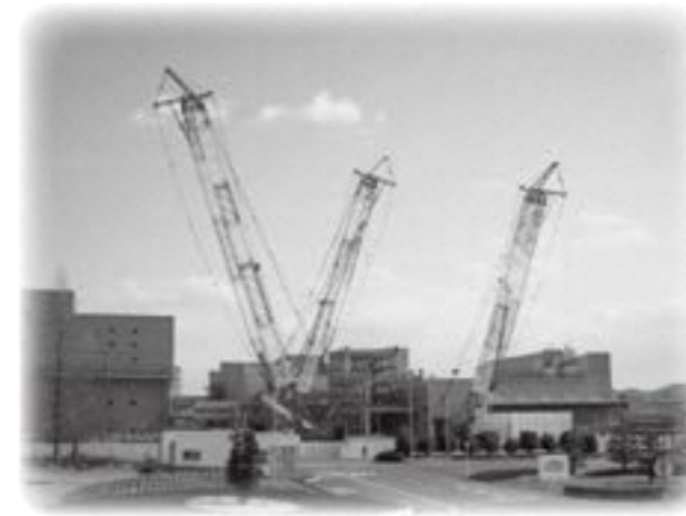
増築工事が進む岡山村田製作所