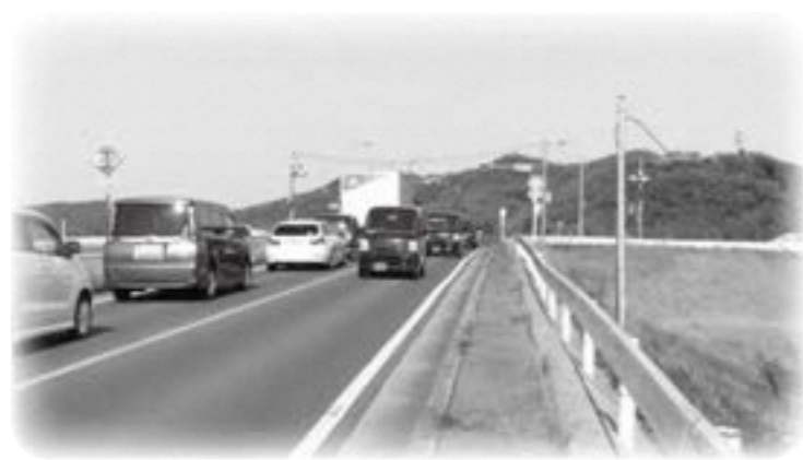
渋滞している邑上橋