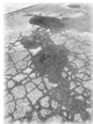
舗装の補修が必要な例